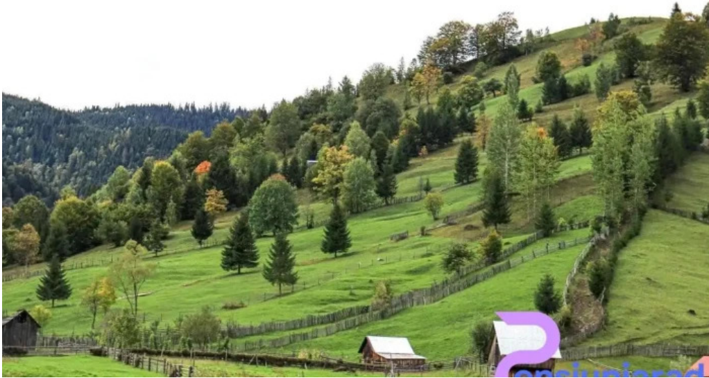
Ora? bro?teni romania