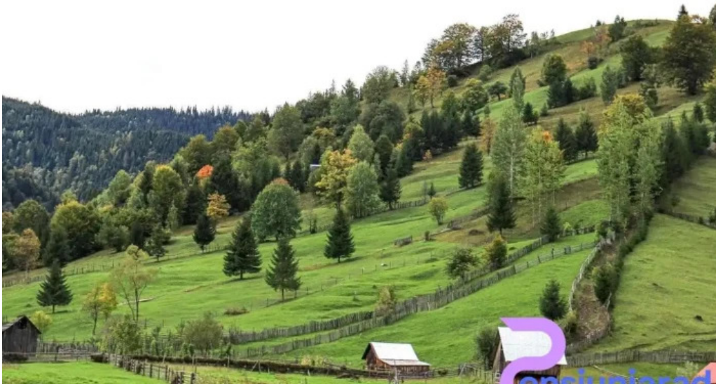
Oras brosteni videoclipuri