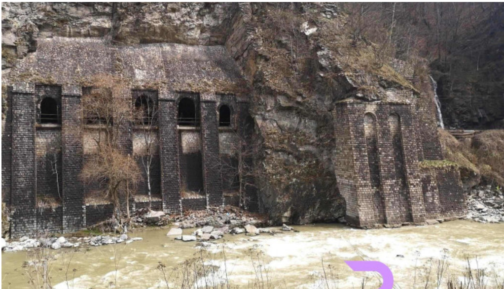
Oras aninoasa videoclipuri