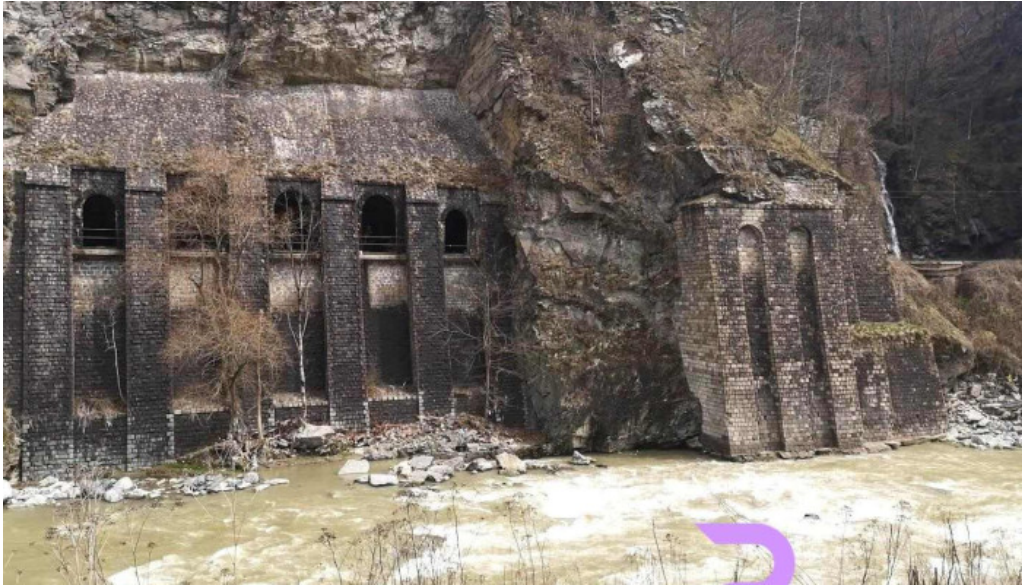
Ora? aninoasa romania