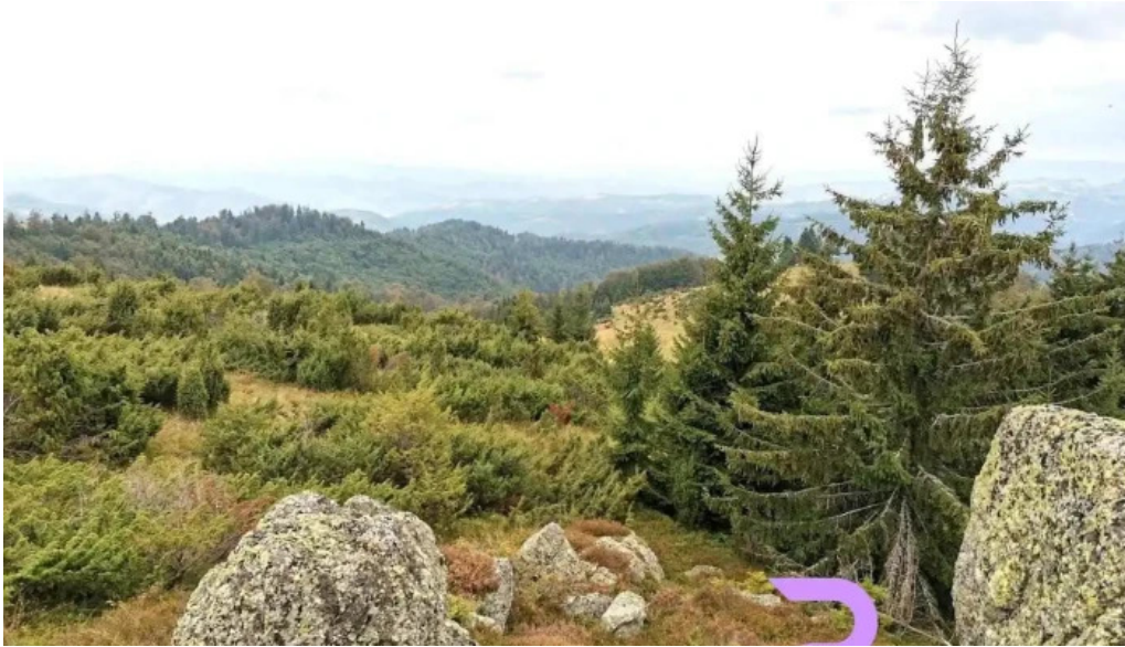
Comuna luncoiu de jos romania