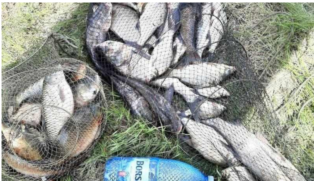
Comuna h?ne?ti romania