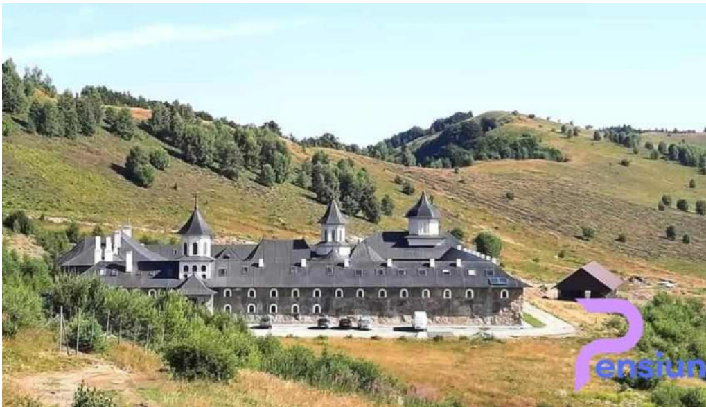
Ponor site web