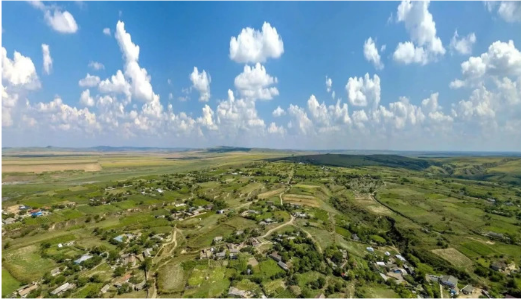
Peceneaga street view si 360deg