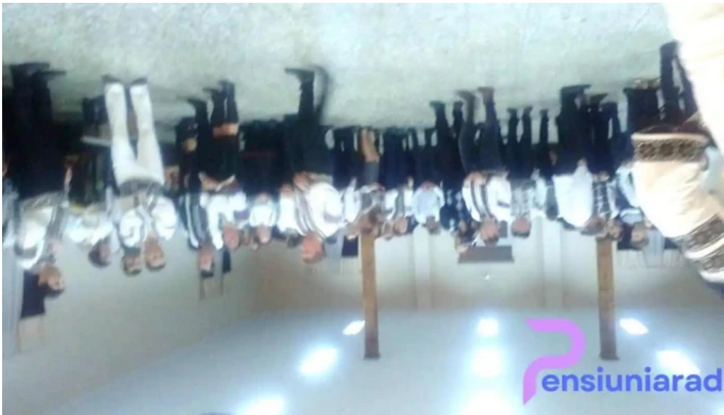
Parte?tii de jos parte?tii de jos