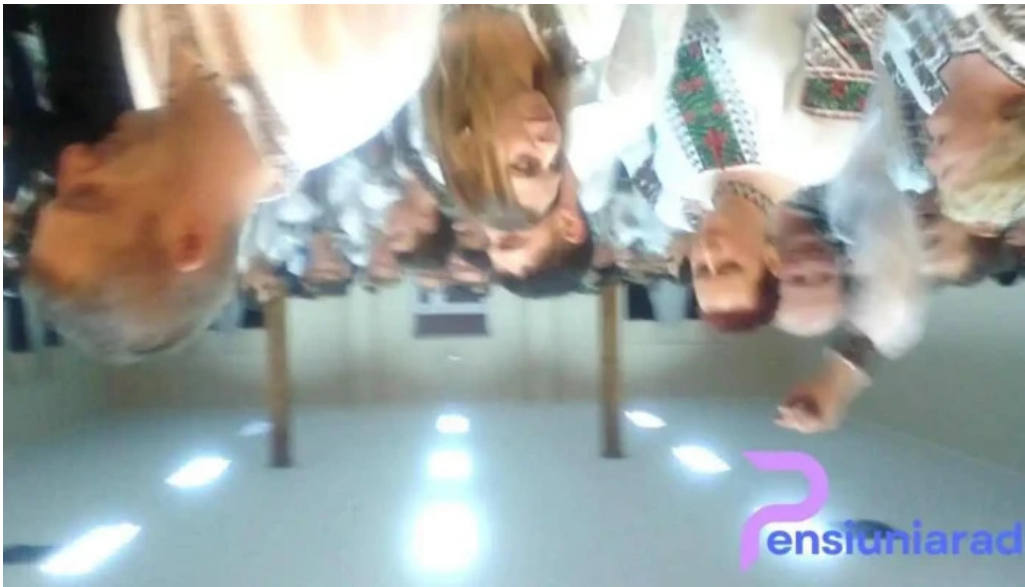
Partestii de jos num?r