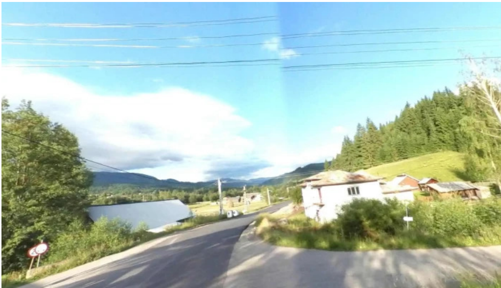
Neagra sarului street view si 360deg