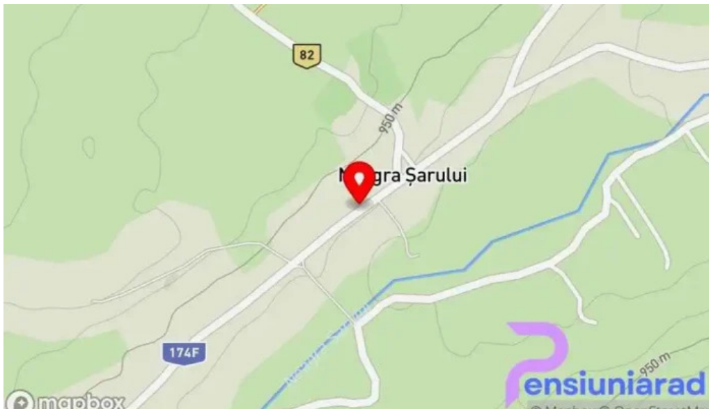
Neagra sarului hart?