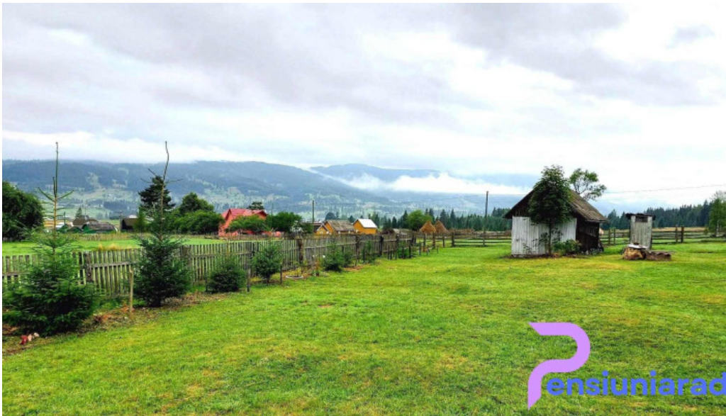
Neagra ?arului neagra ?arului