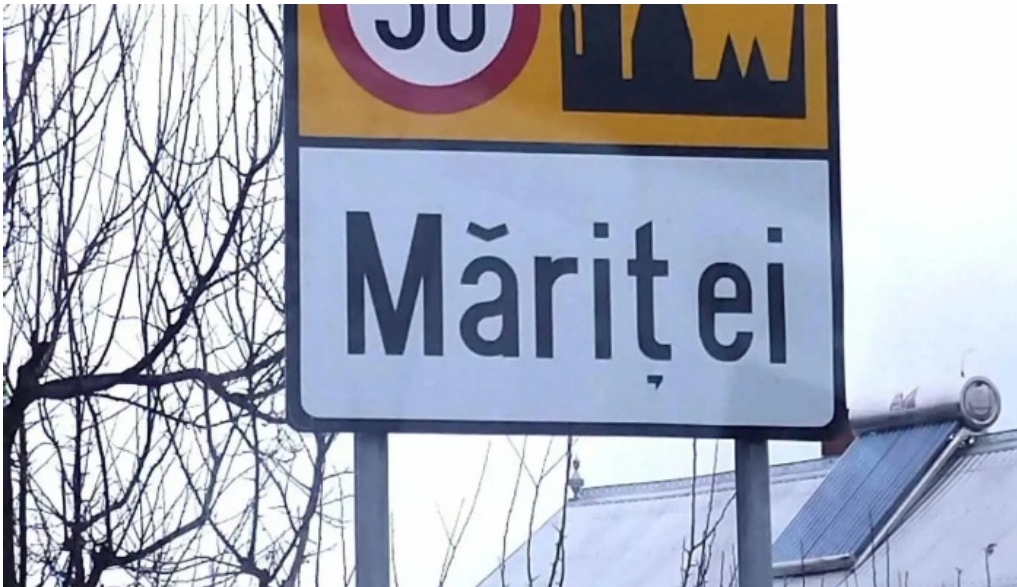
Maritei aproape de mine