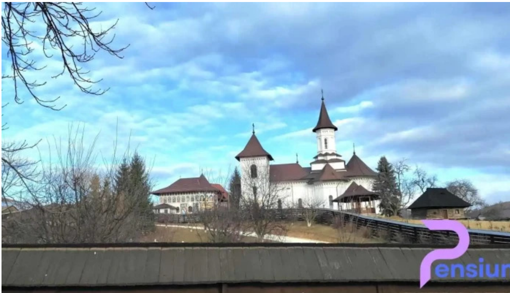
Manastirea humorului site web