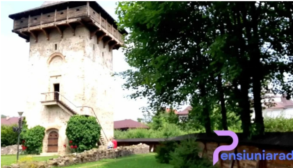
Manastirea humorului videoclipuri