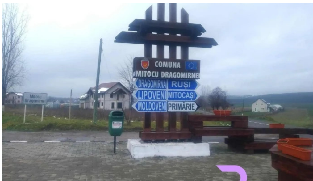
Mitocu dragomirnei deschis acum