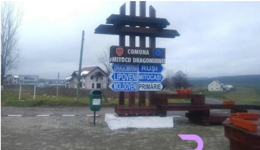
Mitocu dragomirnei mitocu dragomirnei