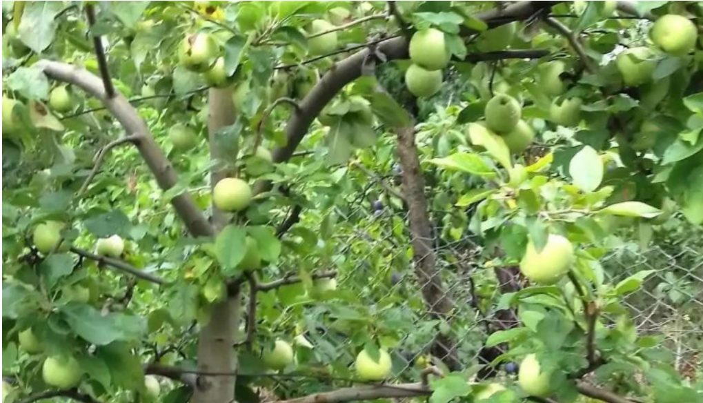
Lamaseni site web