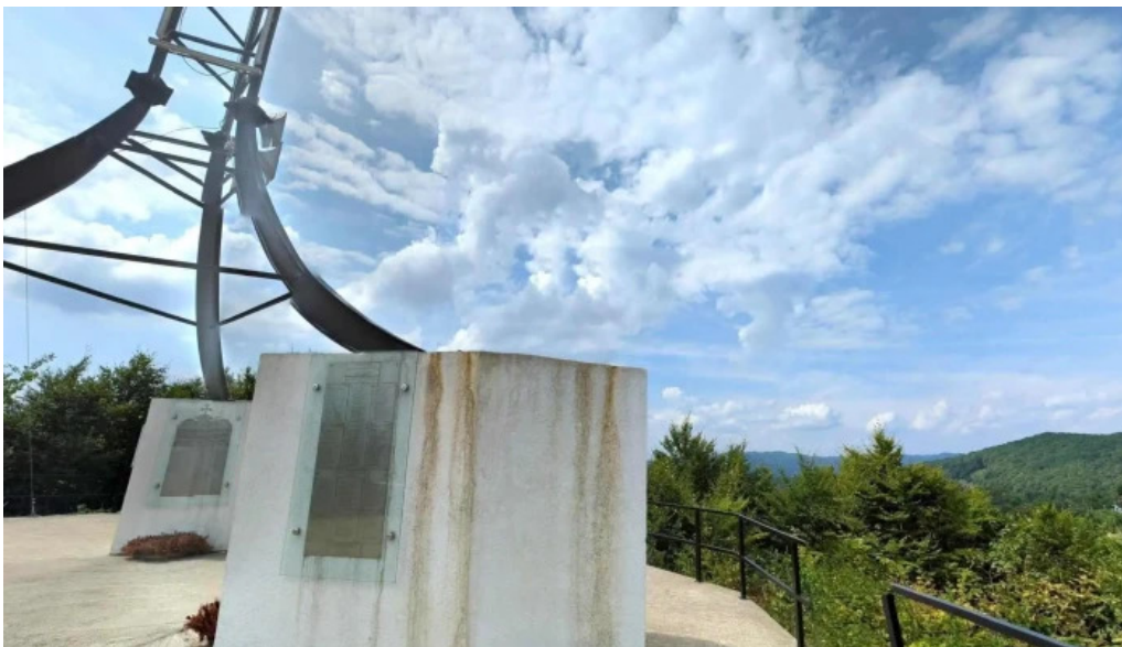
Livadea street view si 360deg