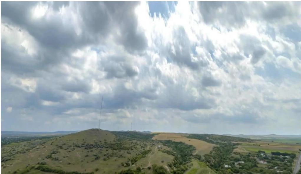
Garvan street view si 360deg