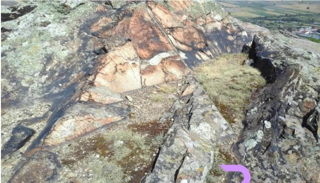
Garvan site web