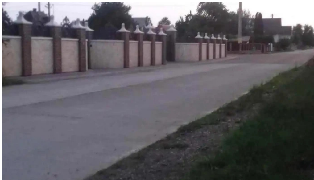
Fratautii vechi aproape de mine