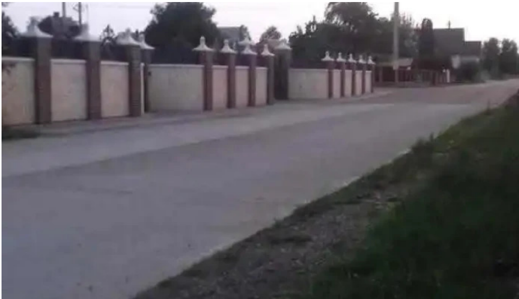
Frățuții vechi frățuții vechi