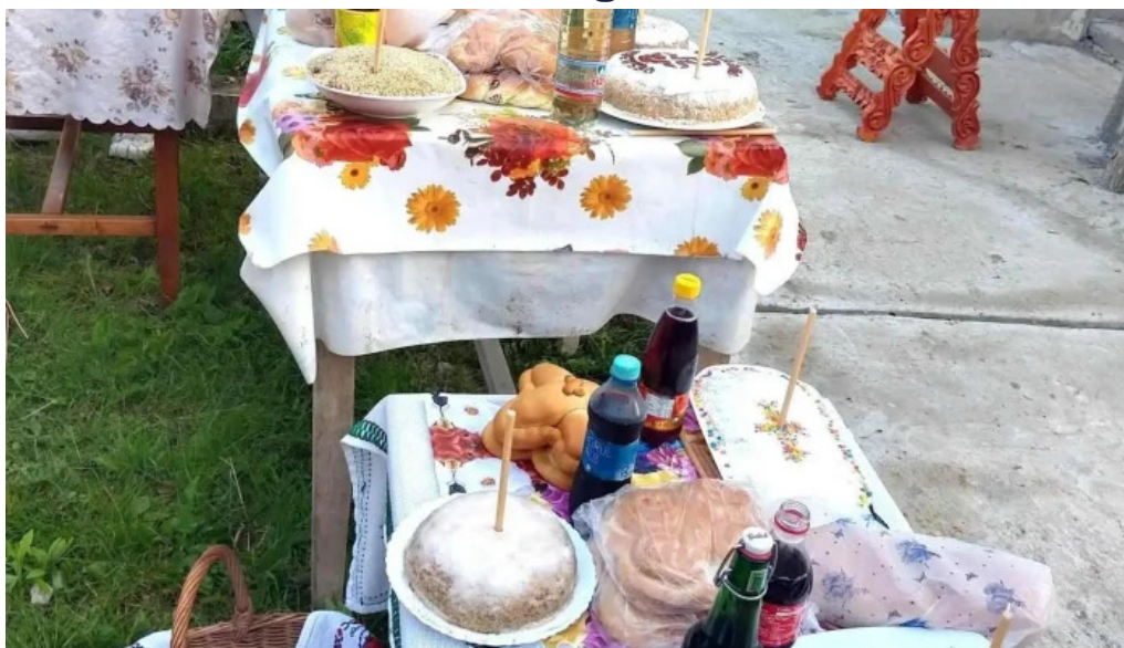
Cosmina de sus instagram