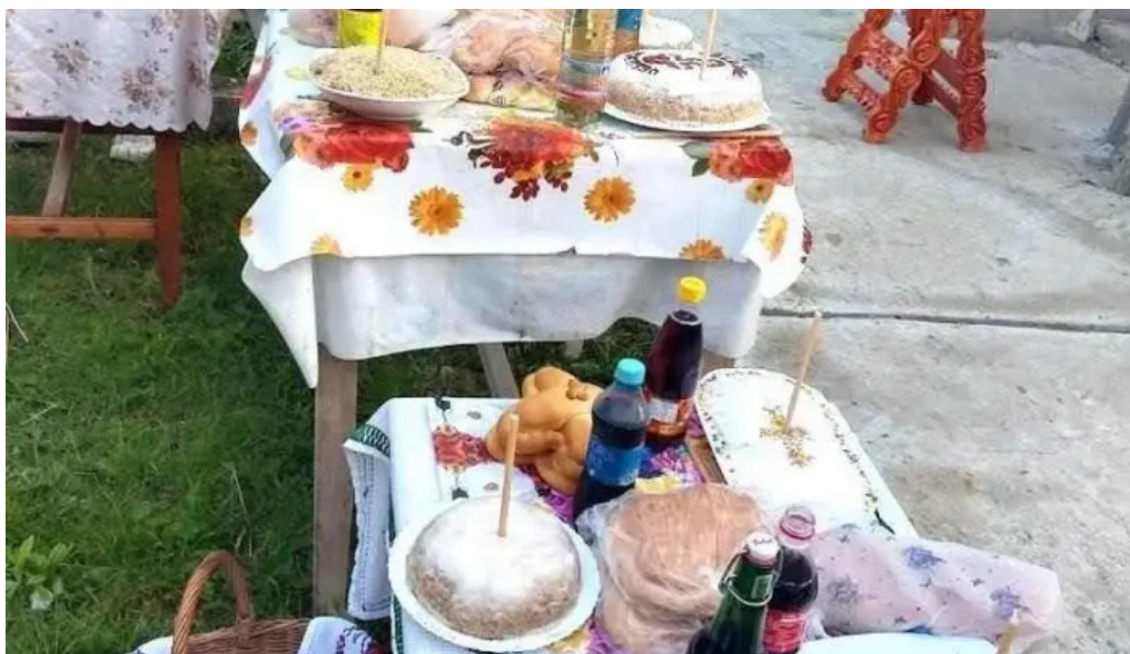
Cosmina de sus cosmina de sus