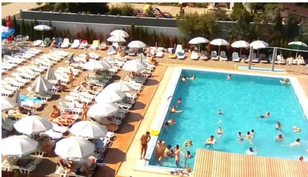
Barticesti deschis acum