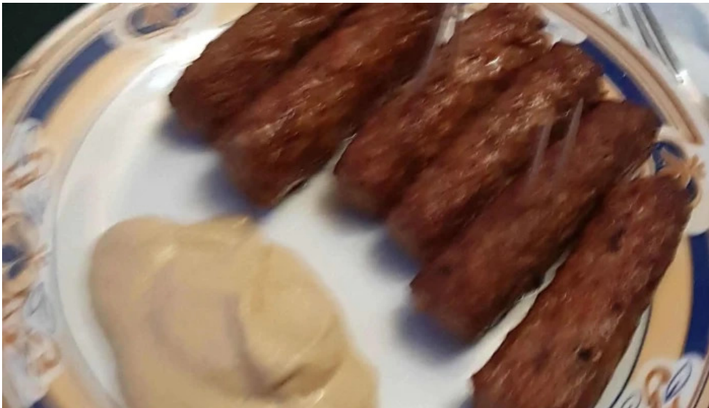
Hanul lui blaj num?r