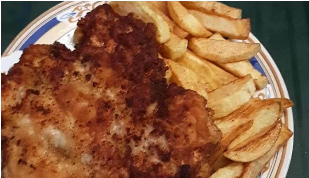
Hanul lui blaj some?u cald