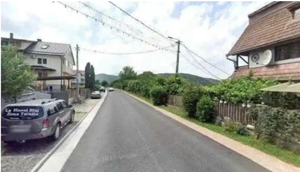
Hanul lui blaj street view si 360deg