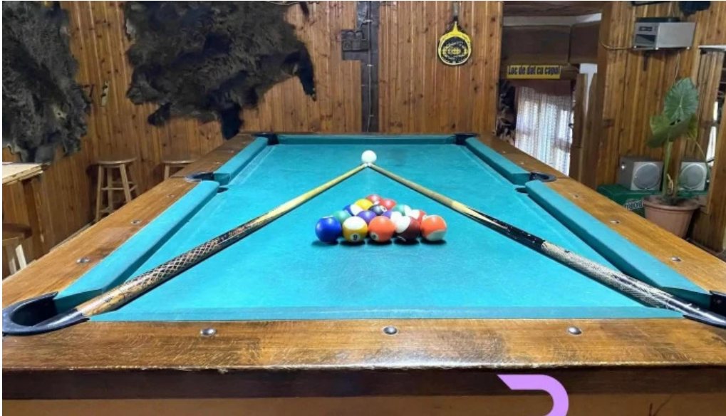
Hanul lui blaj dotari