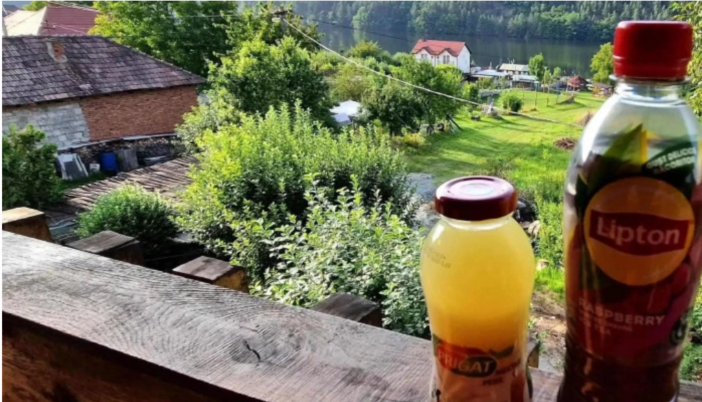
Hanul lui blaj loca?ie