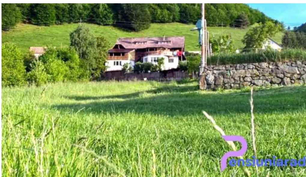
Hanul lui blaj exterior