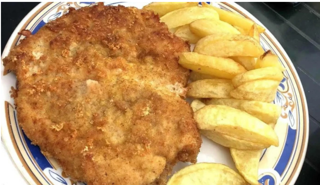
Hanul lui blaj mancaruribauturi