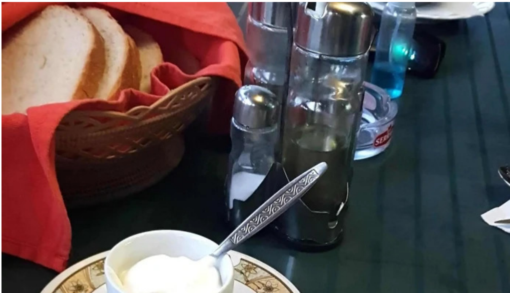
Hanul lui blaj deschis acum