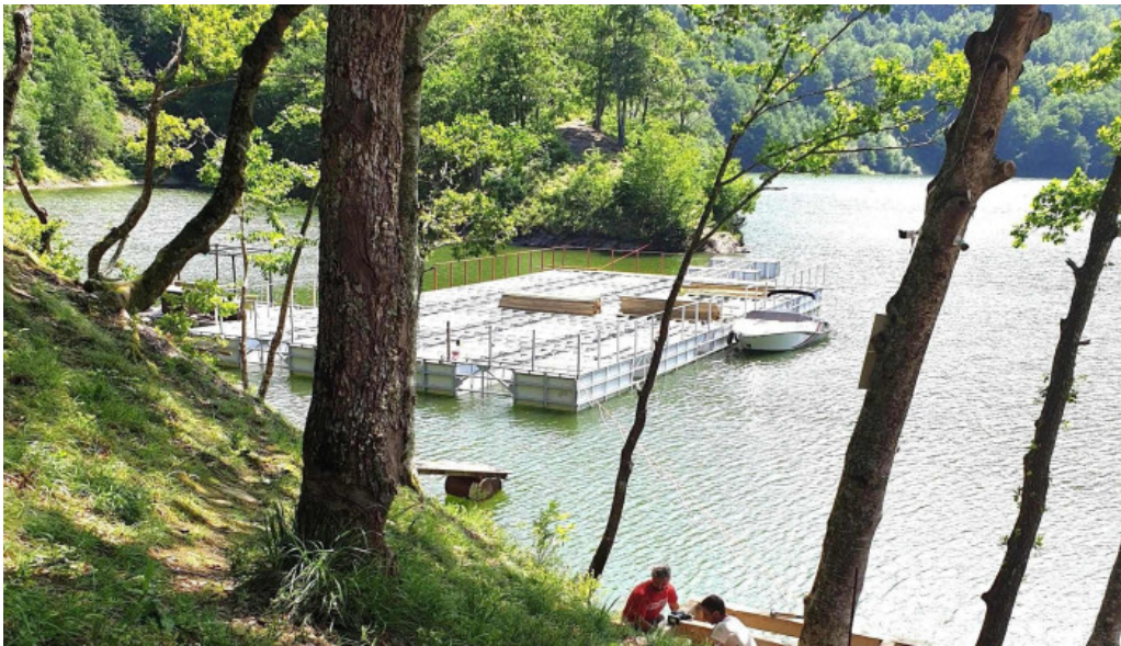
Hanul lui blaj program