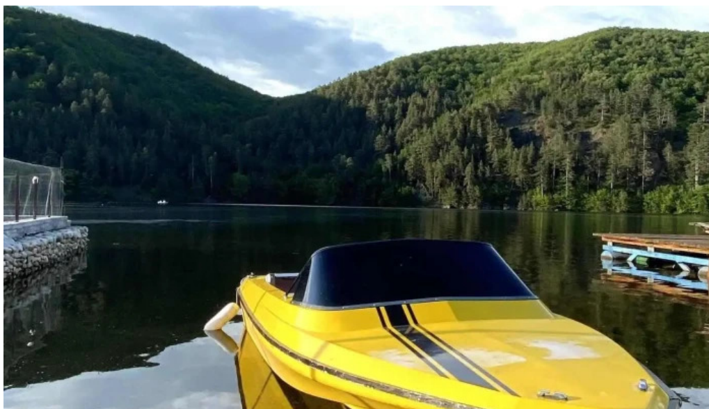
Hanul lui blaj de la proprietar