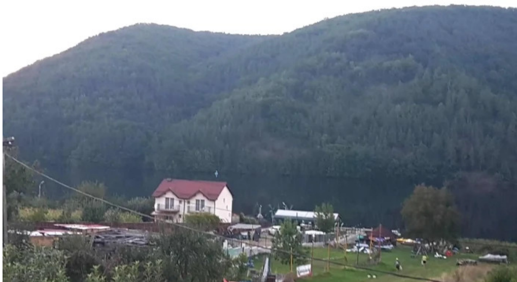
Hanul lui blaj fotografii