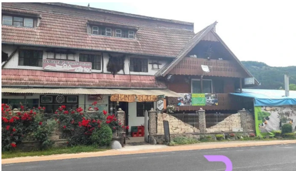
Hanul lui blaj de la vizitatori