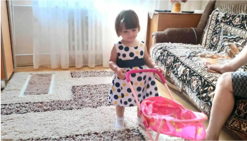
La nicosor pre?uri