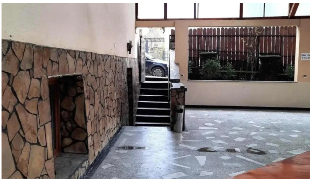
La nicusor de la vizitatori