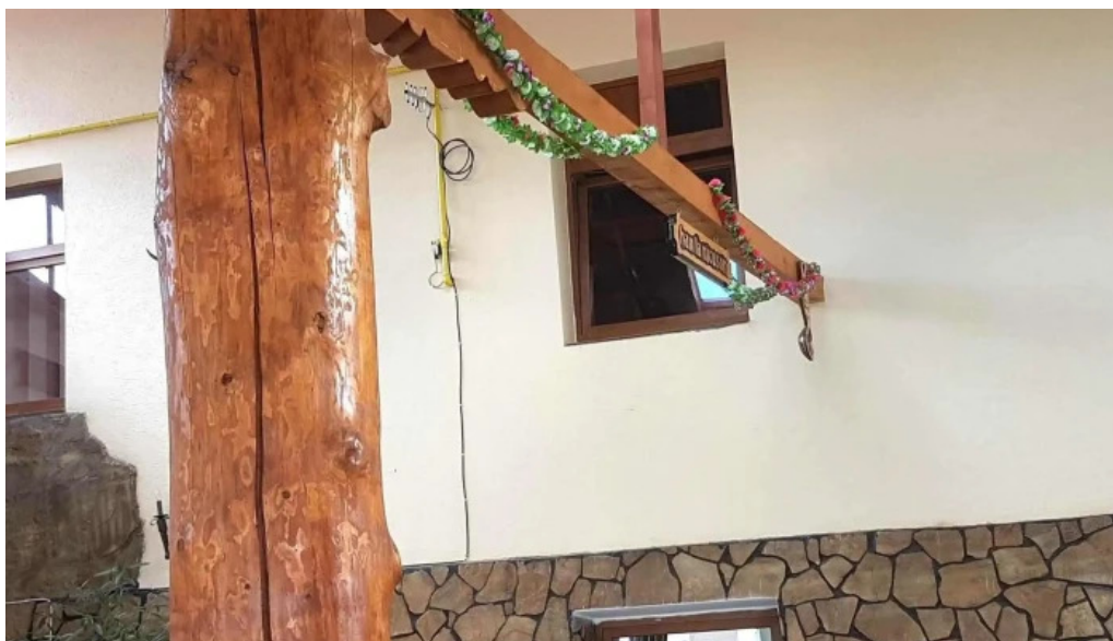
La nicusor deschis acum