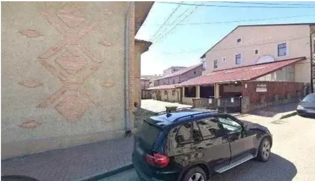
La nicusor street view si 360deg