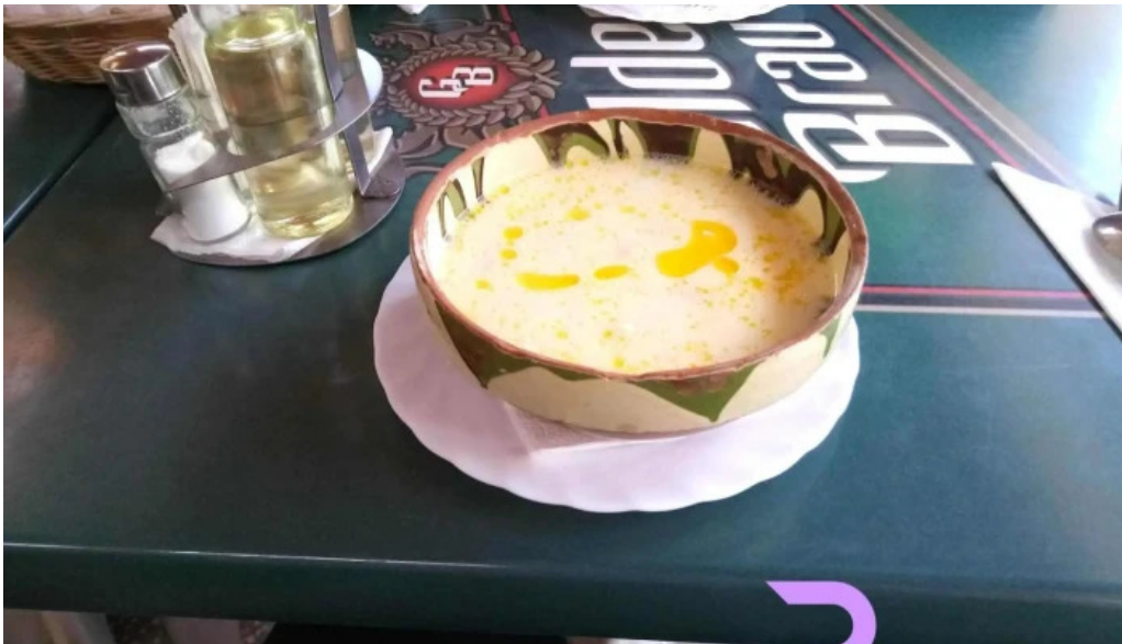
La nicosor mancaruribauturi