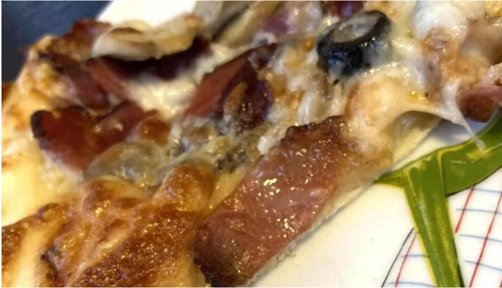
La nicusor siret