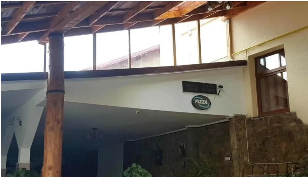
La nicusor scor