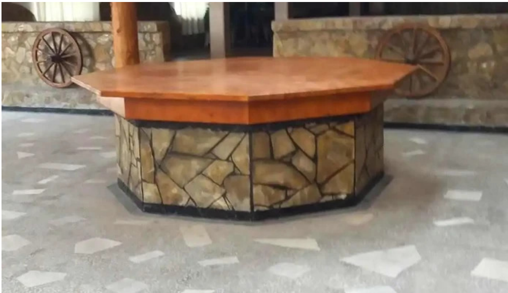
La nicusor exterior