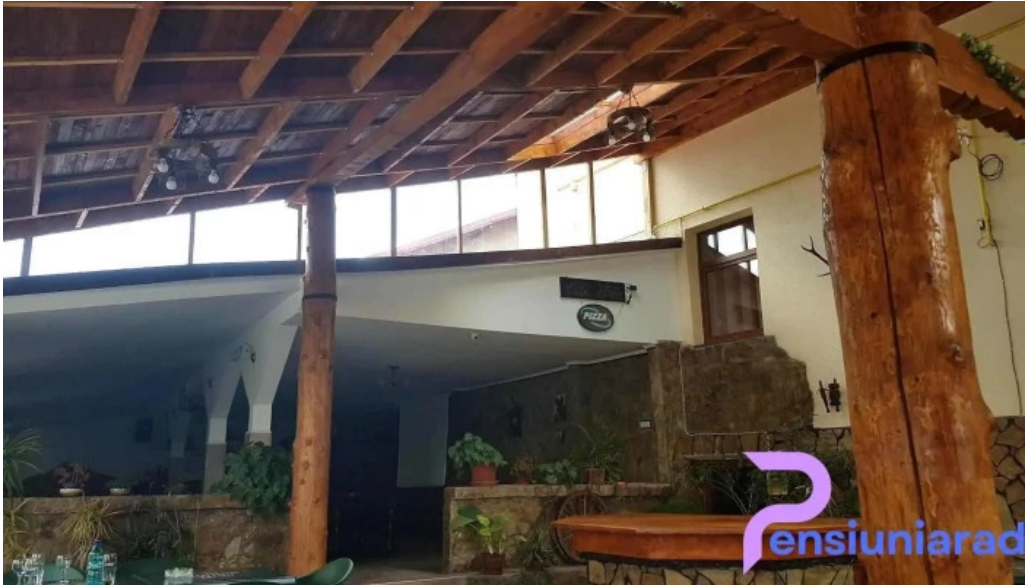
La nicu?or siret