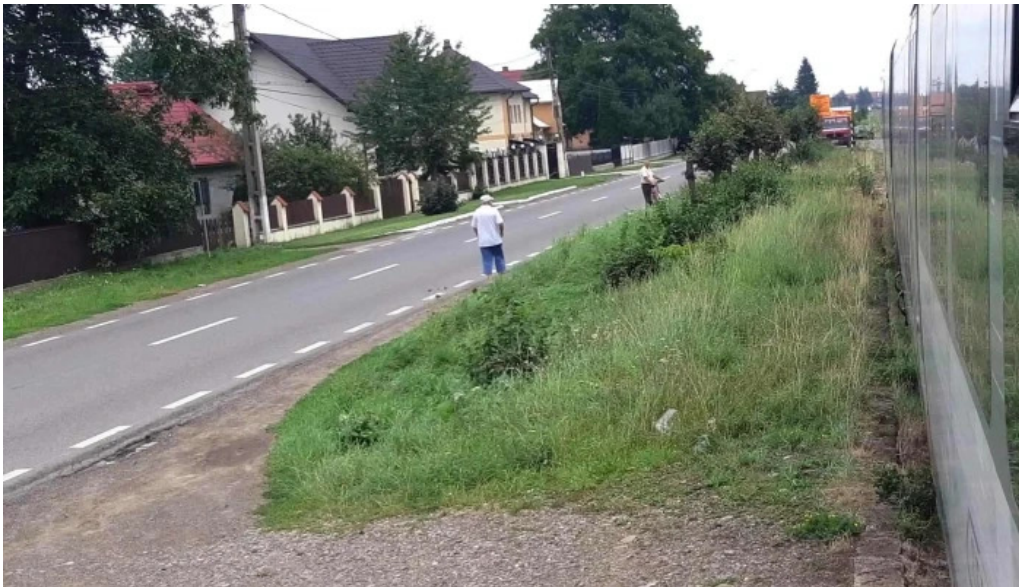
Vicovu de jos vicovu de jos