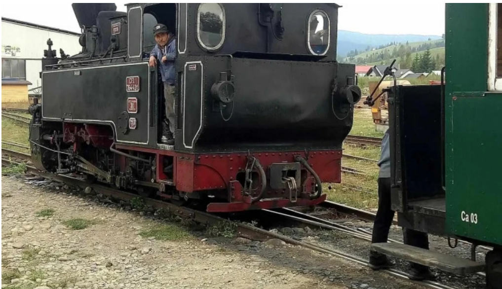
Vicovu de jos cum s? ajungi acolo