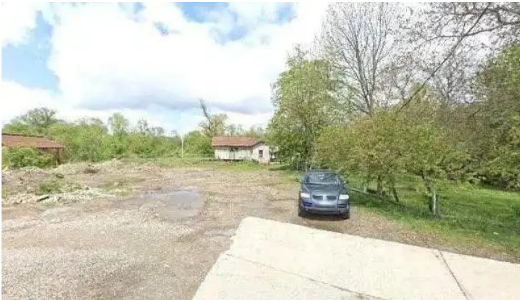
Vicovu de jos street view si 360deg