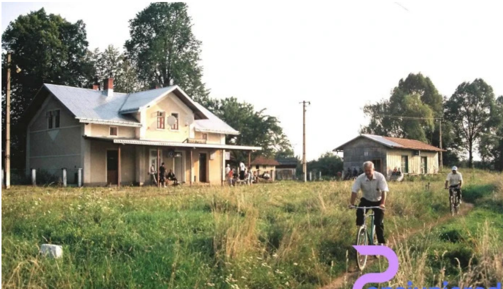
Gura putnei promo?ie