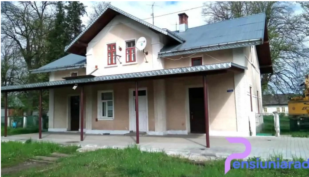
Gura putnei sina