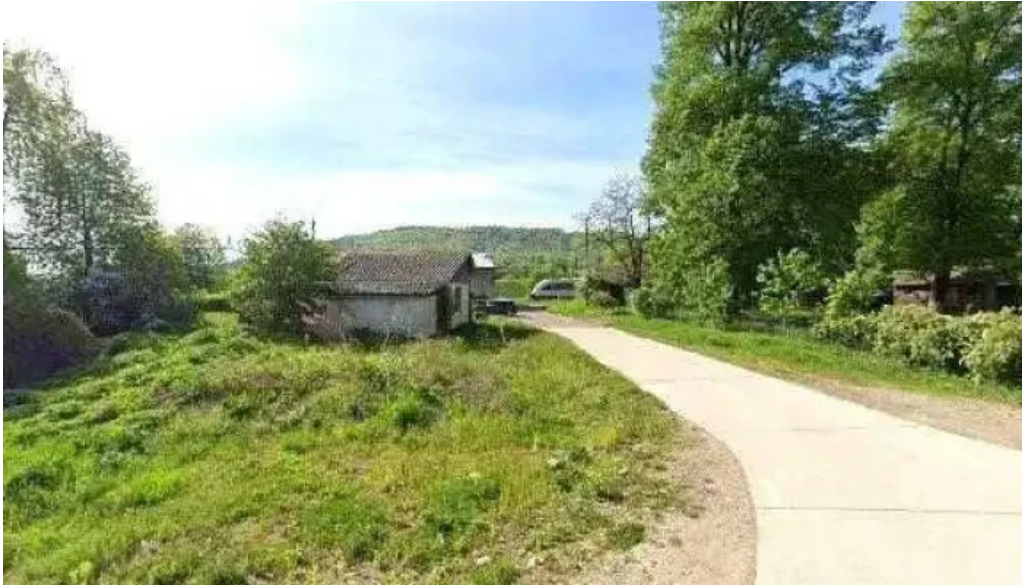
Gura putnei street view si 360deg