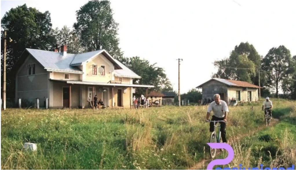
Gura putnei romania