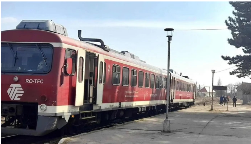
Maneciu deschis acum