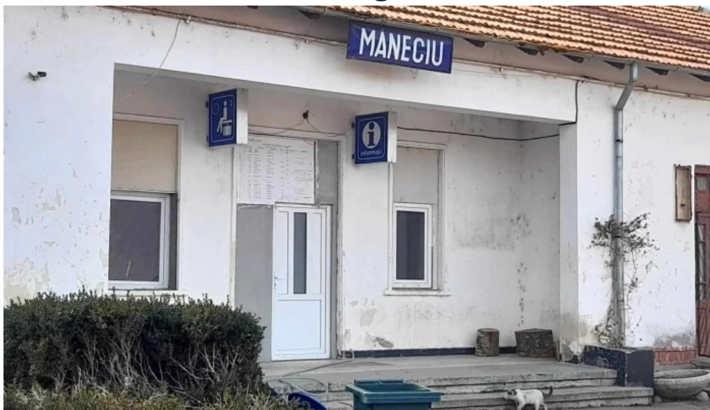
Maneciu m?neciu ungureni