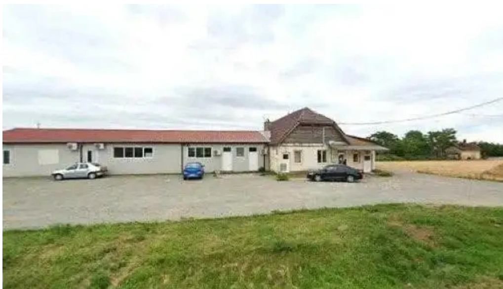
Girisu de cris zon?