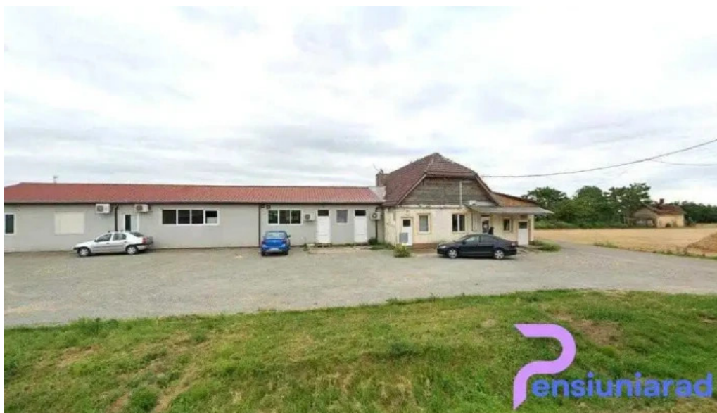
Giri?u de cri? dj797