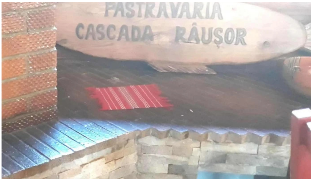
Pastravaria valea rausorului telefon