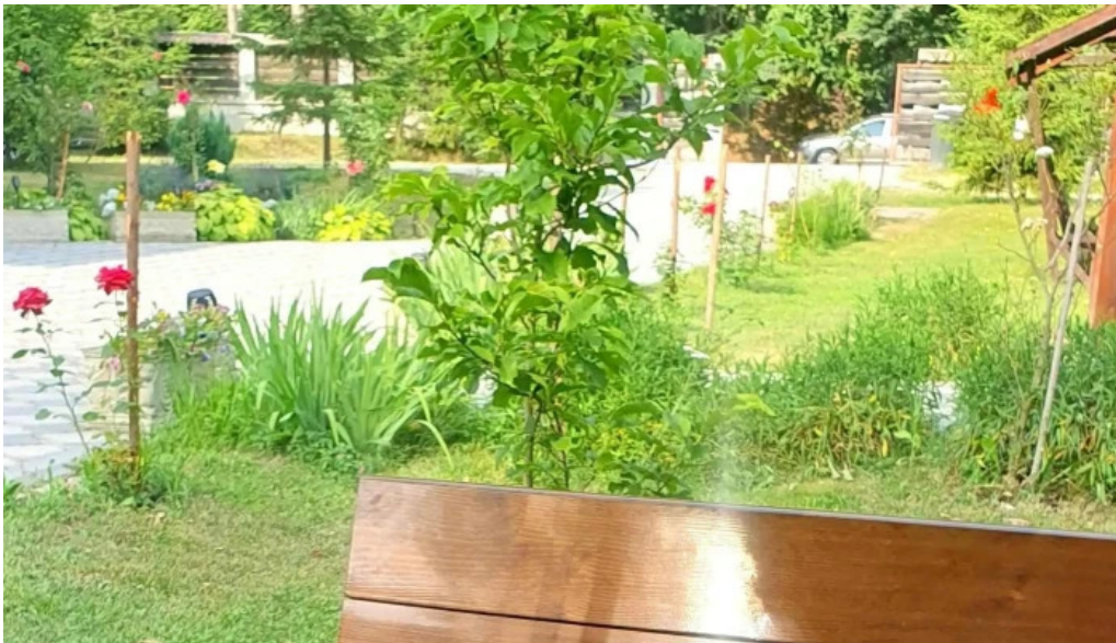
Pastravaria valea rausorului berevoe?ti