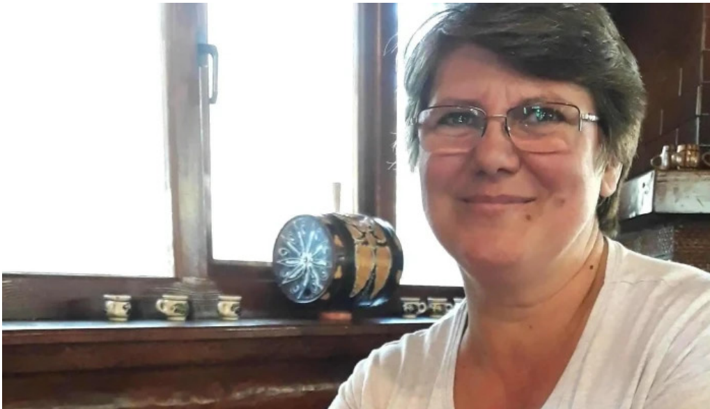
Pastravaria valea rausorului catalog