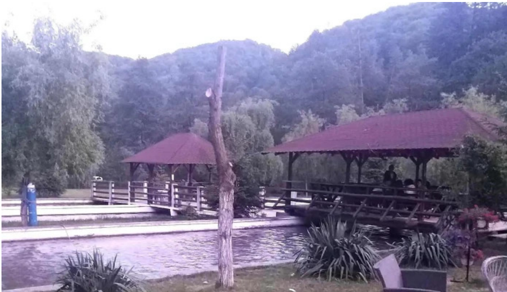
Pastravaria valea rausorului reduceri