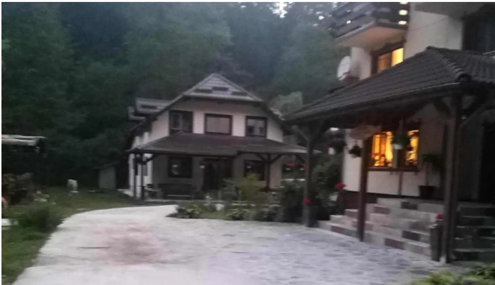
Pastravaria valea rausorului pre?uri