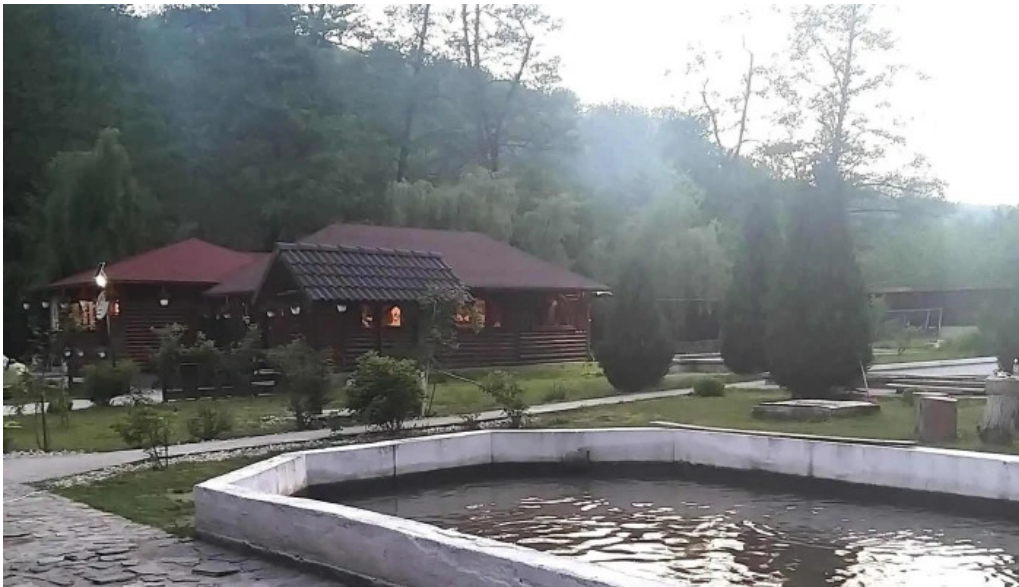
Pastravaria valea rausorului aproape de mine