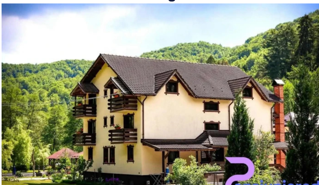
P?str?v?ria valea rau?orului berevoe?ti