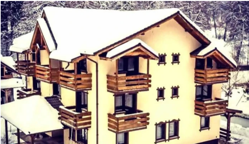
Pastravaria valea rausorului de la proprietar