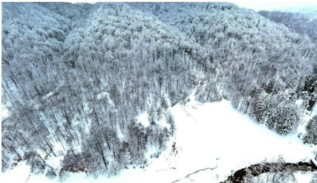
Pastravaria valea rausorului street view si 360deg