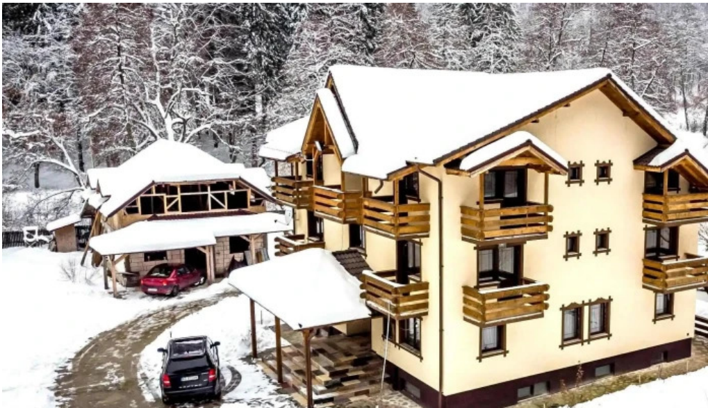
Pastravaria valea rausorului adres?