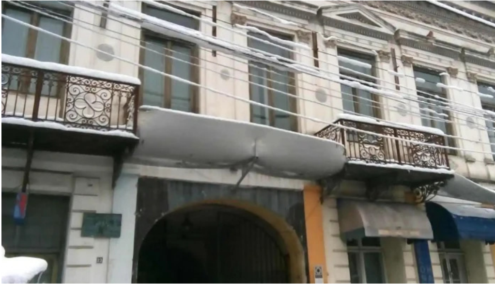
Hanul gabroveni videoclipuri