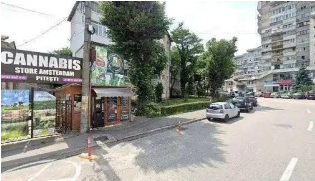
Hanul gabroveni street view si 360deg