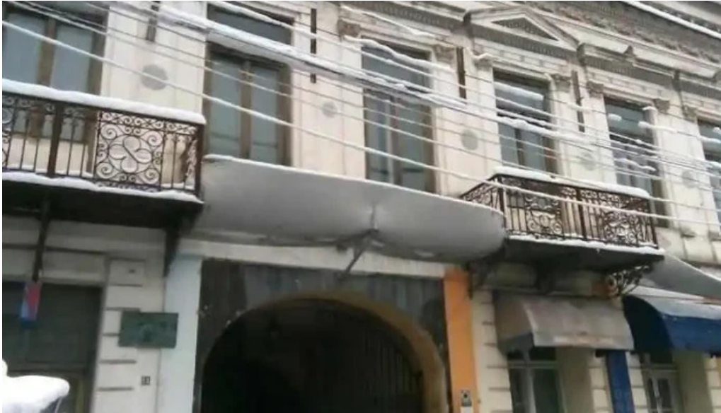
Hanul gabroveni pite?ti