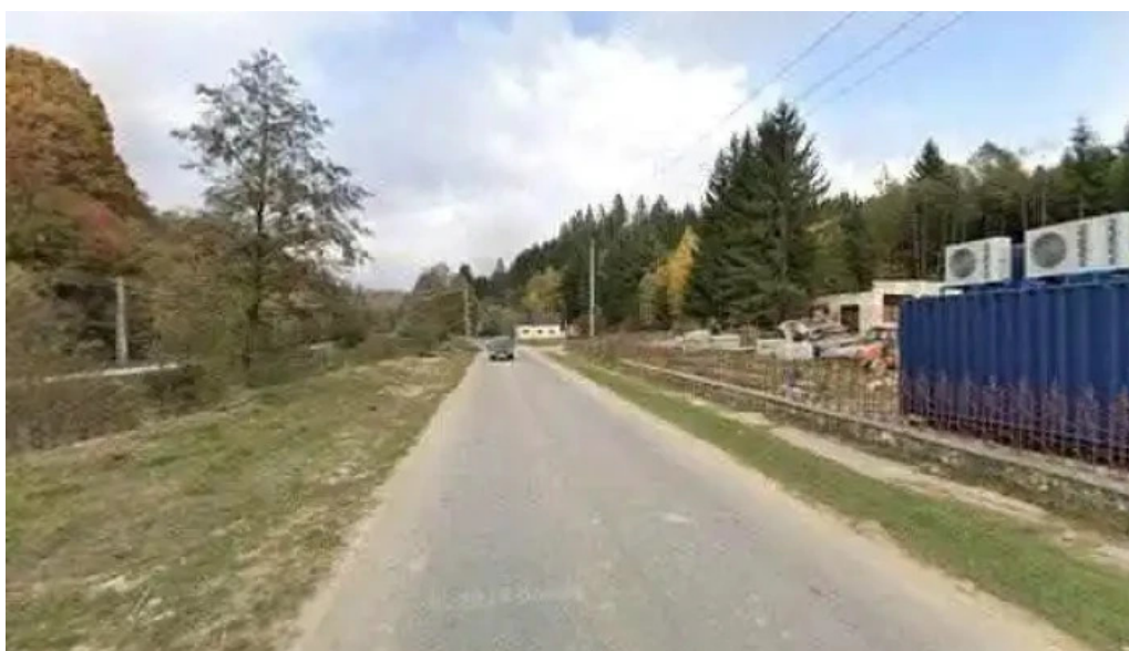
Complexul balnear magura scor