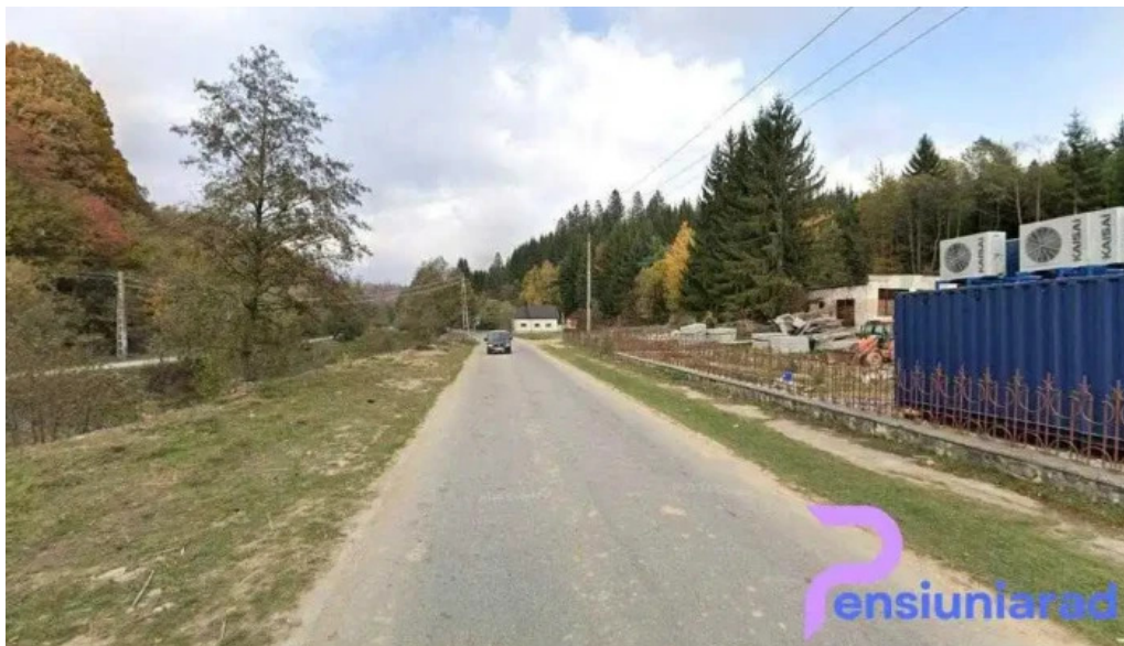
Complexul balnear m?gura bughea de sus