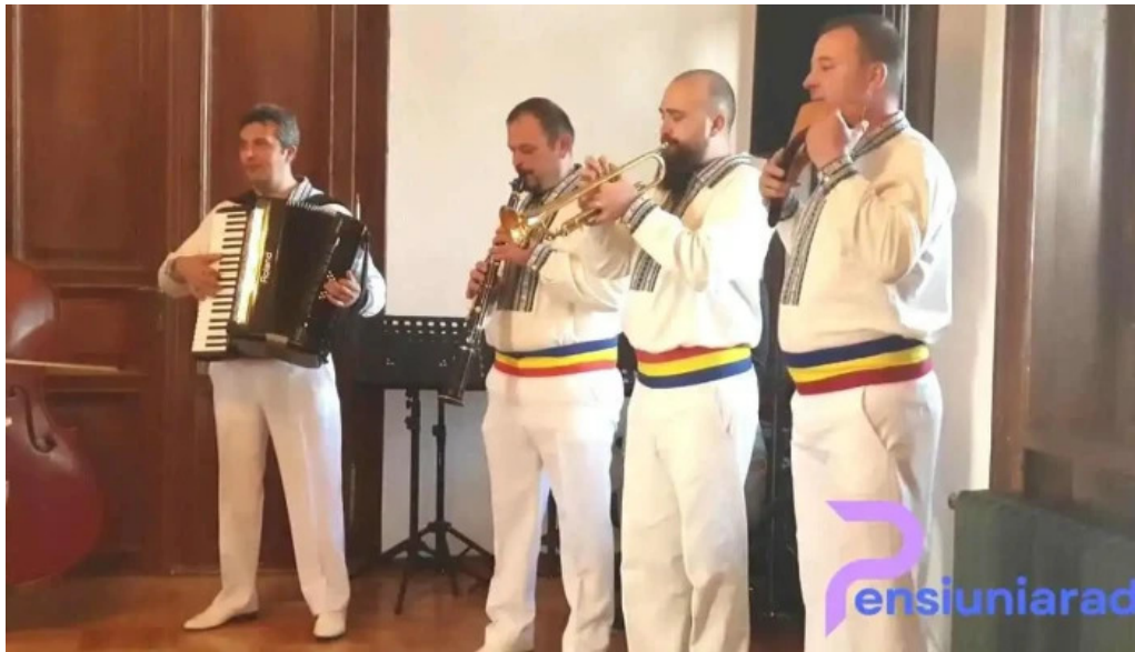
Centrul cultural castel sancrai videoclipuri