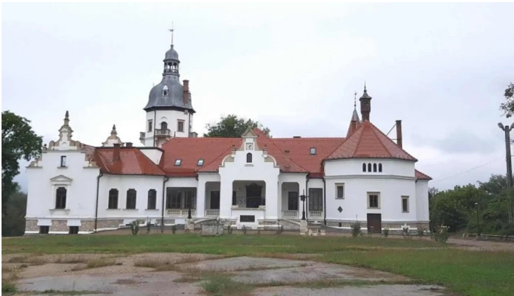
Centrul cultural castel sancti deschis acum