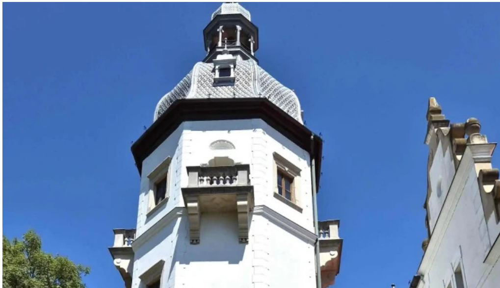
Centrul cultural castel sancrai scor