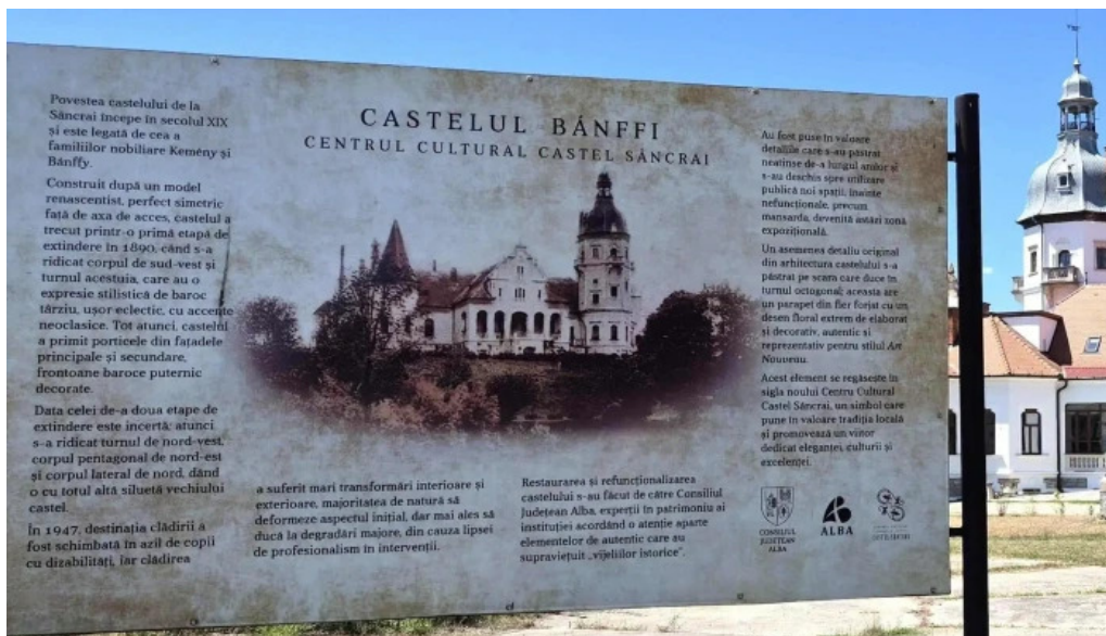
Centrul cultural castel sancrai sancrai