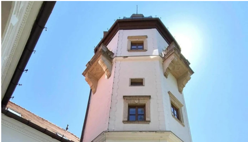
Centrul cultural castel sancrai telefon