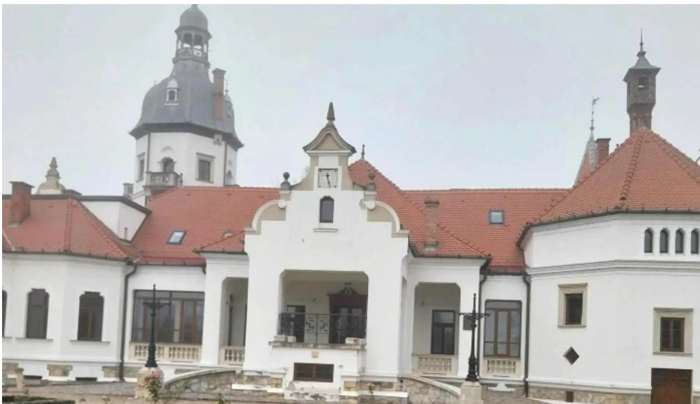
Centrul cultural castel sancrai catalog