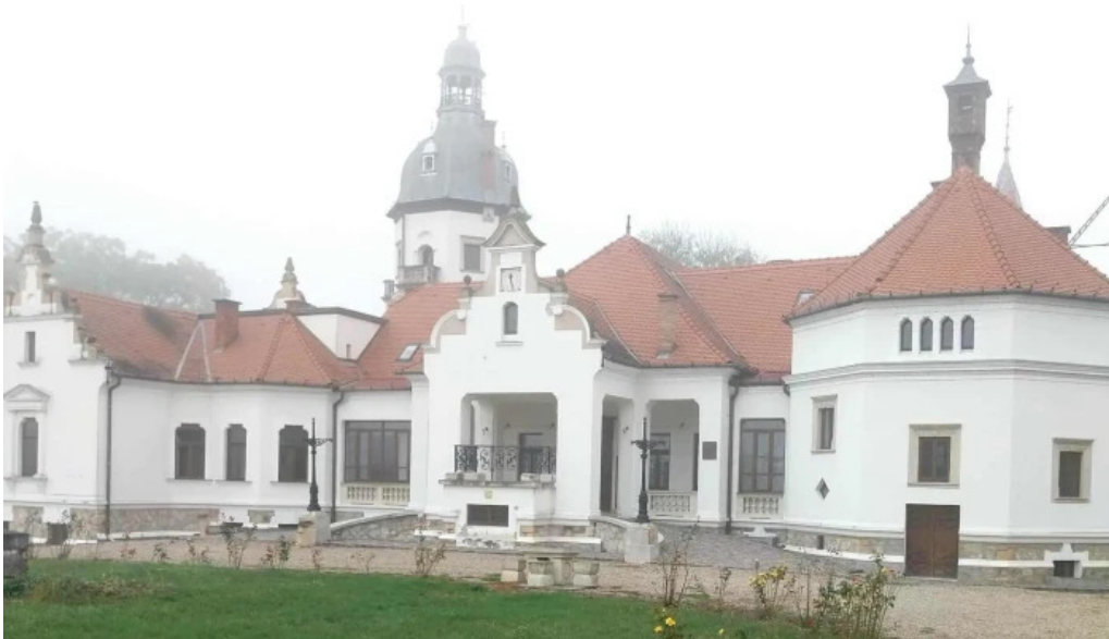
Centrul cultural castel sancrai cum s? ajungi acolo