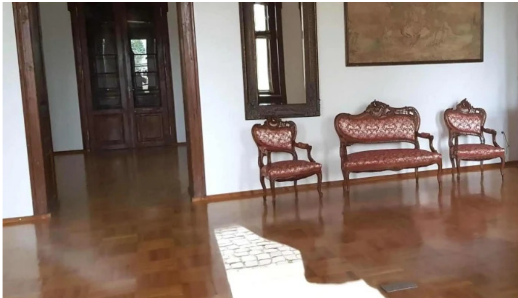
Centrul cultural castel sancrai num?r