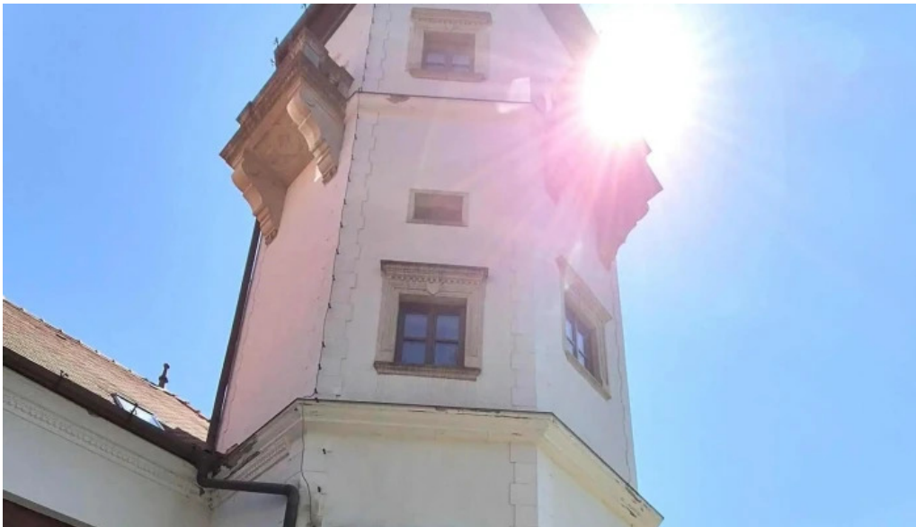
Centrul cultural castel sancrai site web