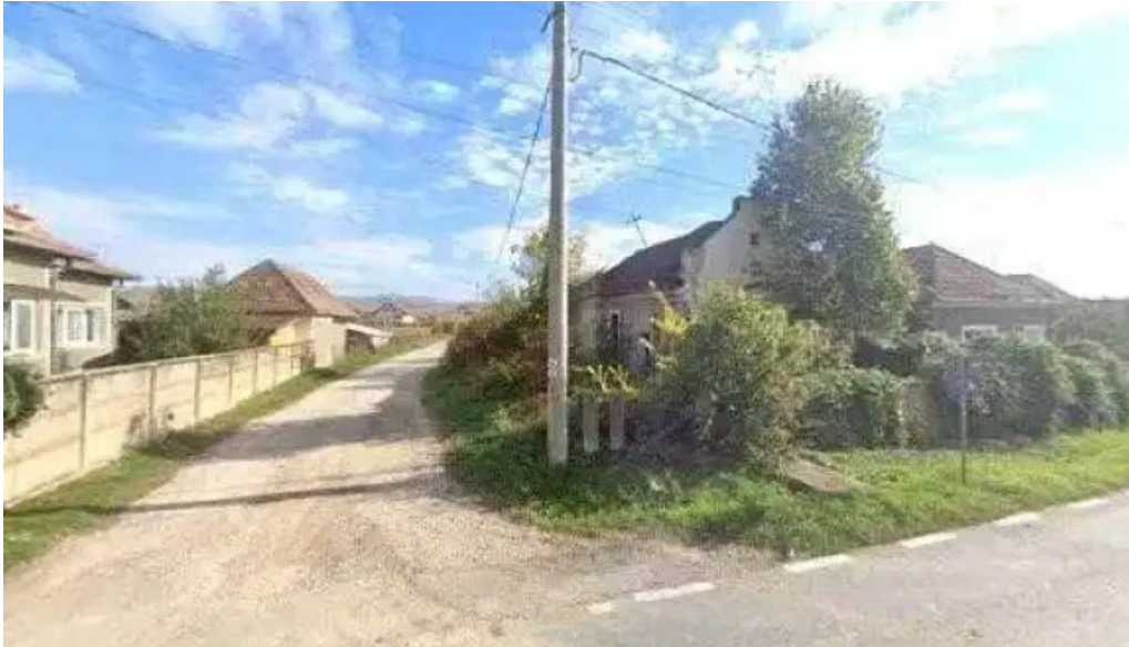
Centrul cultural castel sancrai street view si 360deg