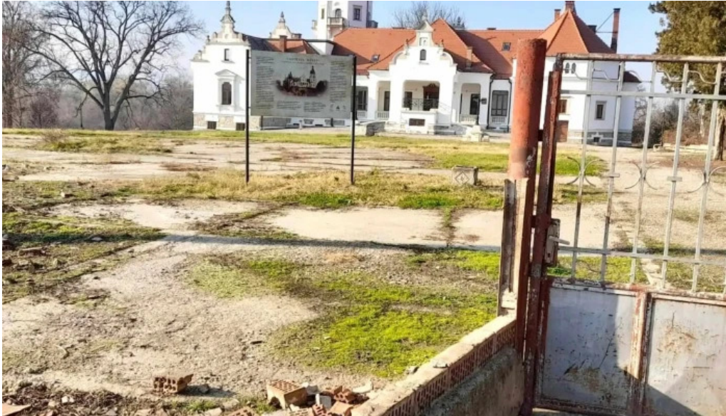
Centrul cultural castel sancrai adres?