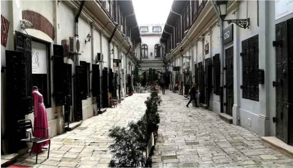
Hanul cu tei cele mai recente