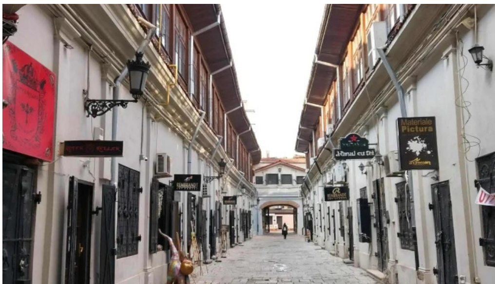
Hanul cu tei bucure?ti