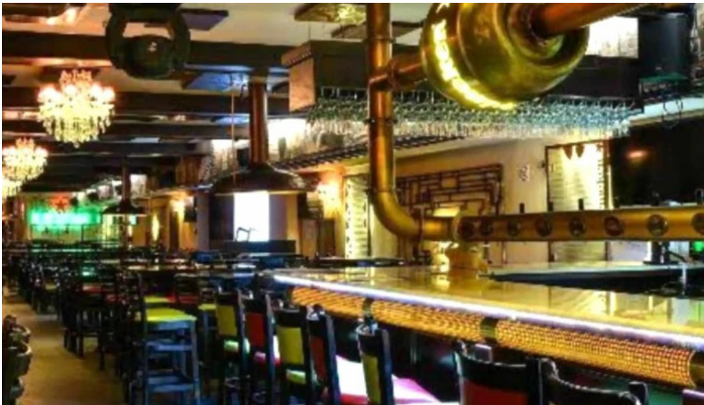
Hanul cu tei loca?ie