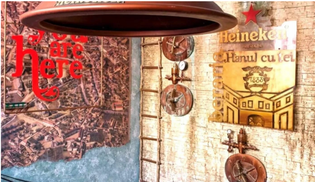
Hanul cu tei catalog