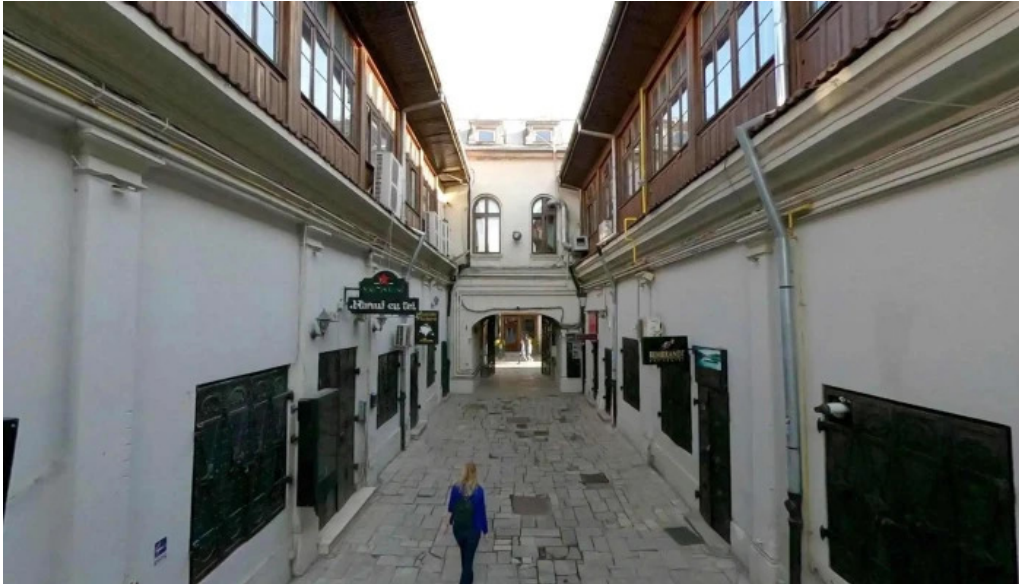
Hanul cu tei street view si 360deg