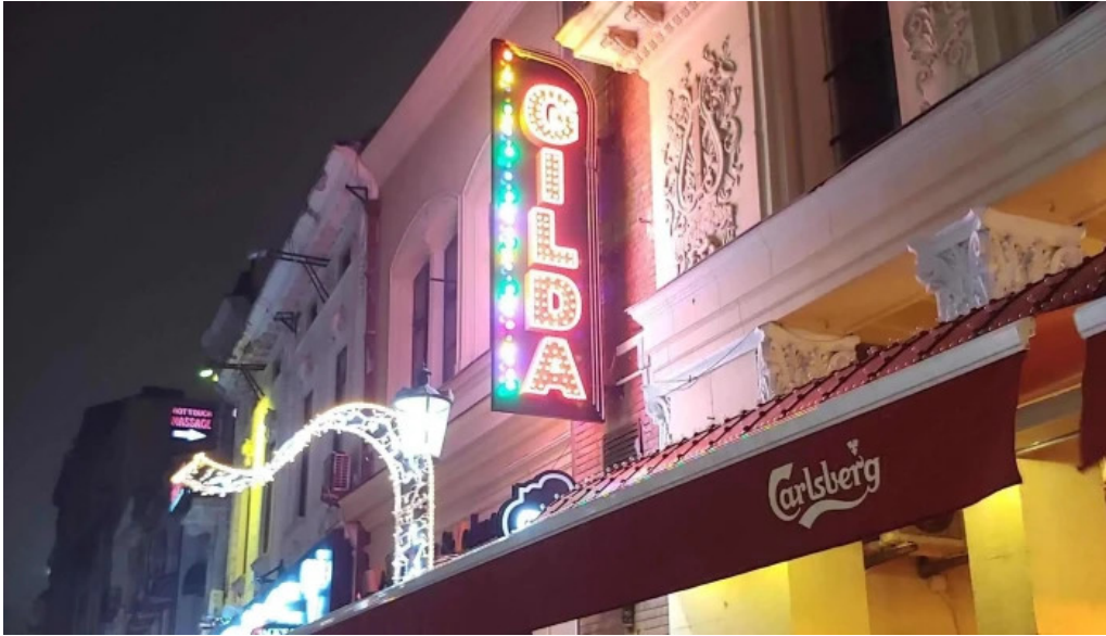
Hanul cu tei promo?ie