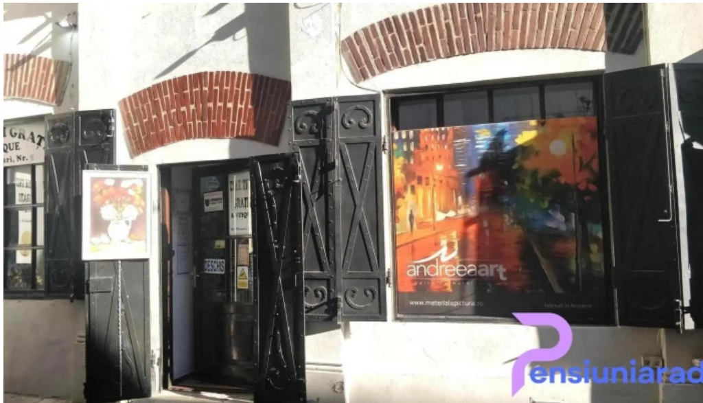
Hanul cu tei interior