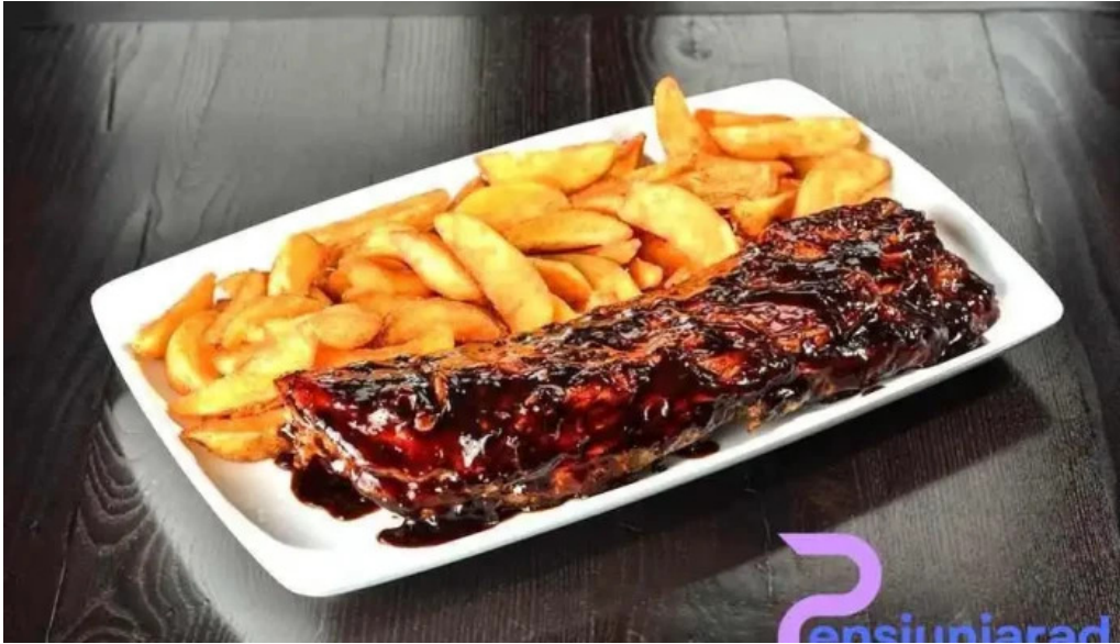
Hanul cu tei mancare