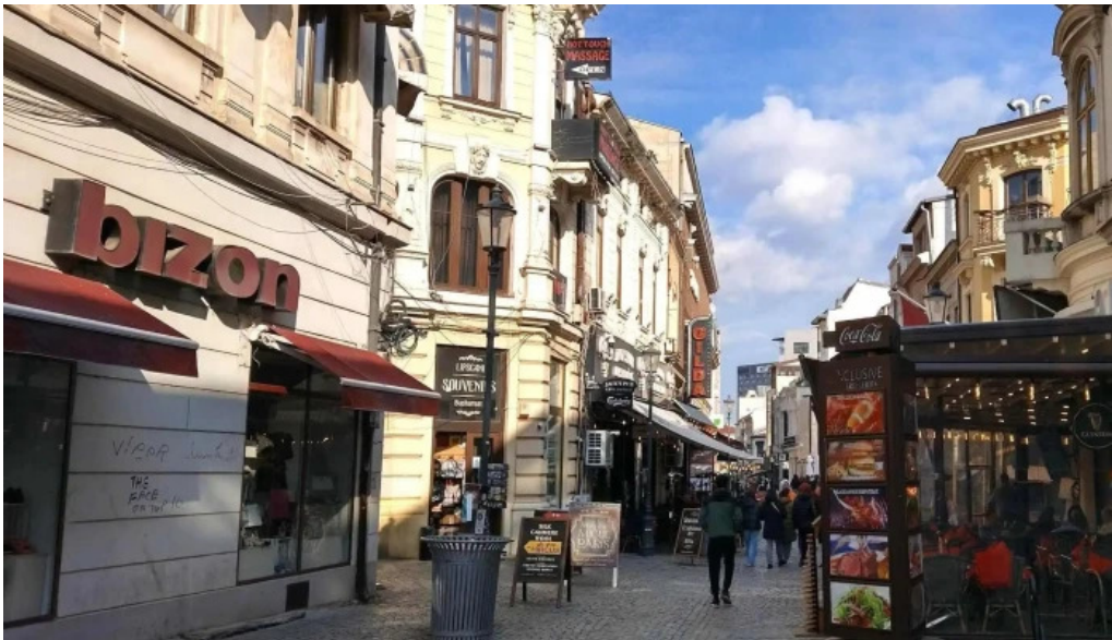
Hanul cu tei pre?uri