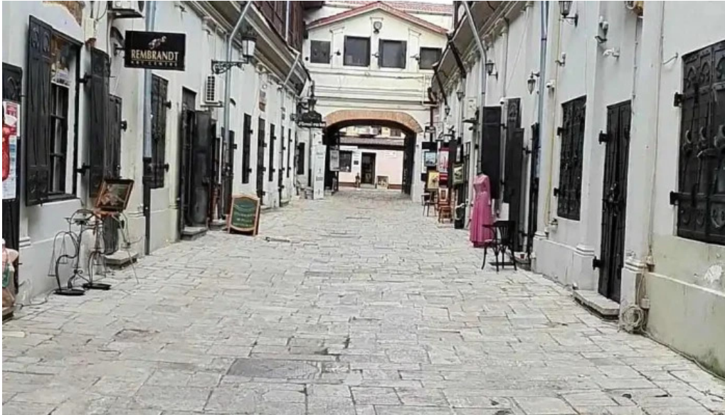
Hanul cu tei videoclipuri