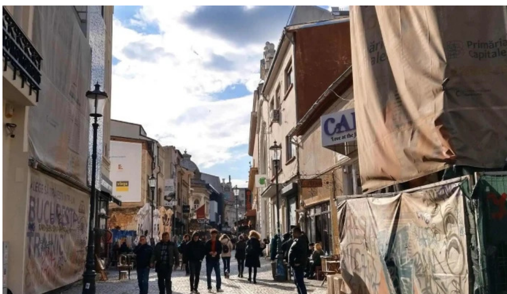
Hanul cu tei adres?