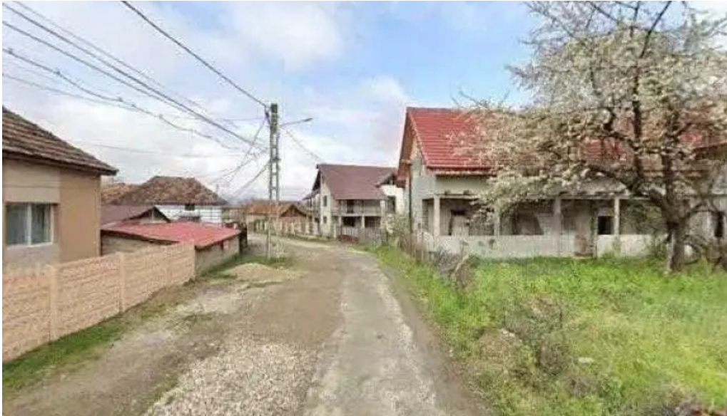
Casa lidia street view si 360deg