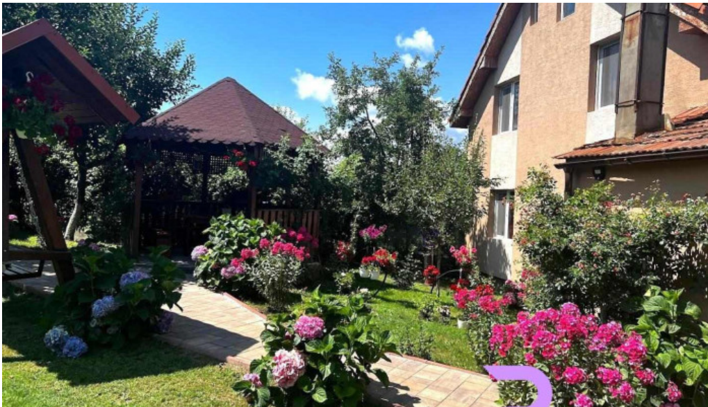
Casa lidia rau de mori