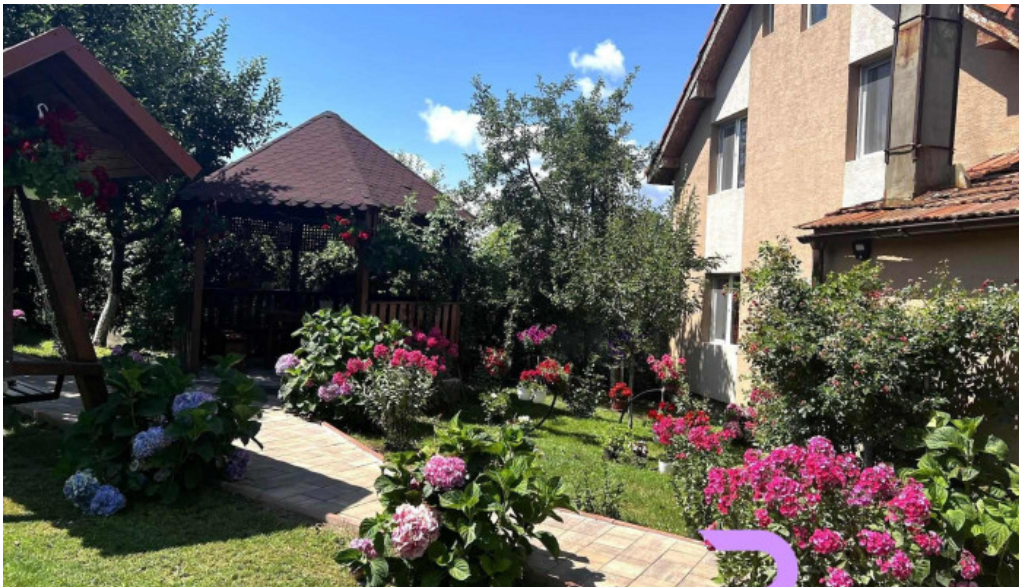
Casa lidia deschis acum