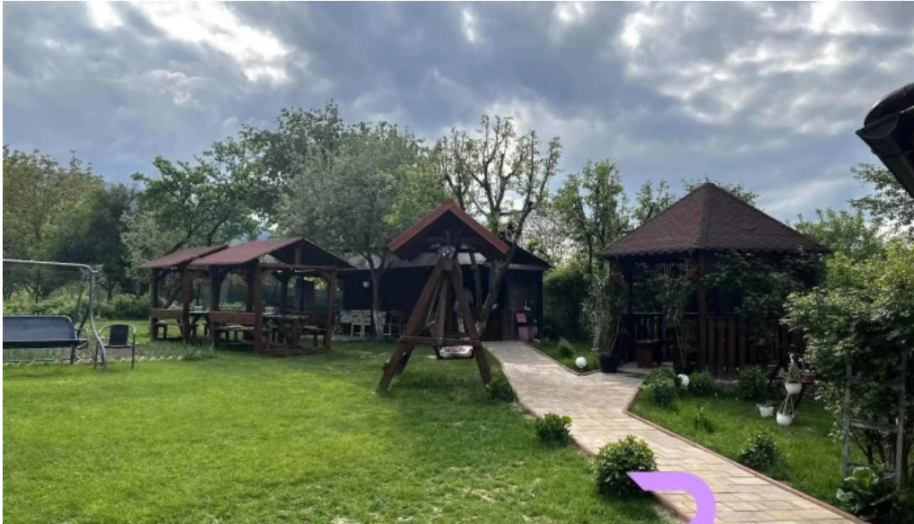
Casa lidia exterior