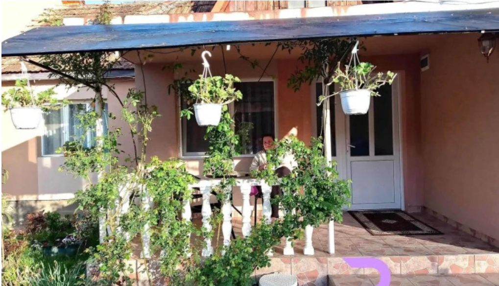
Casa lidia de la vizitatori