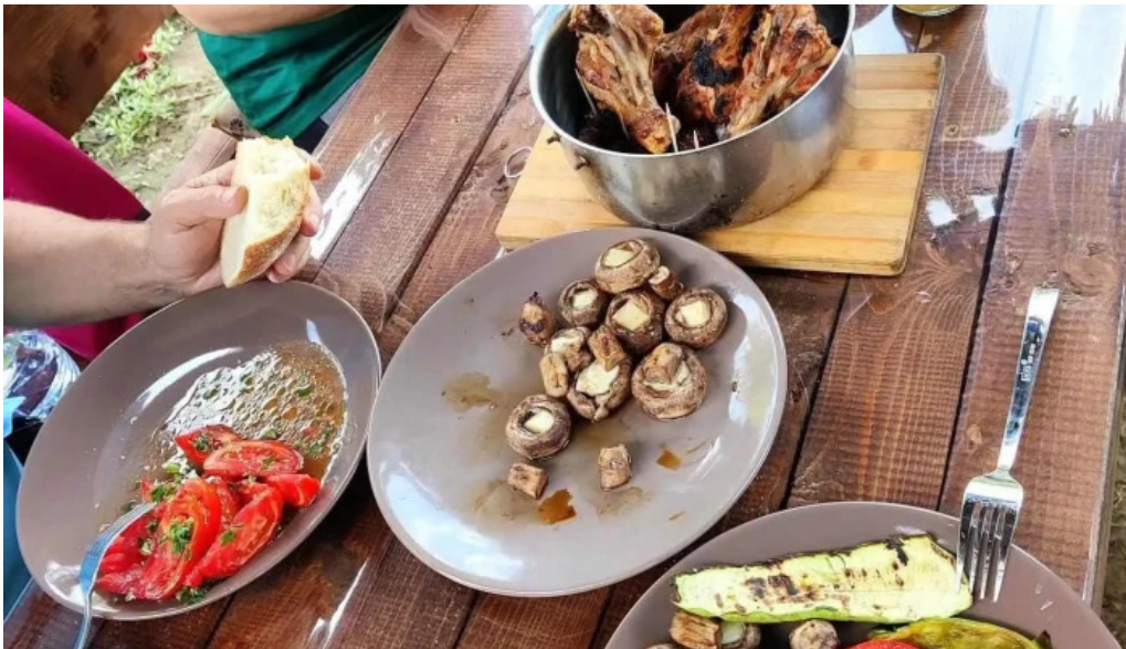
Casa lidia mancaruribauturi