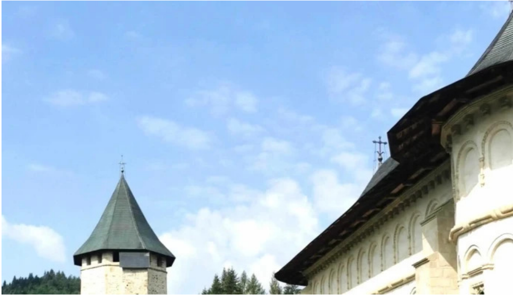
Hotelul manastirii putna arhondaricul visarion puiu putna