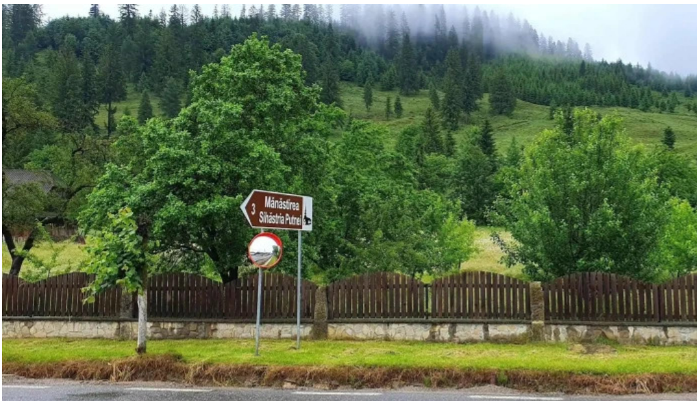
Hotelul manastirii putna arhondaricul visarion puiu aproape de mine