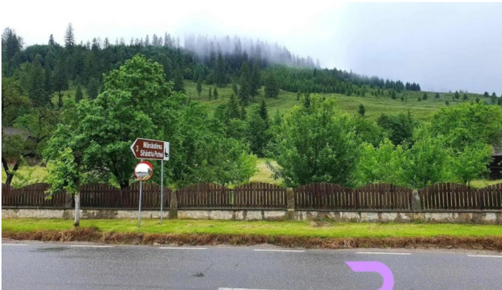
Hotelul manastirii putna arhondaricul visarion puiu de la vizitatori