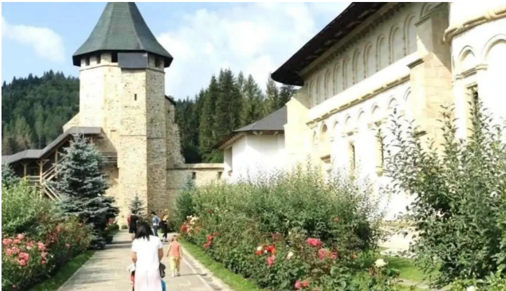
Hotelul manastirii putna arhondaricul visarion puiu exterior