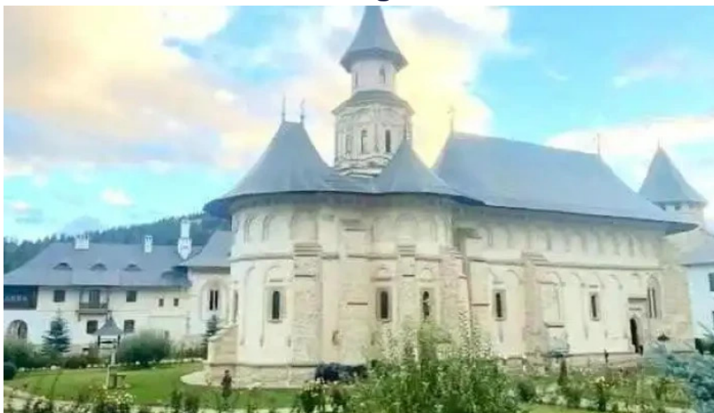
Hotelul m?n?stirii putna arhondaricul visarion puiu putna