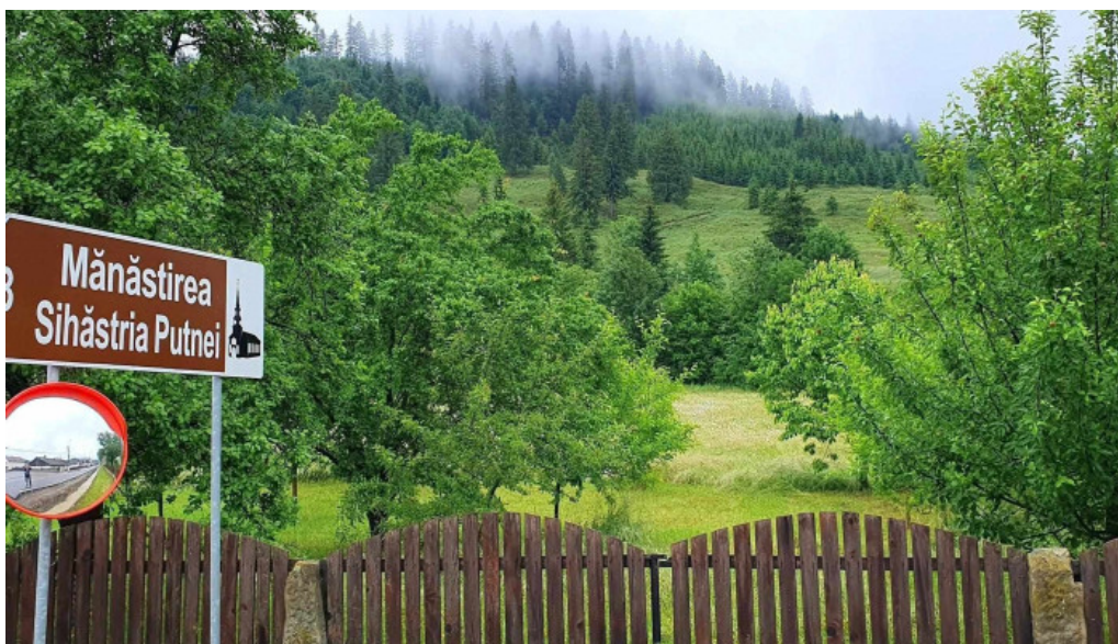
Hotelul manastirii putna arhondaricul visarion puiu telefon