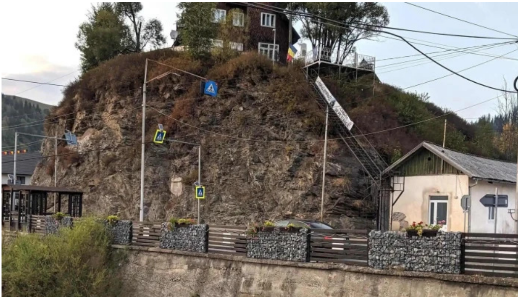
Cazare carlibaba unde