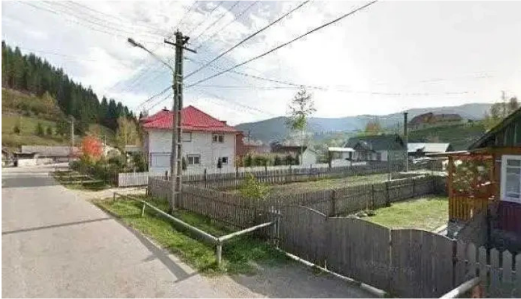
Cazare carlibaba street view si 360deg