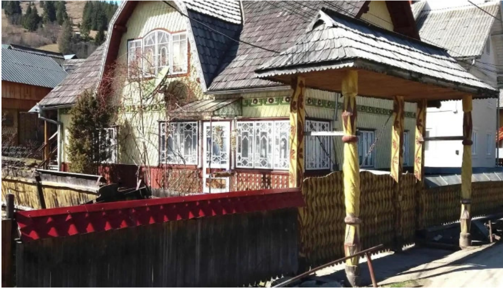
Cazare carlibaba reduceri