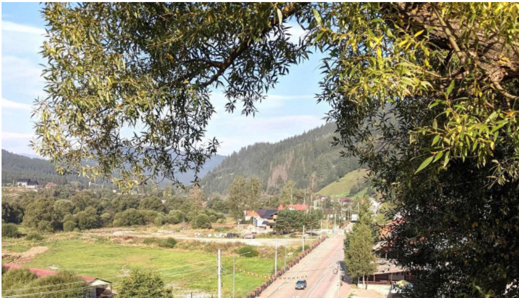
Cazare carlibaba instagram