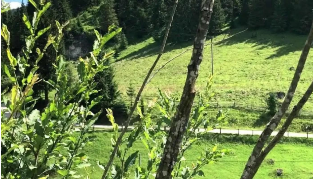
Cazare carlibaba de la vizitatori