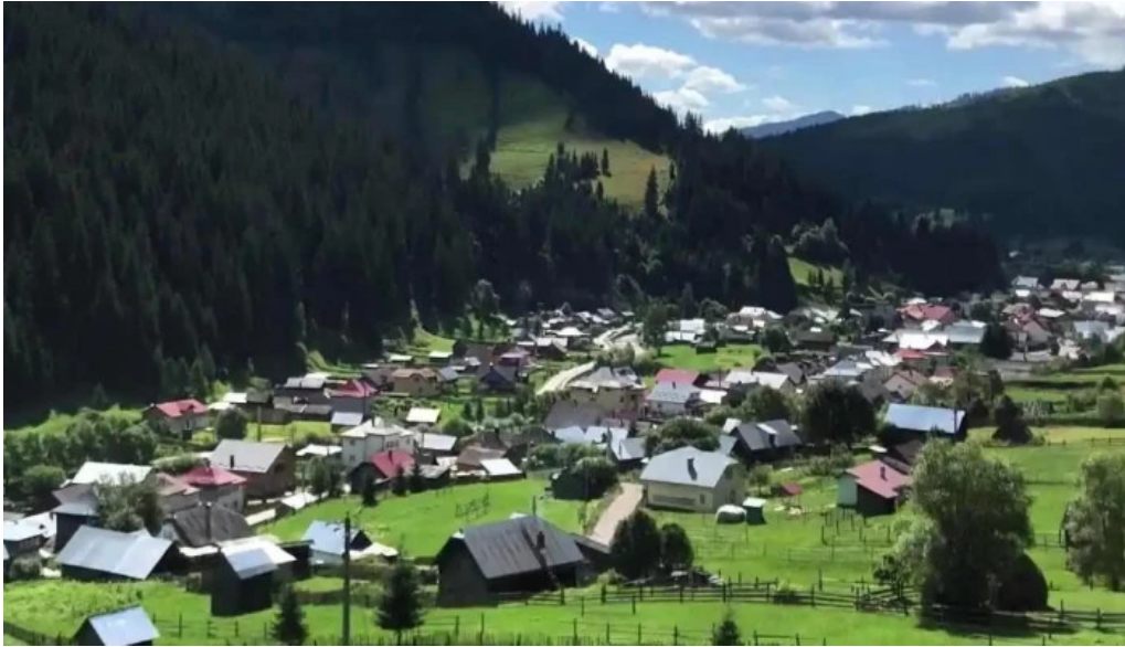
Cazare carlibaba videoclipuri