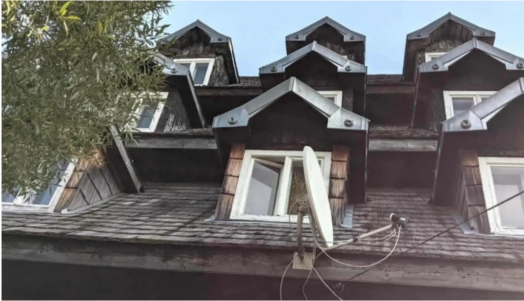
Cazare carlibaba pre?uri