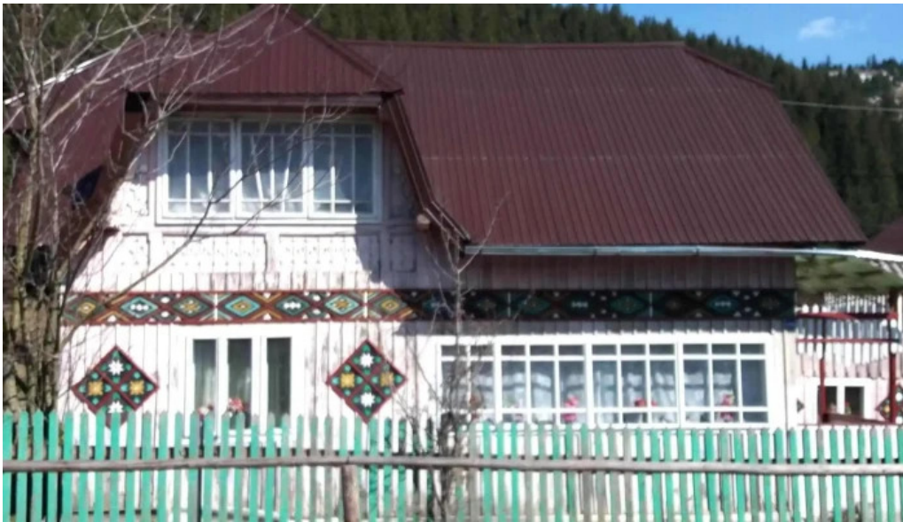
Cazare carlibaba scor