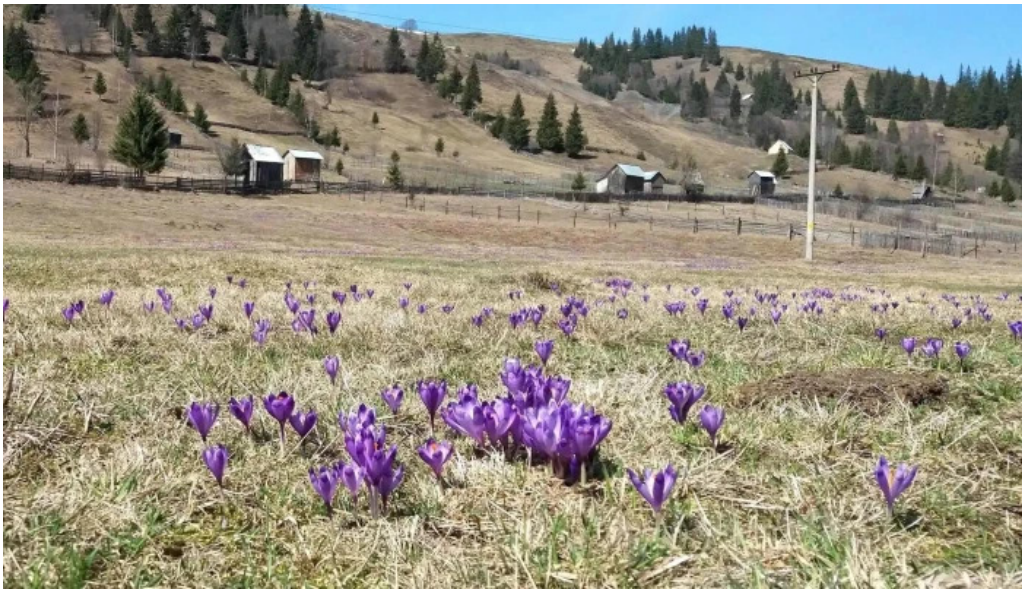
Cazare carlibaba program