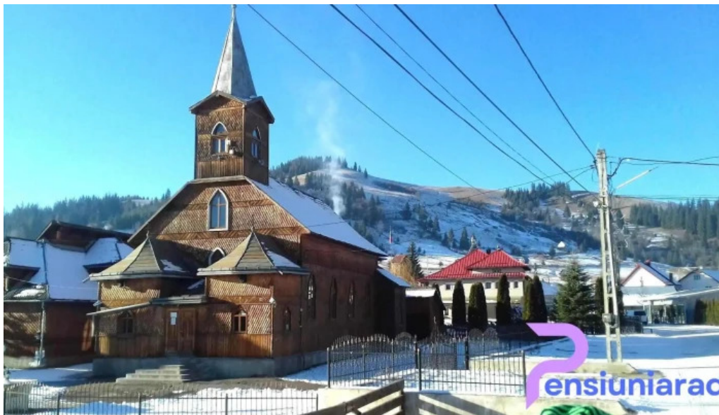
Cazare carlibaba exterior