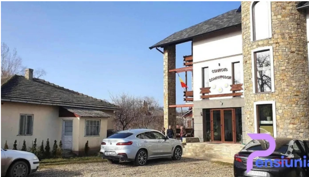
Conacul domni?elor adancata