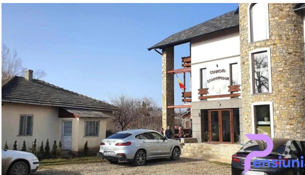
Conacul domnitelor catalog