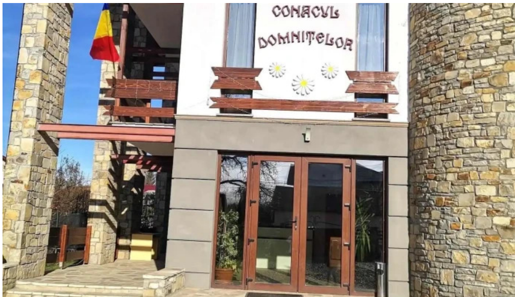
Conacul domnitelor de la vizitatori