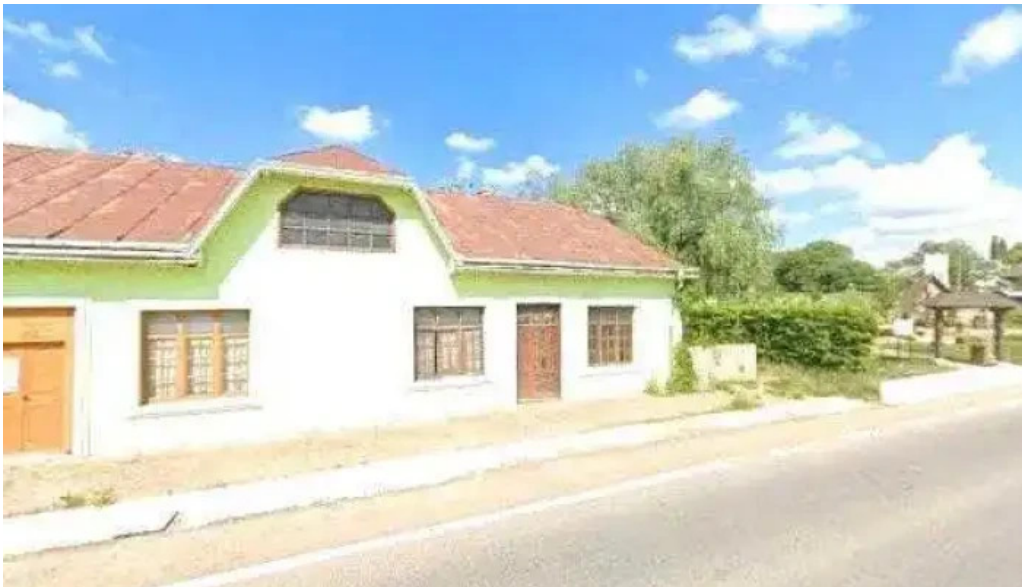
Conacul domnitelor street view si 360deg