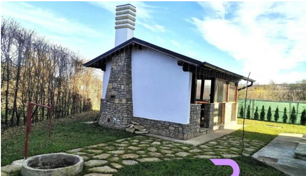
Conacul domnitelor exterior