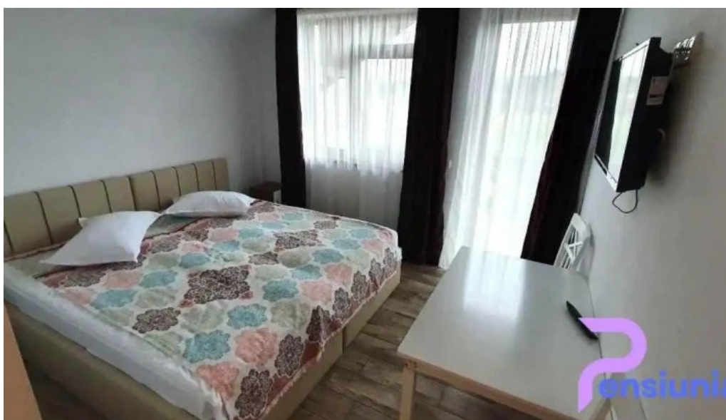
Conacul domnitelor camere