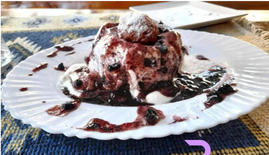
Hanul izvorul rece mancaruribauturi