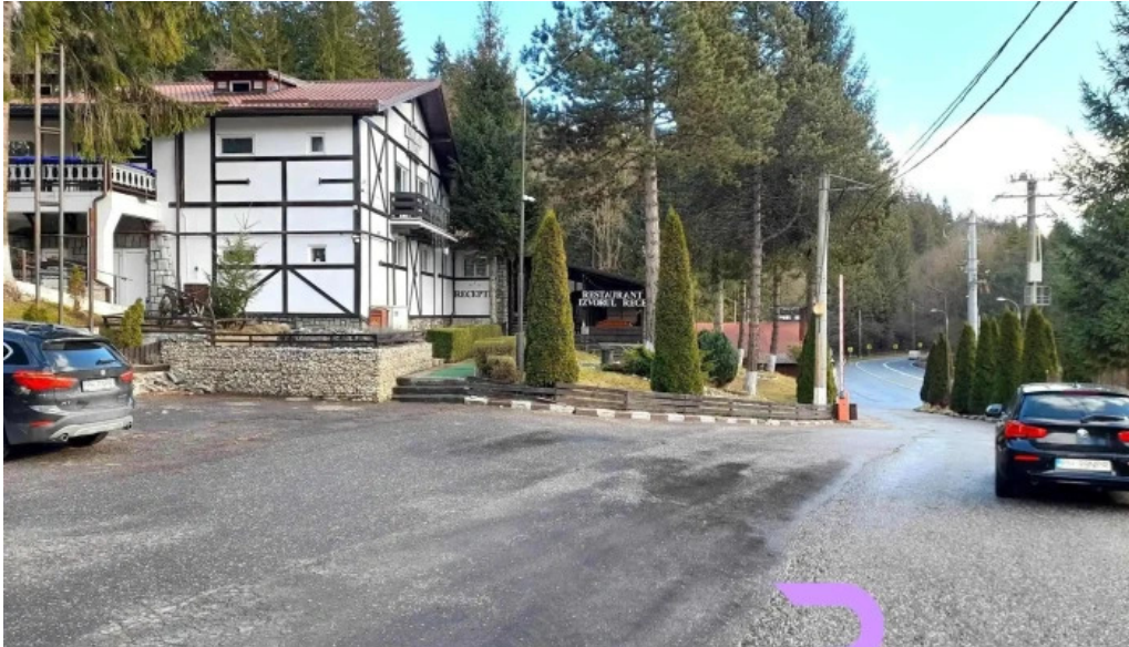
Hanul izvorul rece de la vizitatori