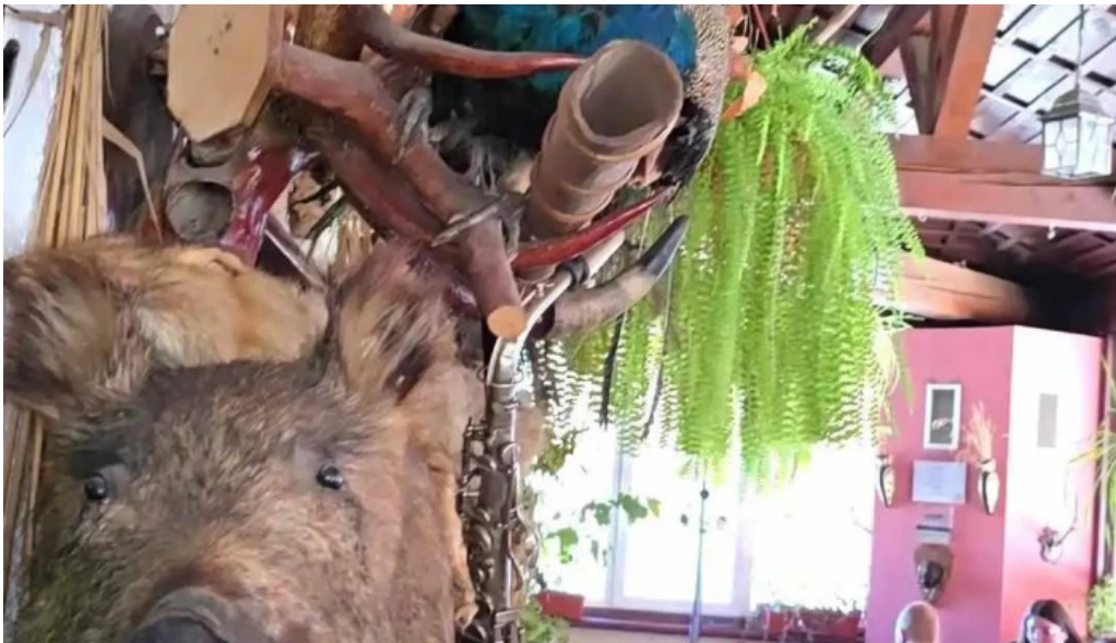
Hanul izvorul rece cele mai recente