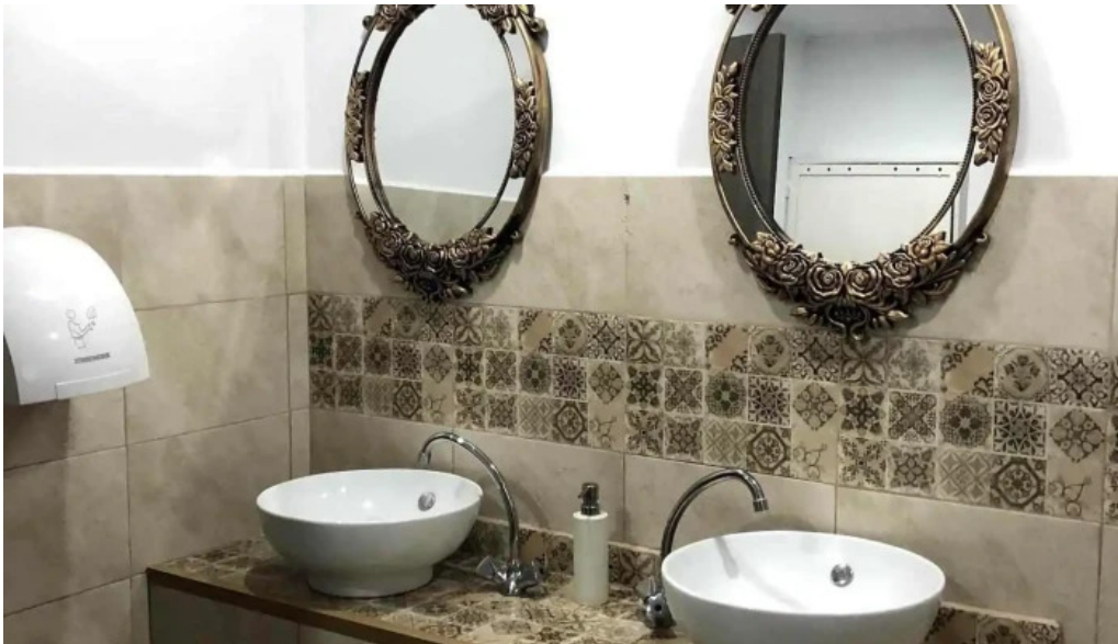
Hanul izvorul rece de la proprietar