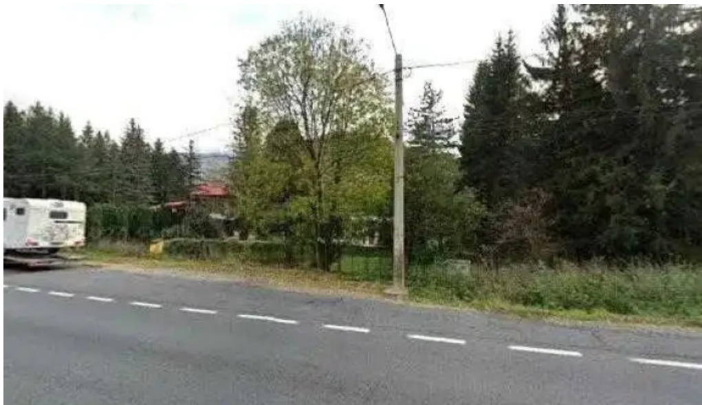
Hanul izvorul rece street view si 360deg