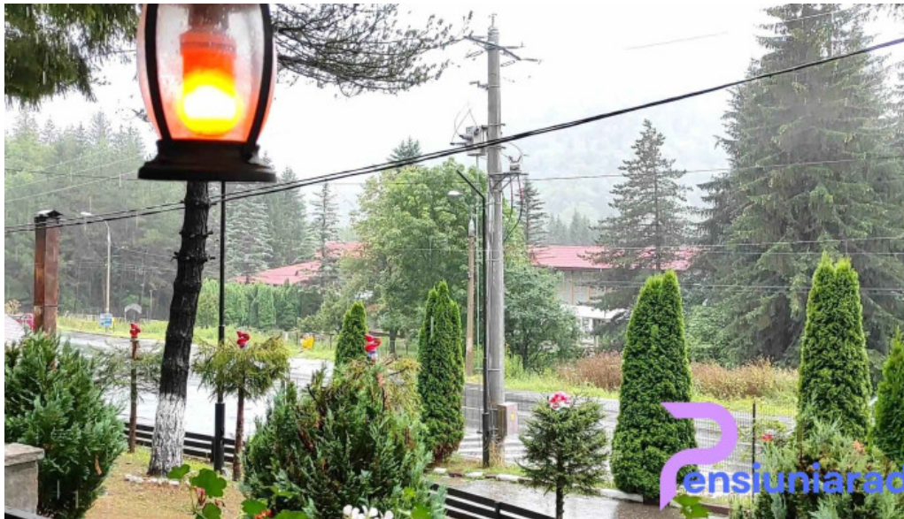
Hanul izvorul rece videoclipuri