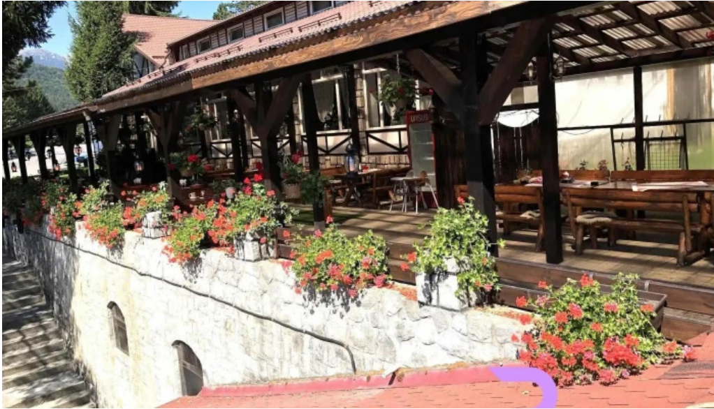
Hanul izvorul rece comentarii