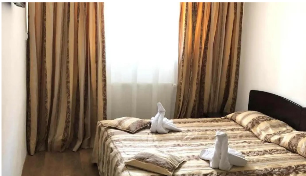
Hanul izvorul rece camere