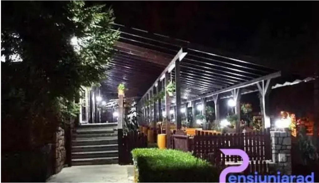
Hanul izvorul rece sinaia