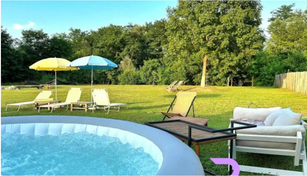
Orastioara retreat dotari