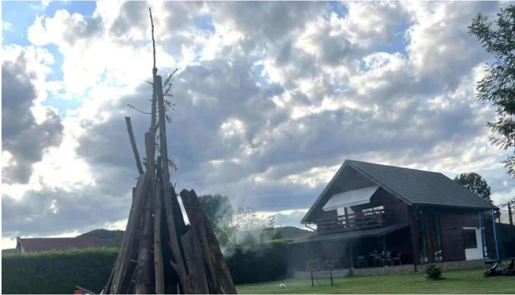
Orastioara retreat cum s? ajungi acolo