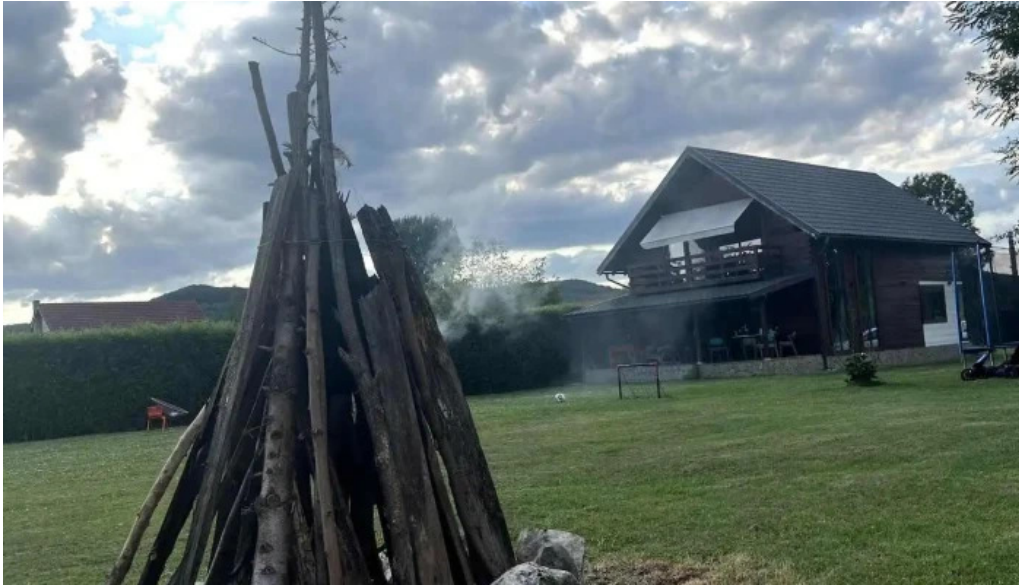
Orastioara retreat de la vizitatori