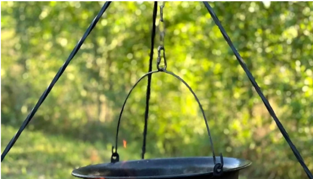
Orastioara retreat recenzii