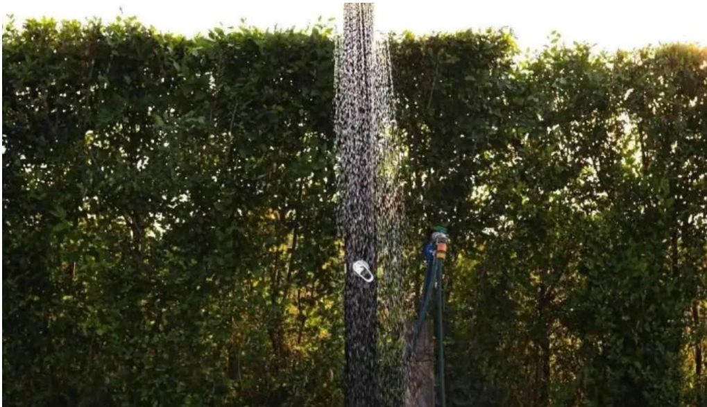
Orastioara retreat exterior