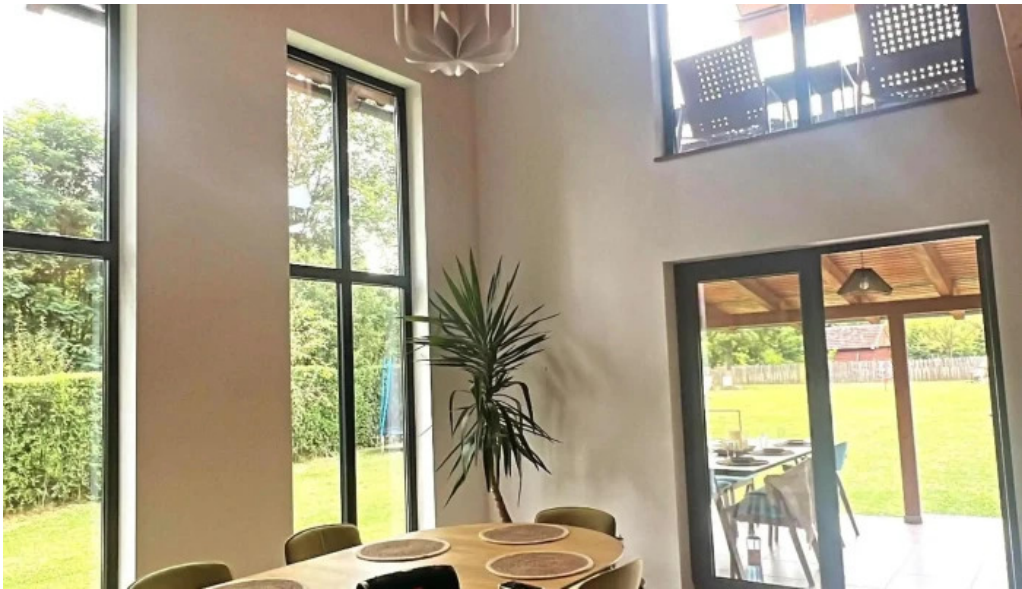
Orastioara retreat deschis acum