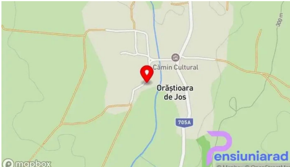
Orastioara retreat hart?