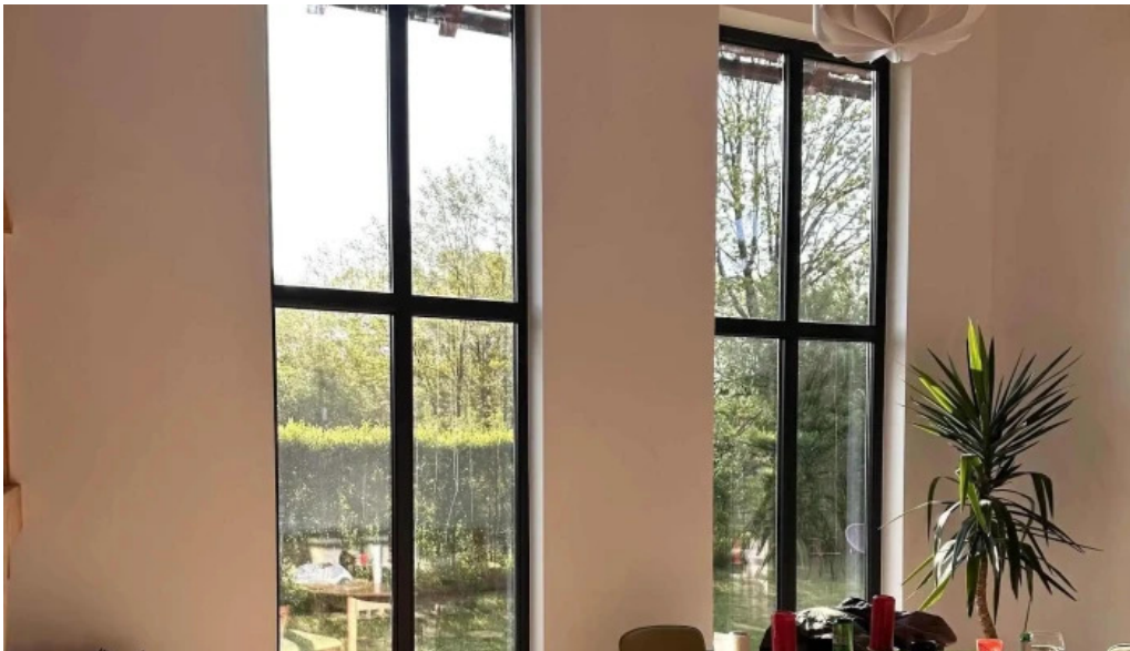
Orastioara retreat orastioara de jos