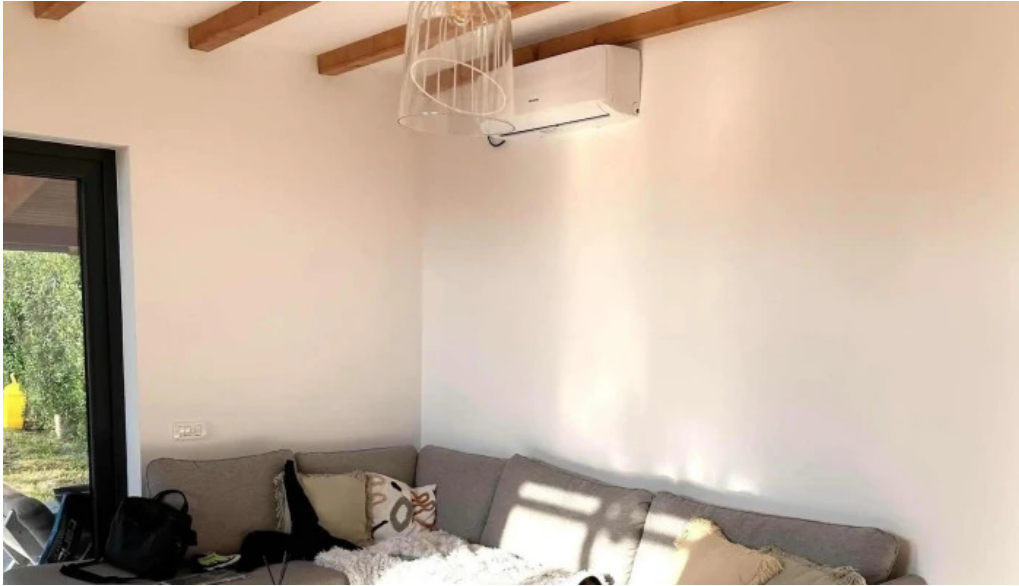
Orastioara retreat program