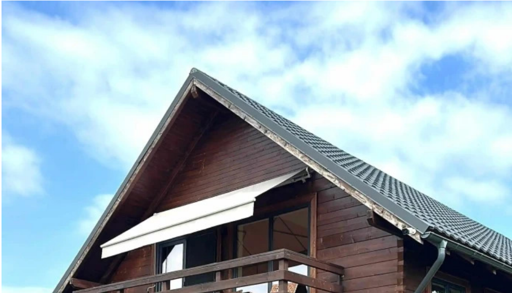
Orastioara retreat unde