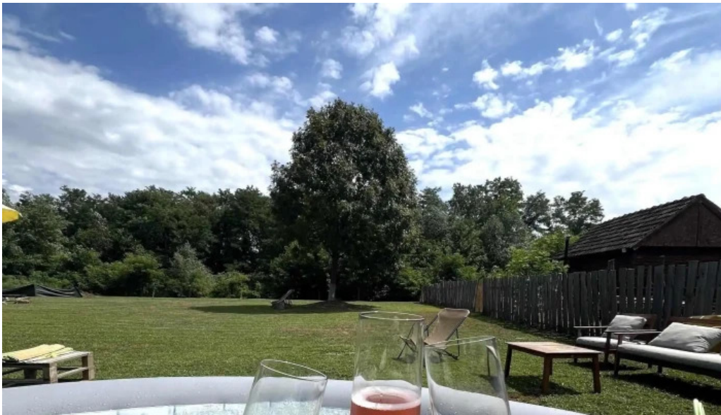
Orastioara retreat catalog