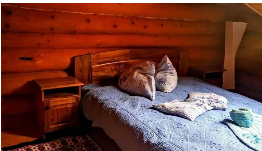
Piatra runcului camere