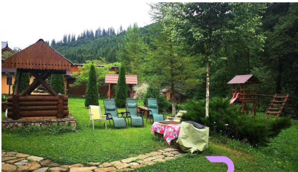
Piatra runcului de la vizitatori