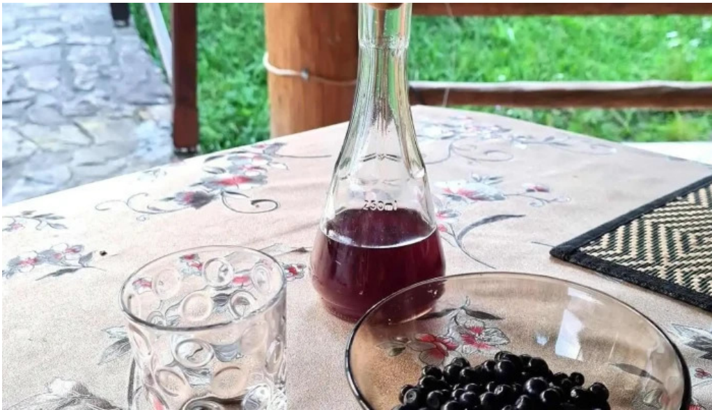
Piatra runcului mancaruribauturi