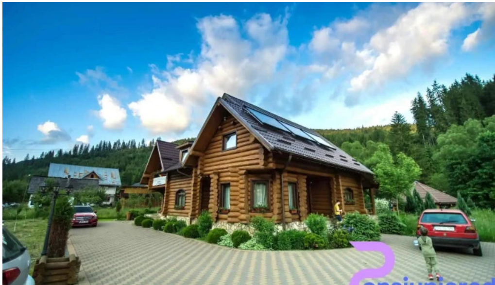
Piatra runcului exterior