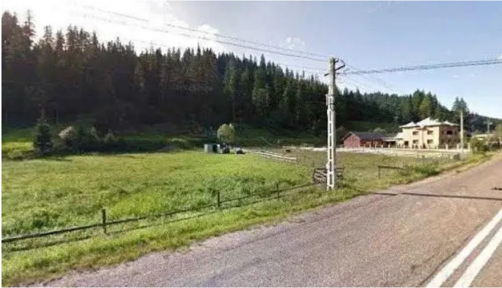
Piatra runcului street view si 360deg