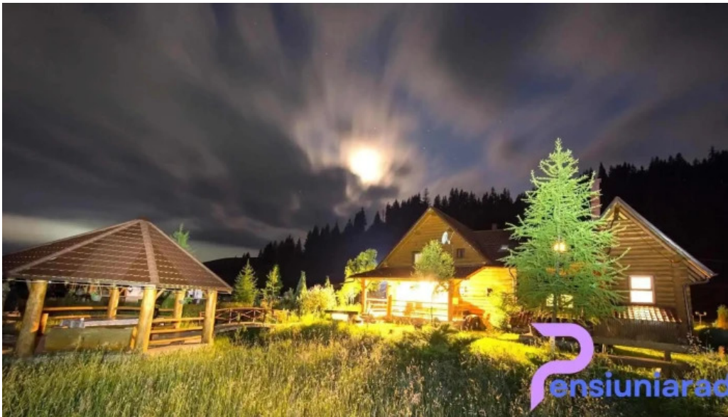
Piatra runcului vatra moldovi?ei