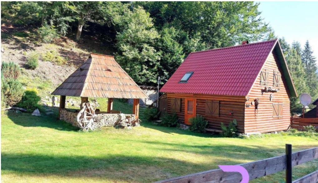
Cabana varciorog arieseni exterior