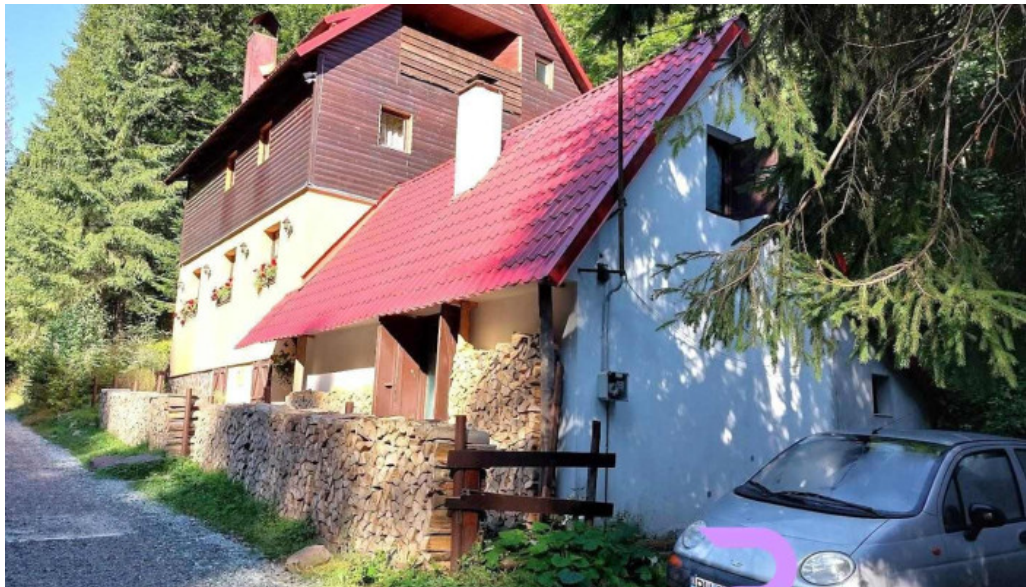
Cabana varciorog arieseni vanvuce?ti