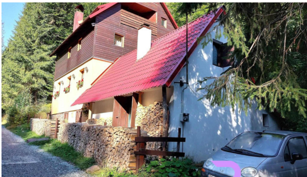
Cabana varciorog arieseni cum s? ajungi acolo