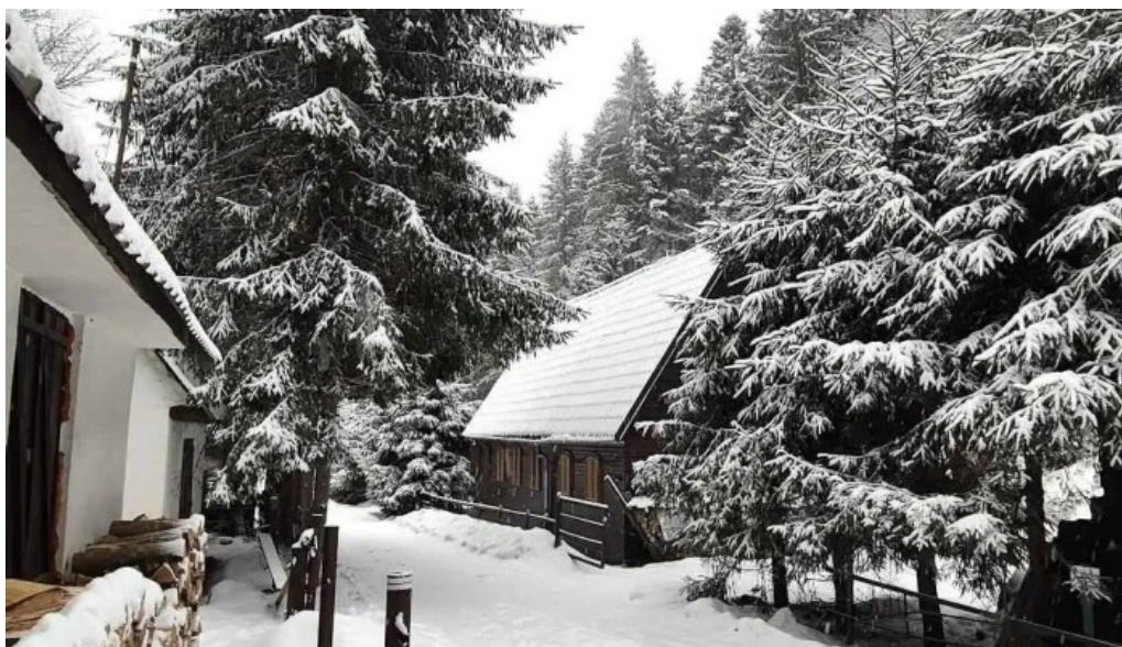
Cabana varciorog arieseni cabana