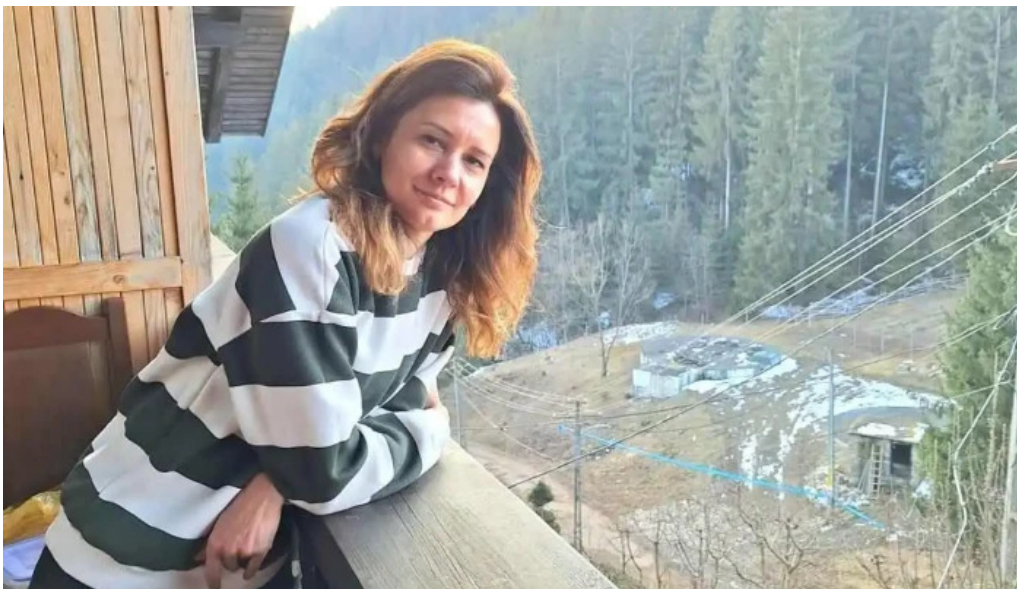
Ionela cele mai recente