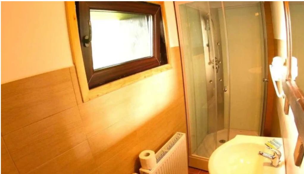
Ionela de la proprietar