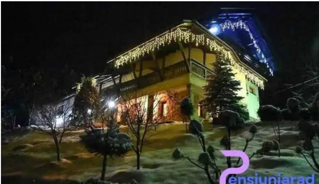
Ionela cum s? ajungi acolo