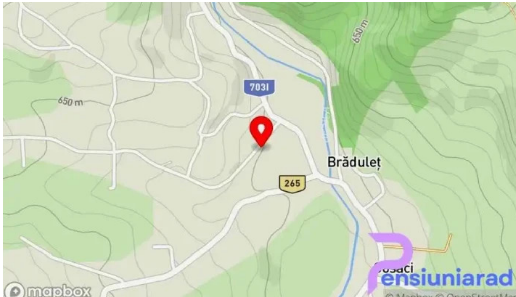
Bradulet arges hart?