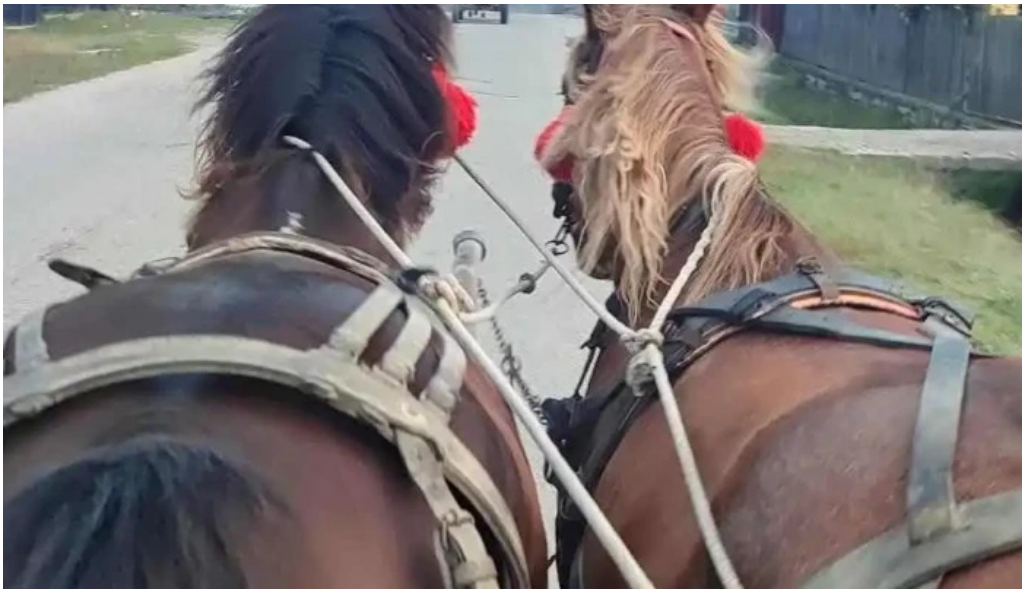
Bradulet arges de la proprietar