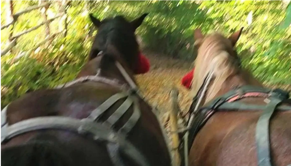
Bradulet arges videoclipuri