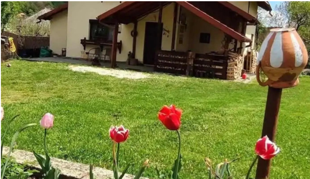
Bradulet arges exterior