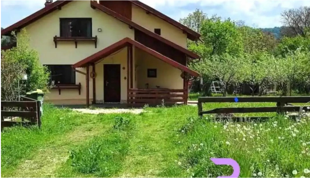
Bradulet arges de la vizitatori