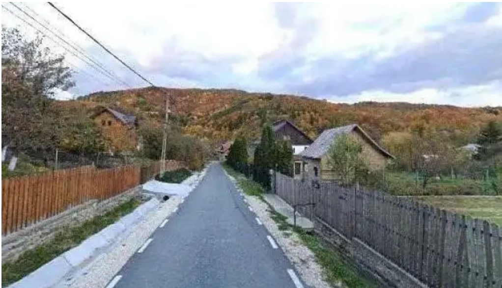
Bradulet arges street view si 360deg