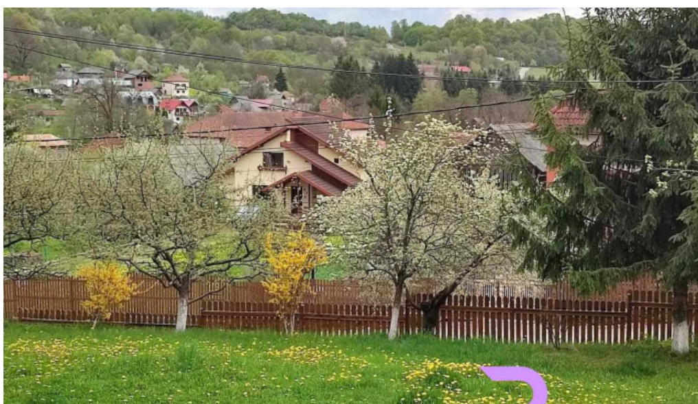
Bradulet arges br?dule?