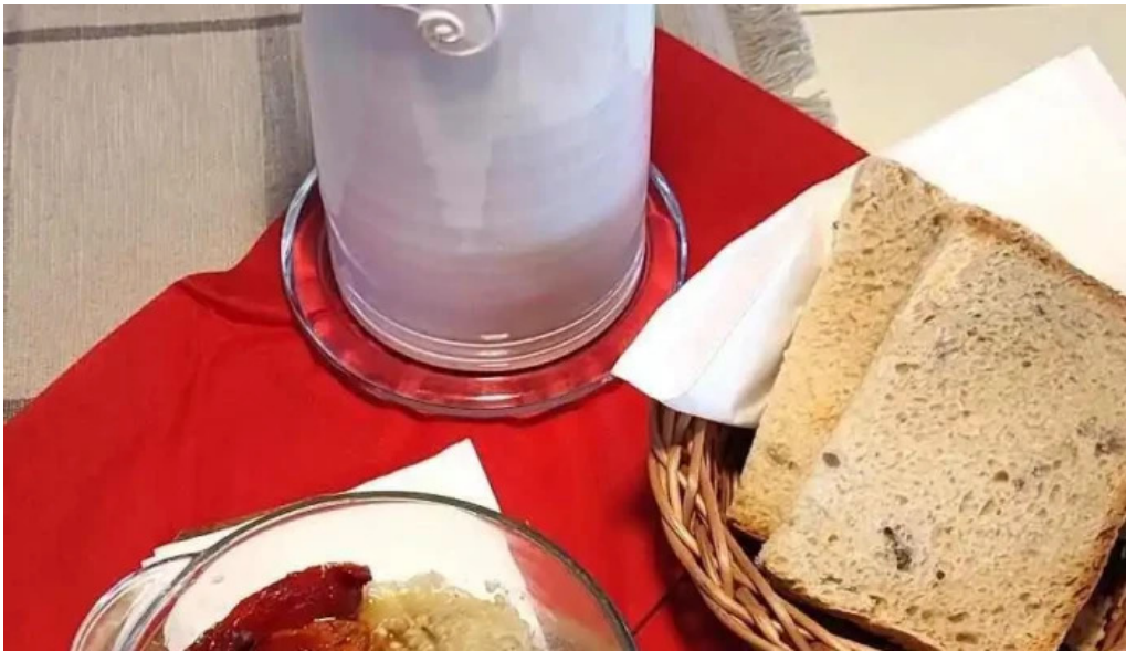
Bradulet arges mancaruribauturi