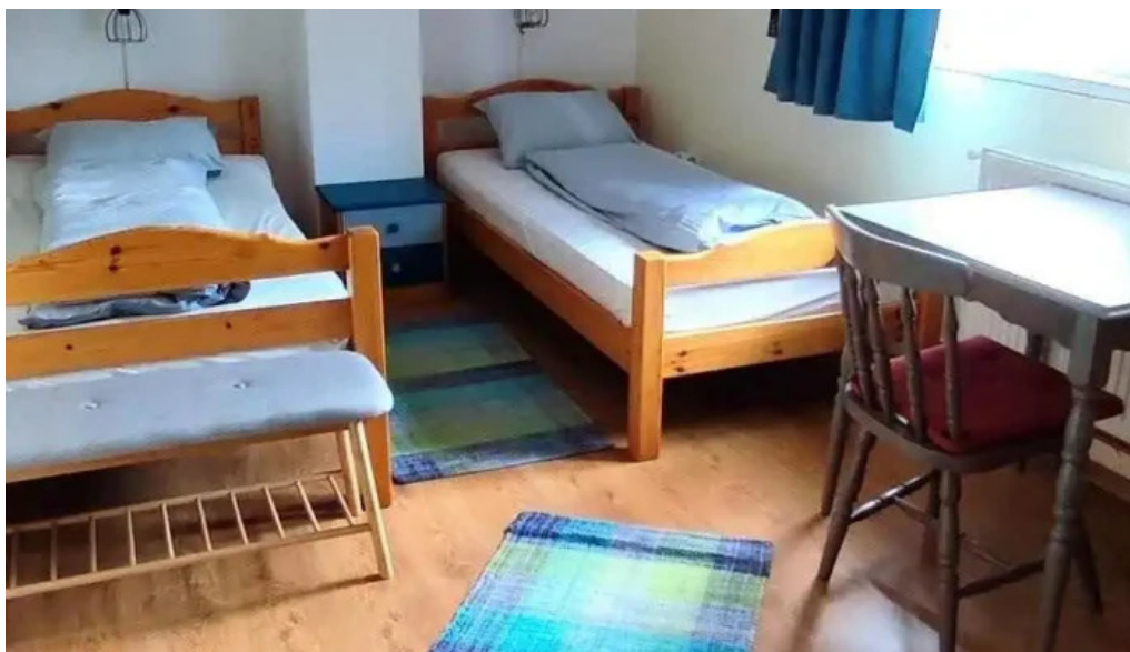
Bradulet arges camere