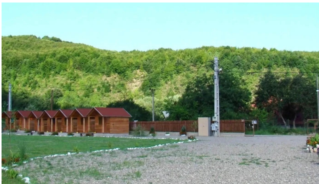
Camping vadu crisului fotografii