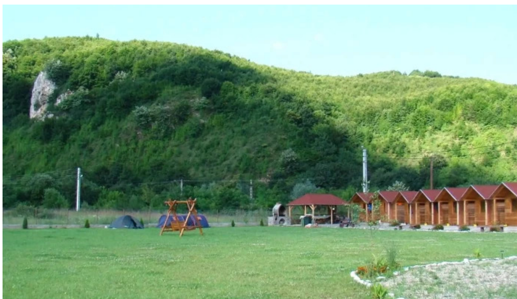
Camping vadu crisului zon?