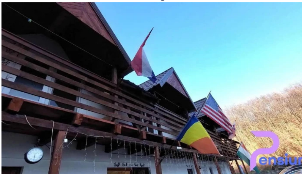
Camping vadu crișului vadu crișului