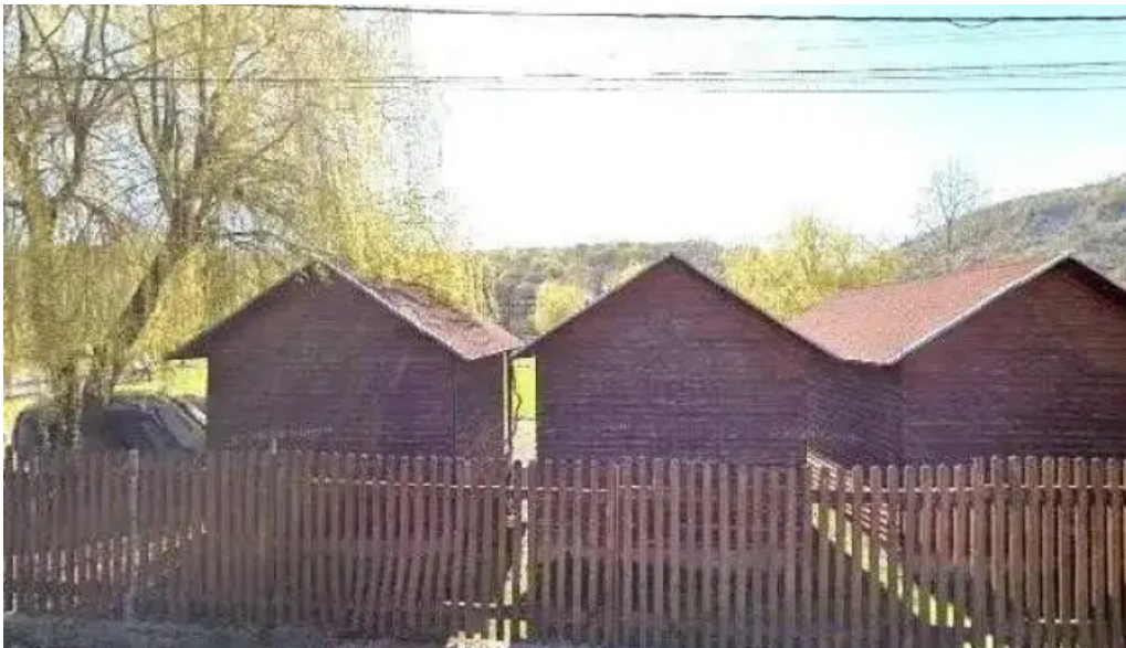
Camping vadu crisului street view si 360deg