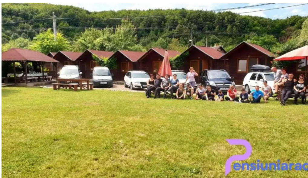
Camping vadu crisului exterior