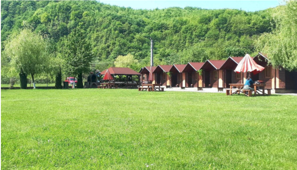
Camping vadu crisului promo?ie