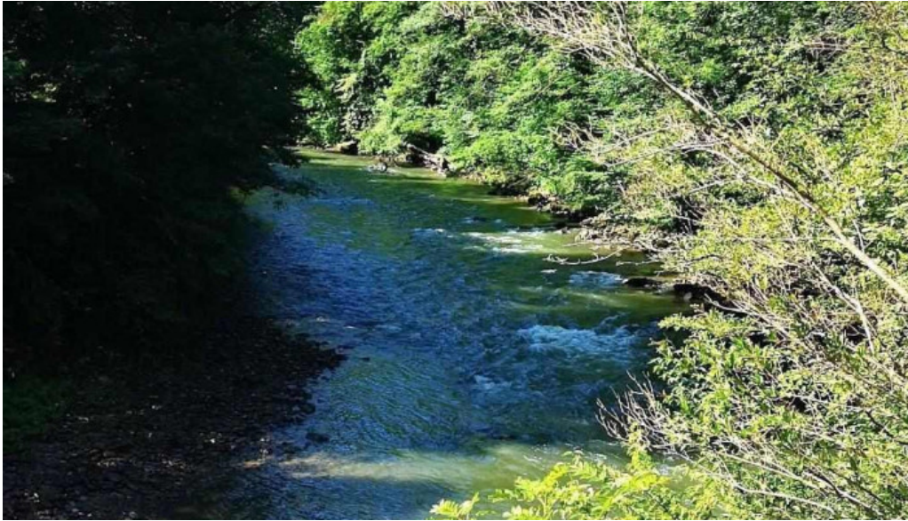
Camping vadu crisului de la vizitatori