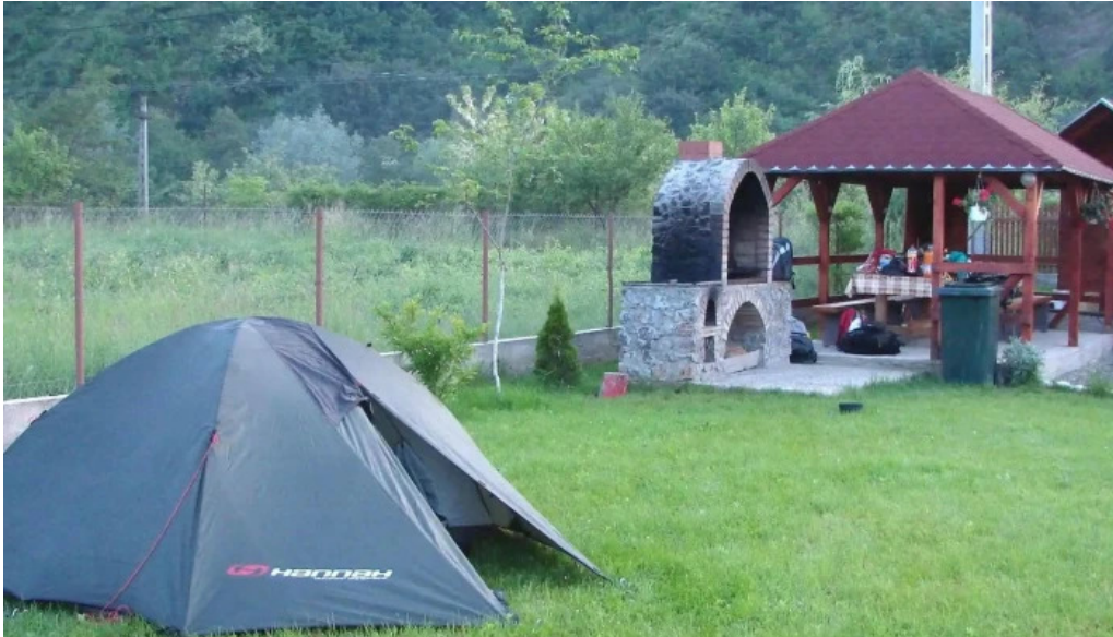
Camping vadu crisului unde