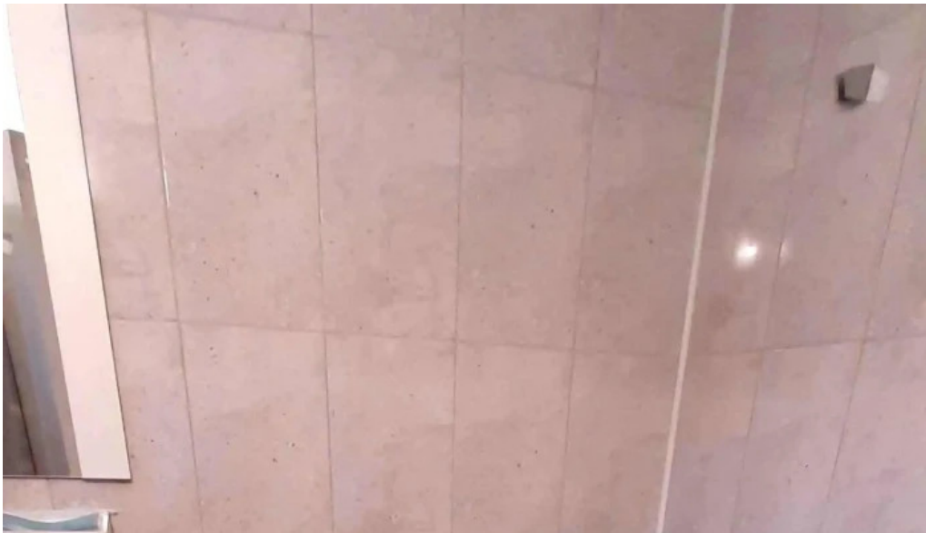
Camping vadu crisului pre?uri