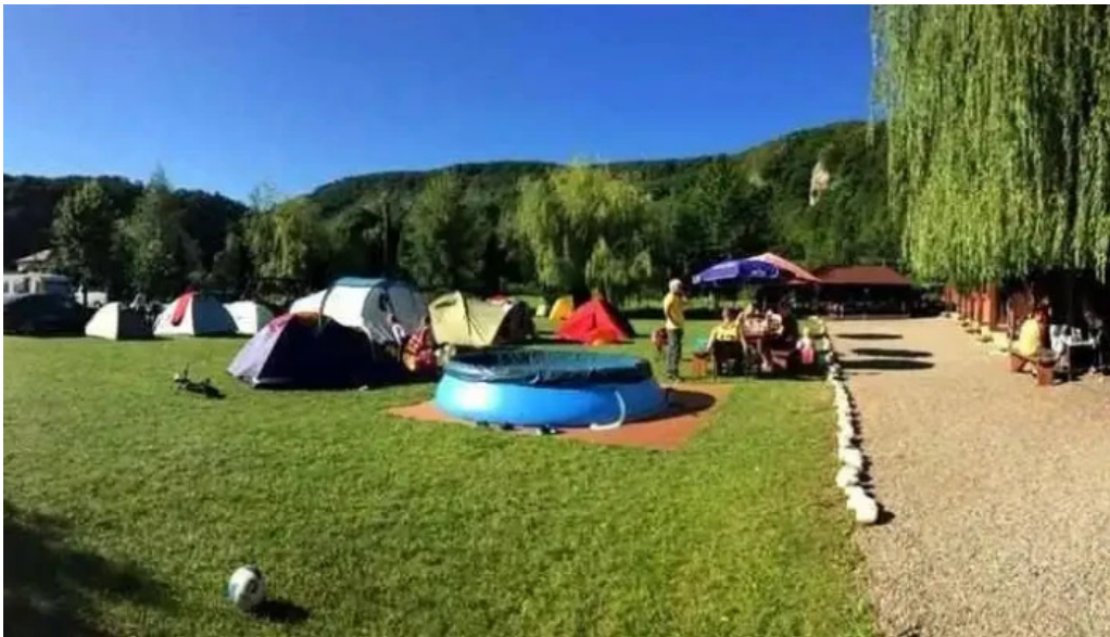
Camping vadu crisului de la proprietar