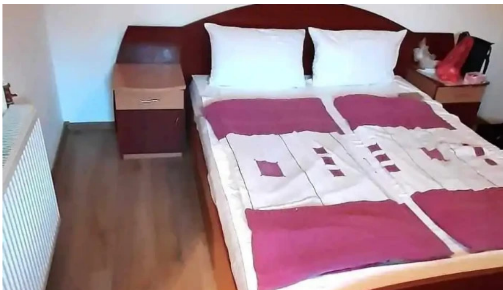
Camping vadu crisului camere