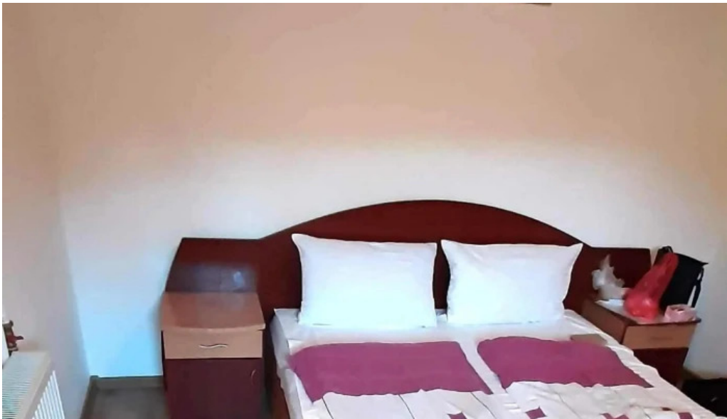
Camping vadu crisului vadu cri?ului