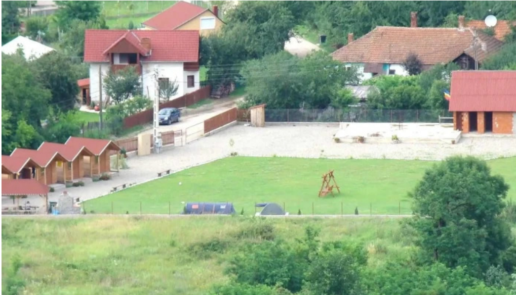
Camping vadu crisului num?r