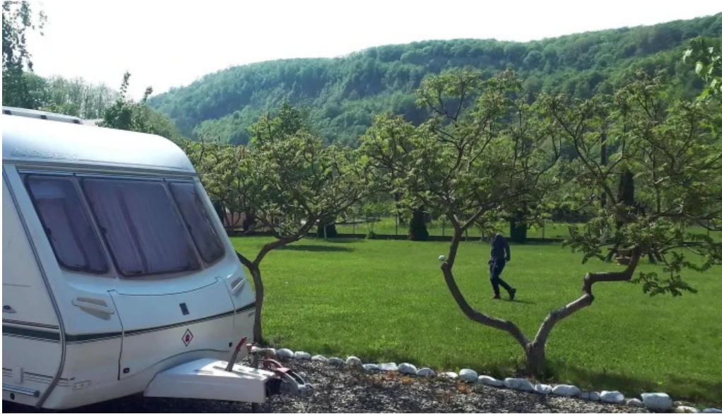
Camping vadu crisului videoclipuri