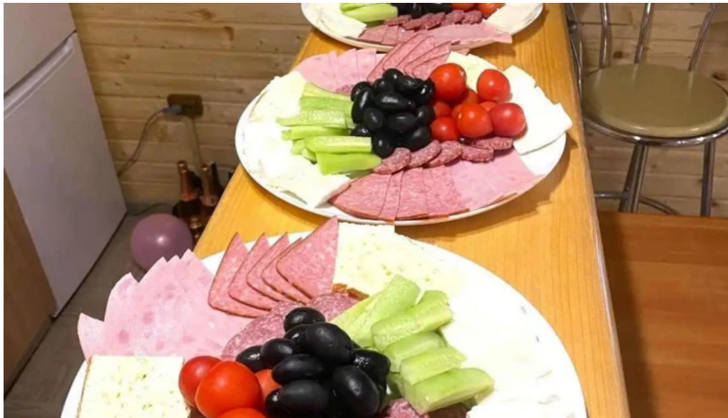
Cabana serban mancaruribauturi