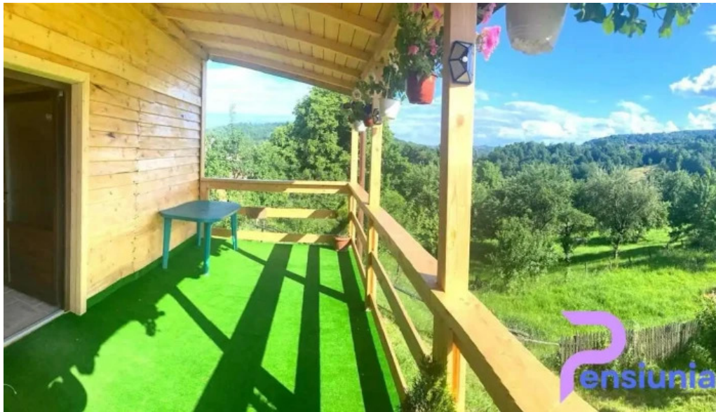
Cabana ?erban bughea de jos