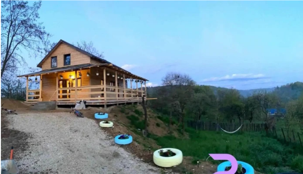
Cabana serban exterior