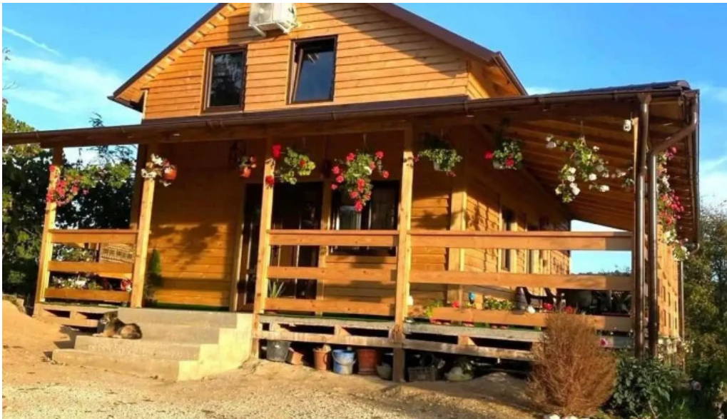
Cabana serban de la vizitatori