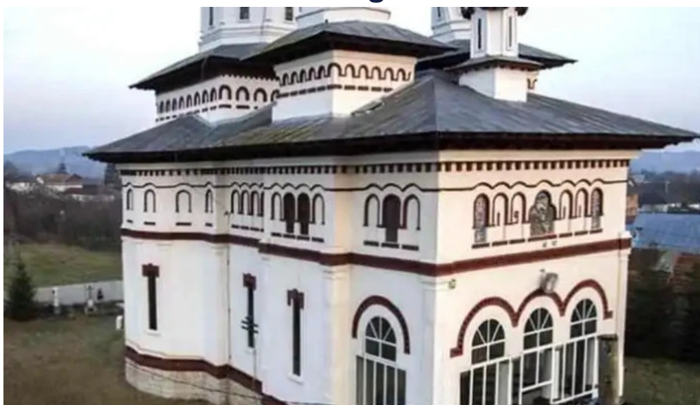
Biserica nouă comuna brebu