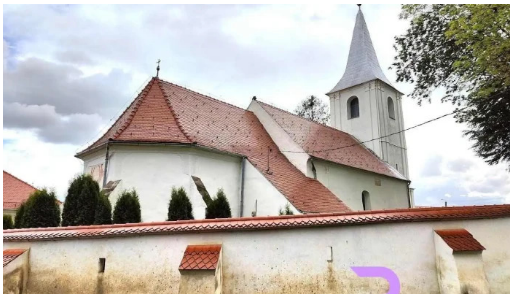
Biserica romano catolica fortificata misentea misentea