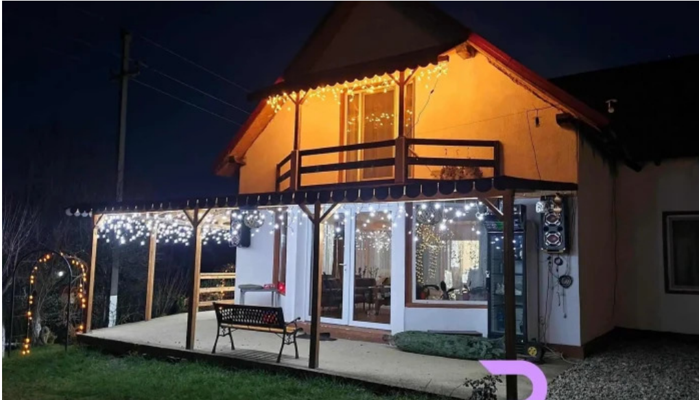
Casa la galatanu de la vizitatori