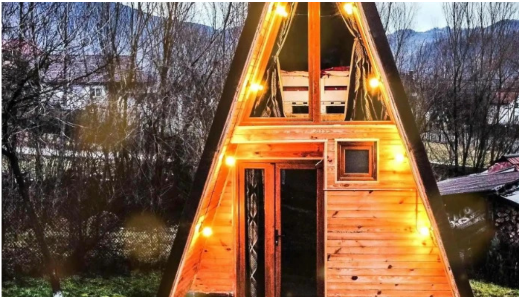
Casa la galatanu videoclipuri