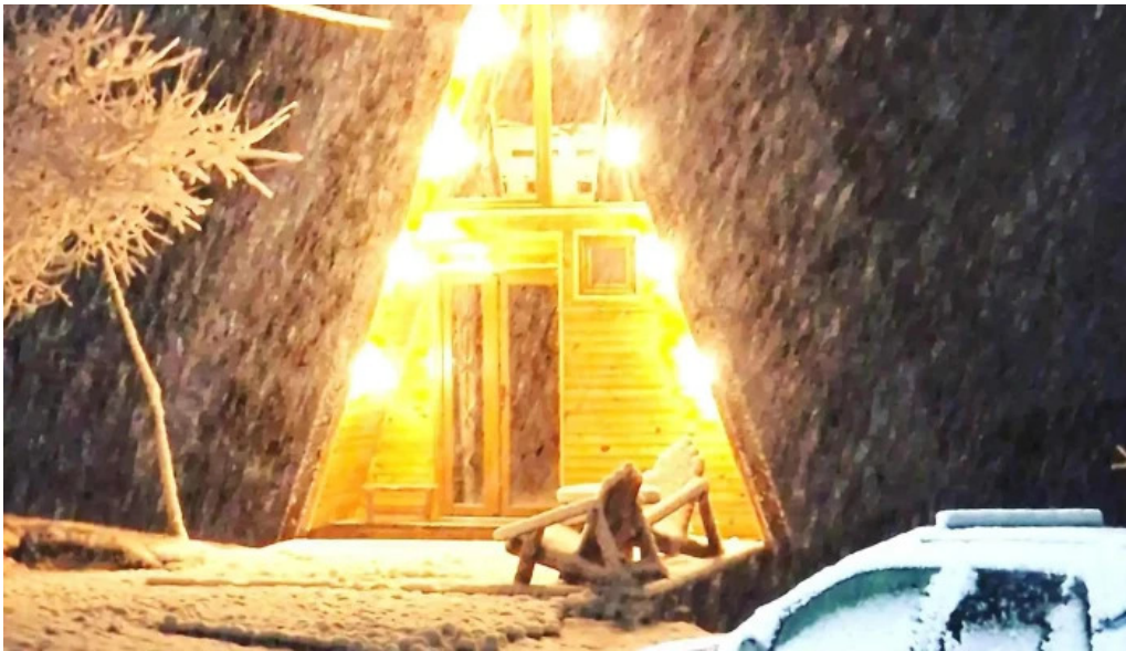
Casa la galatanu exterior