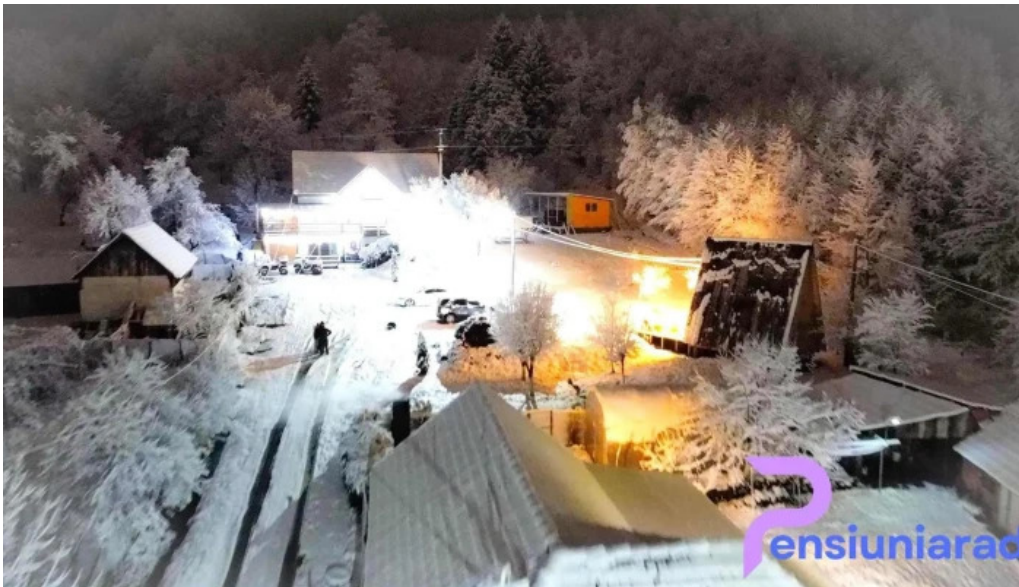
Casa la galatanu de la proprietar