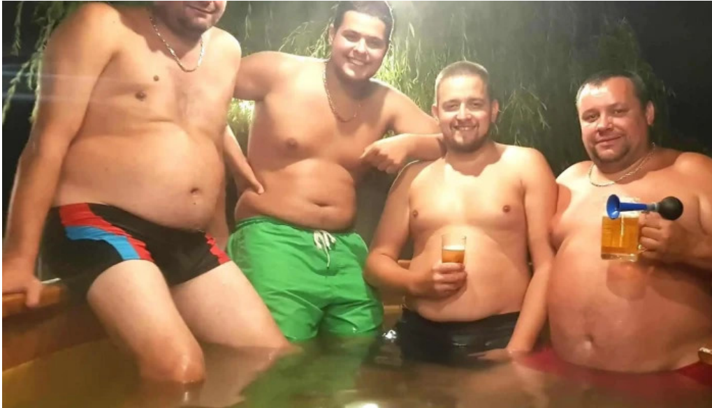
Casa la galatanu vulcan