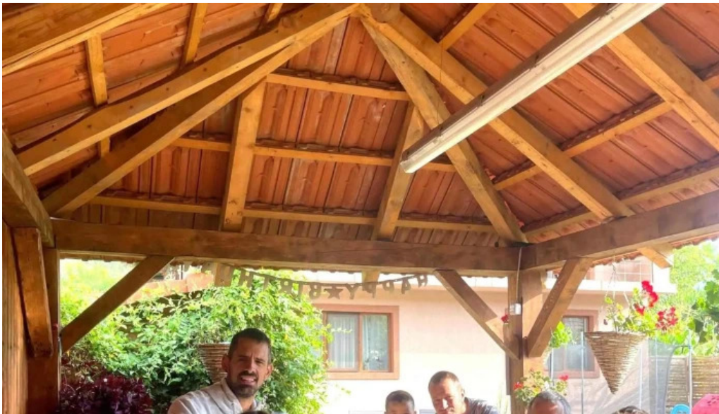
Agropensiunea ioana unde