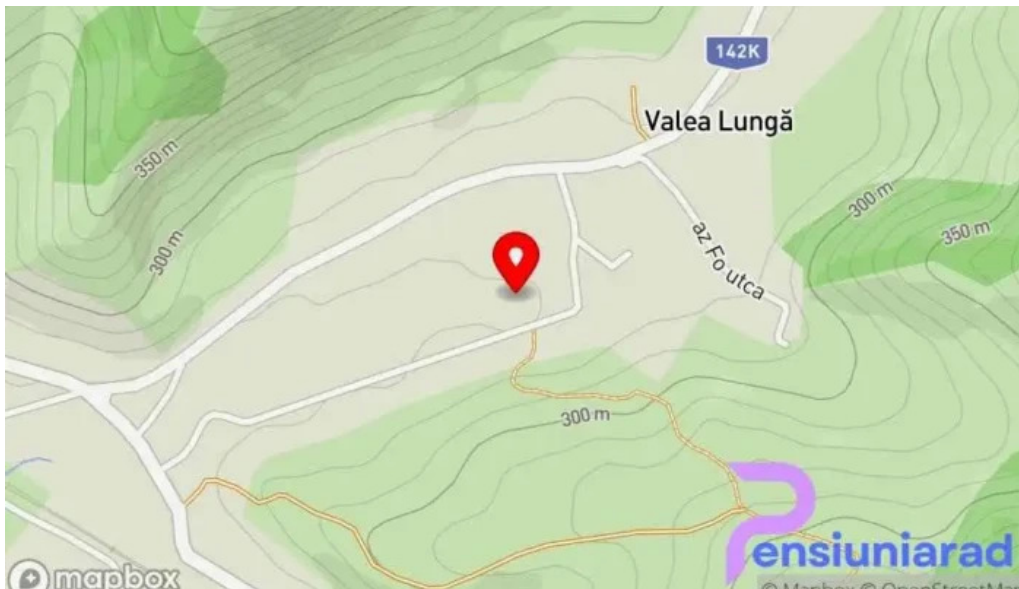
Agropensiunea ioana hart?