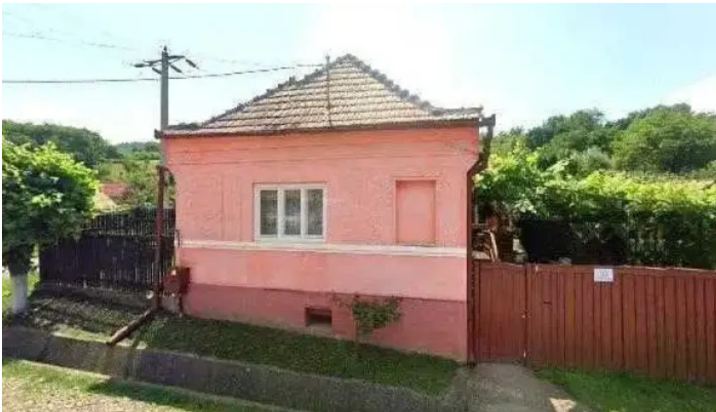
Agropensiunea ioana street view si 360deg