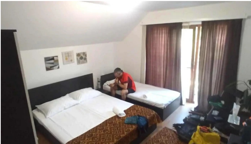
Agropensiunea ioana camere