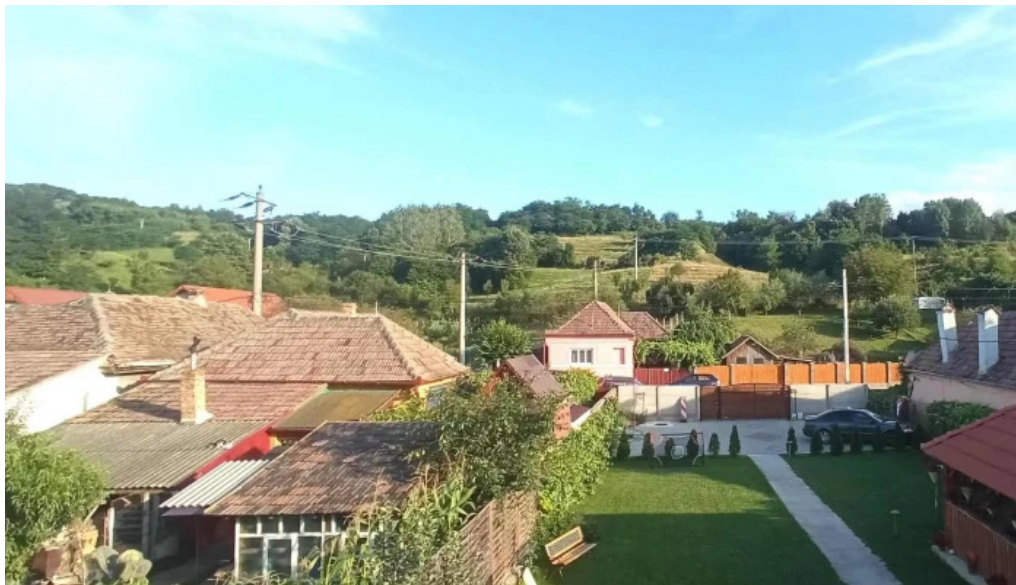
Agropensiunea ioana videoclipuri