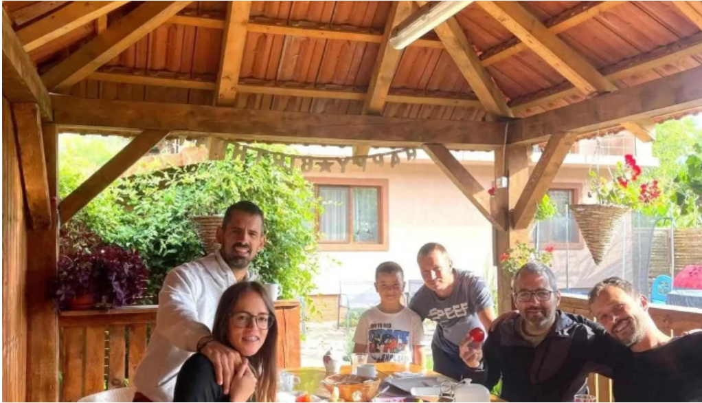
Agropensiunea ioana de la vizitatori