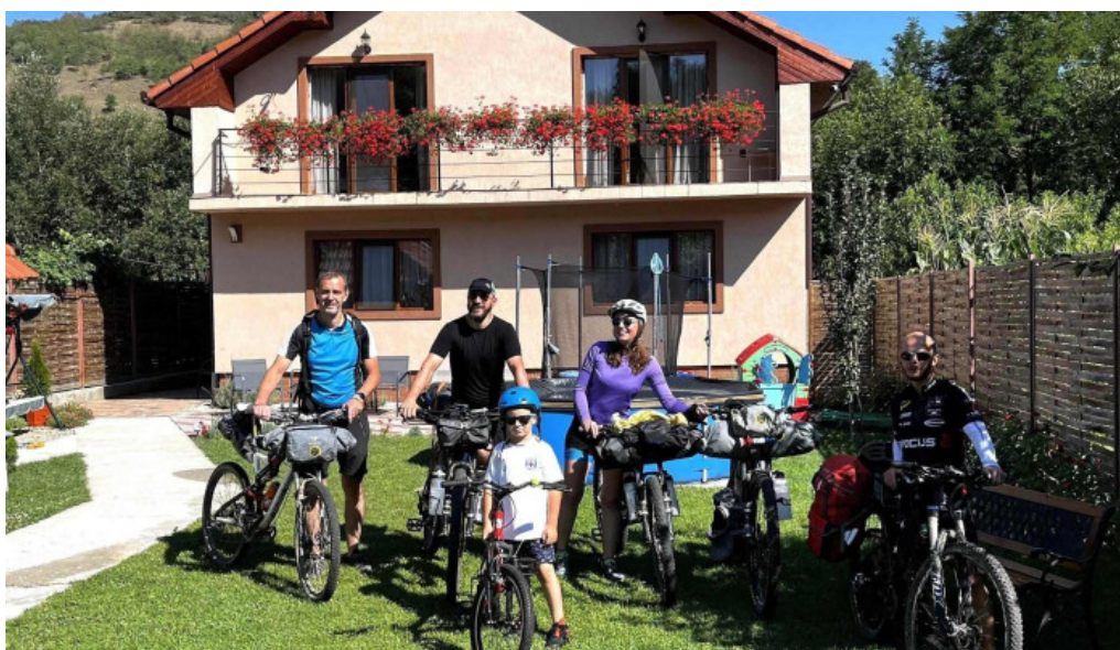
Agropensiunea ioana valea lung?