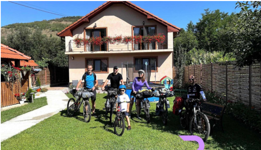
Agropensiunea ioana exterior