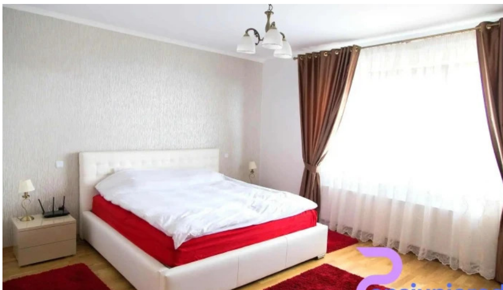
Pensiunea andrei camere