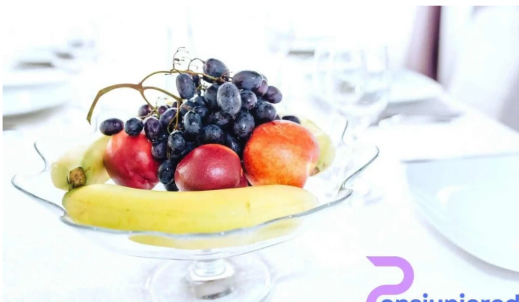
Pensiunea andrei mancaruribauturi