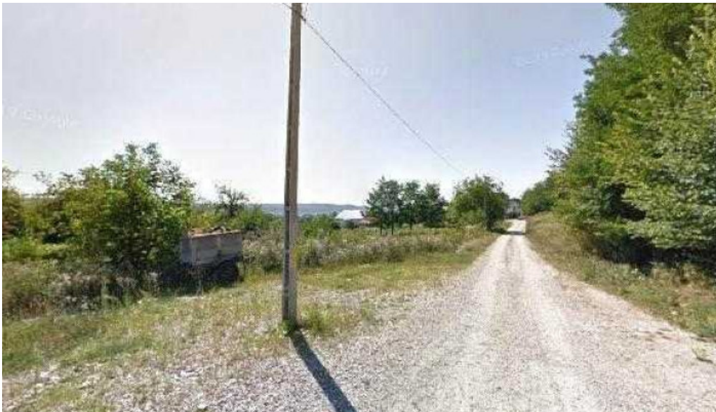
Pensiunea andrei street view si 360deg