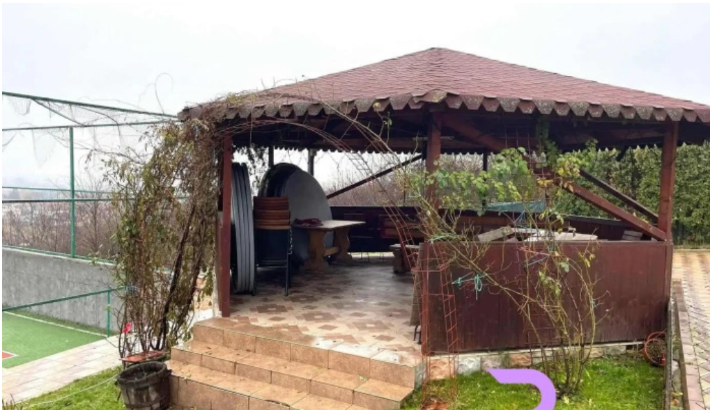
Pensiunea andrei exterior