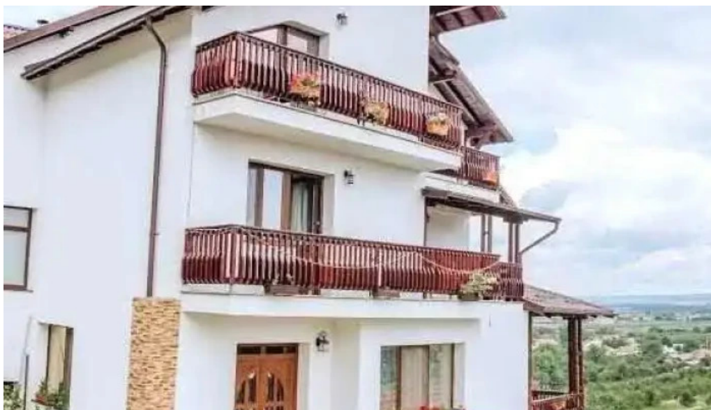
Pensiunea andrei sat argeselu nr 248