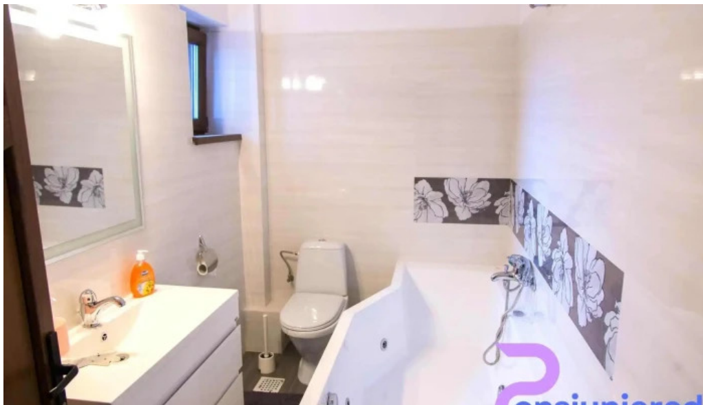
Pensiunea andrei de la proprietar