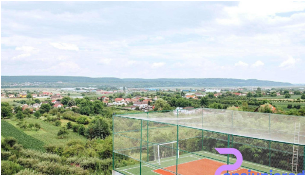
Pensiunea andrei telefon