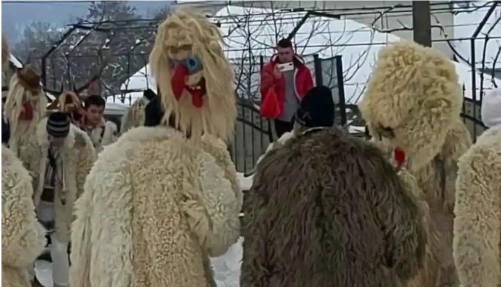
Pensiunea georgiana videoclipuri