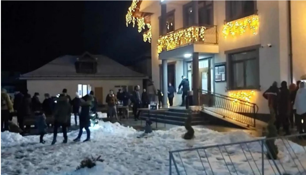
Pensiunea georgiana exterior