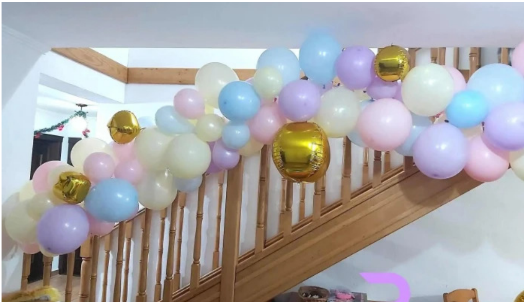
Pensiunea georgiana de la vizitatori