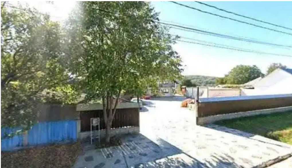
Pensiunea georgiana street view si 360deg