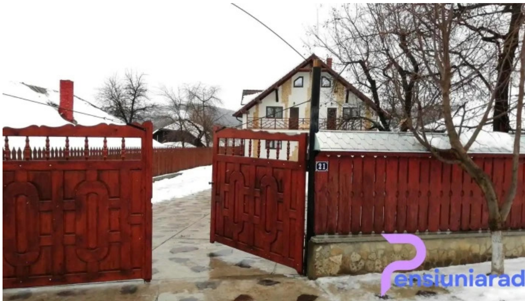
Pensiunea georgiana num?r