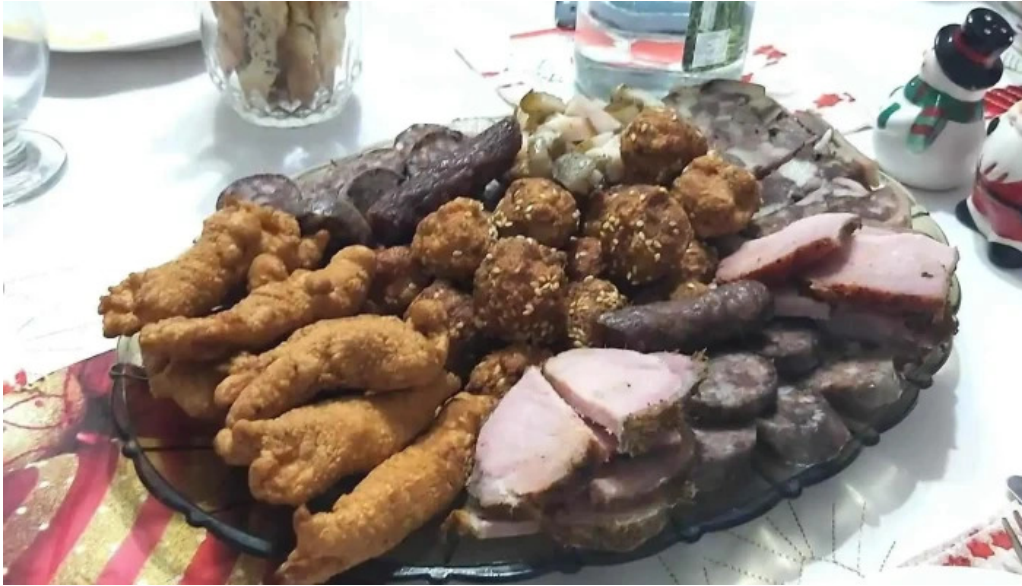
Pensiunea georgiana mancaruribauturi