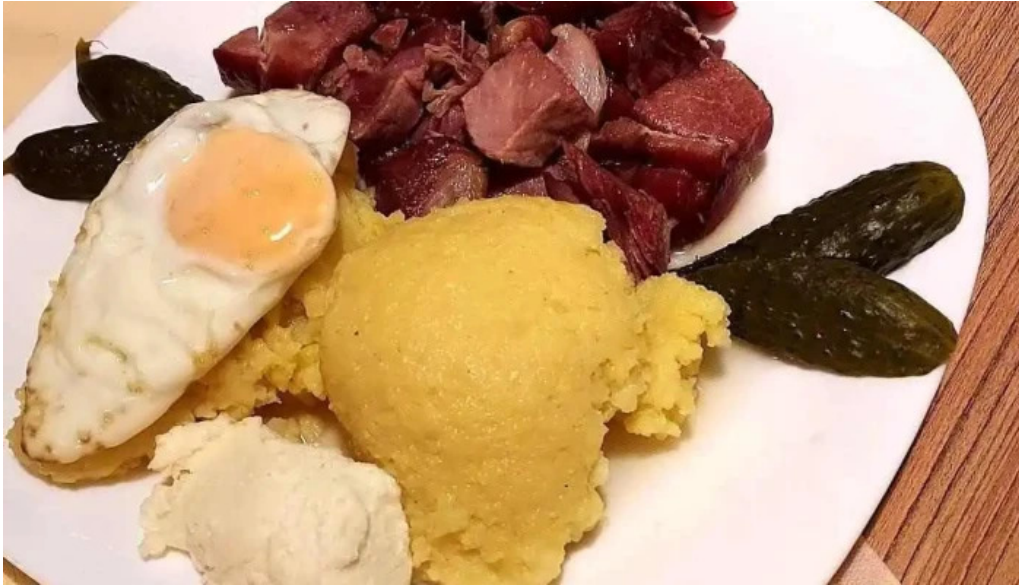
Pietrele doamnei mancaruribauturi