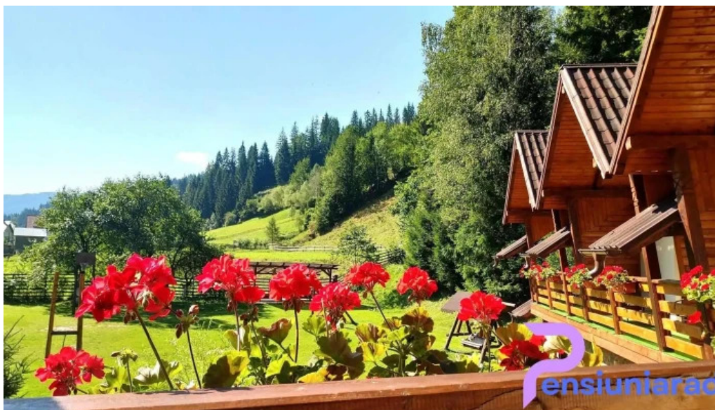
Pietrele doamnei cabana