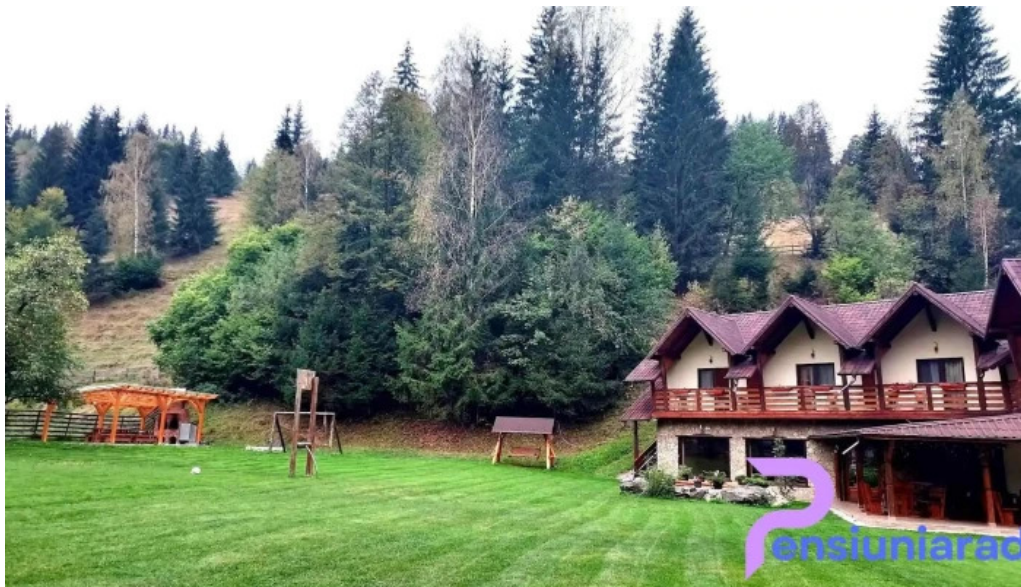
Pietrele doamnei reduceri