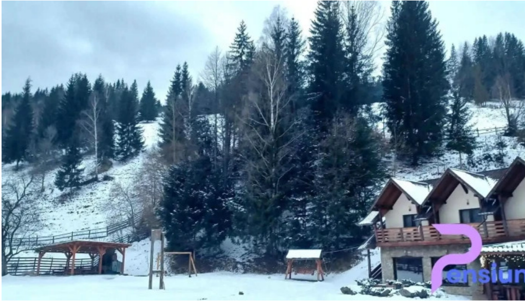
Pietrele doamnei cele mai recente