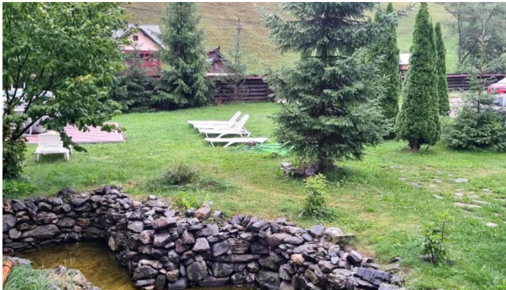
Pietrele doamnei de la vizitatori