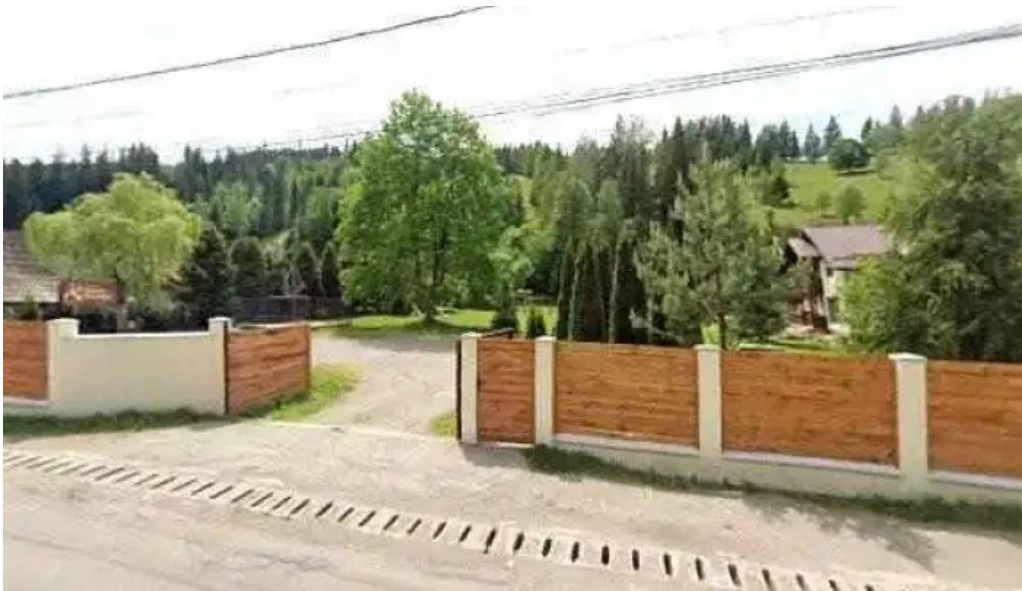
Pietrele doamnei street view si 360deg