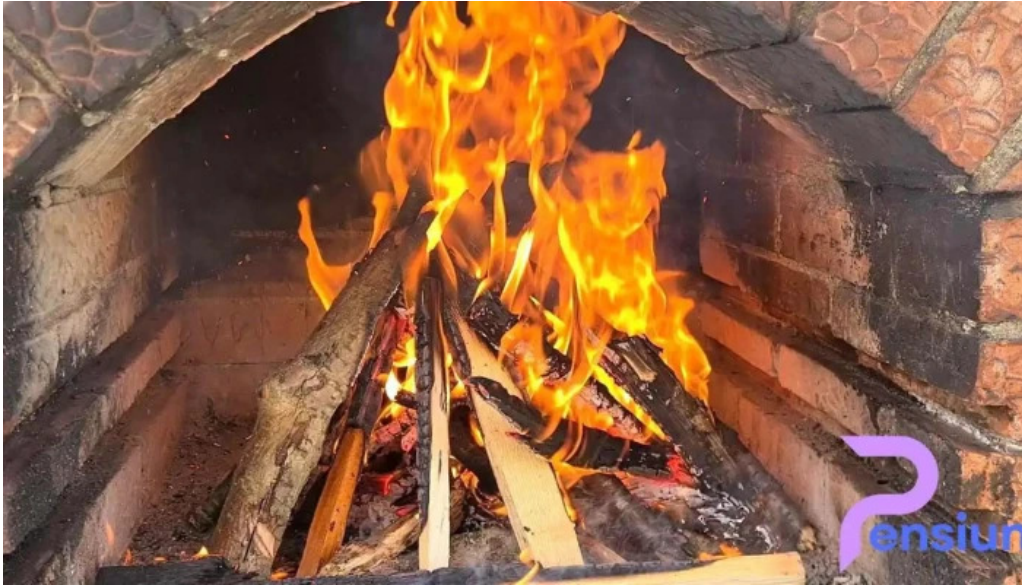
Pietrele doamnei videoclipuri