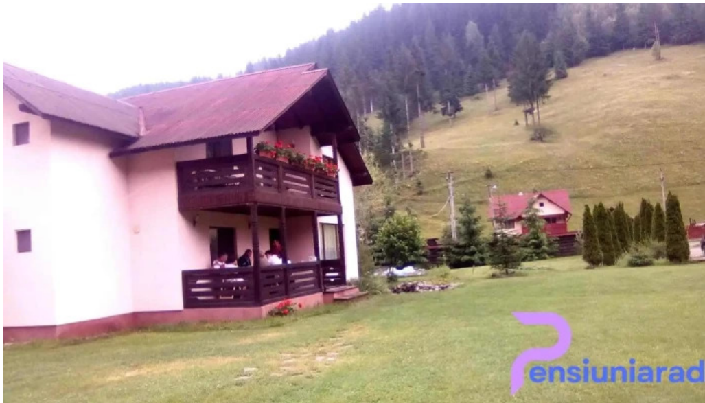
Pietrele doamnei exterior