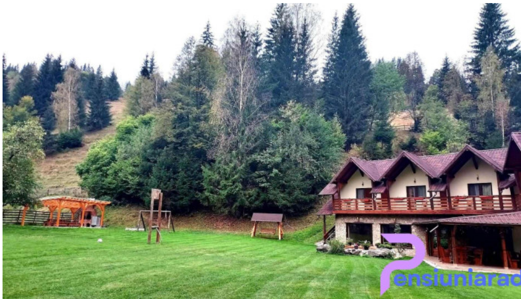
Pietrele doamnei pojorata