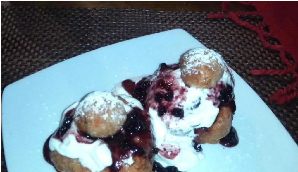
Vila melinda mancaruribauturi