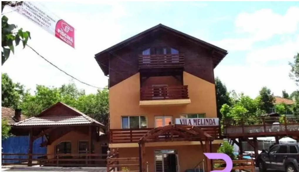
Vila melinda aproape de mine