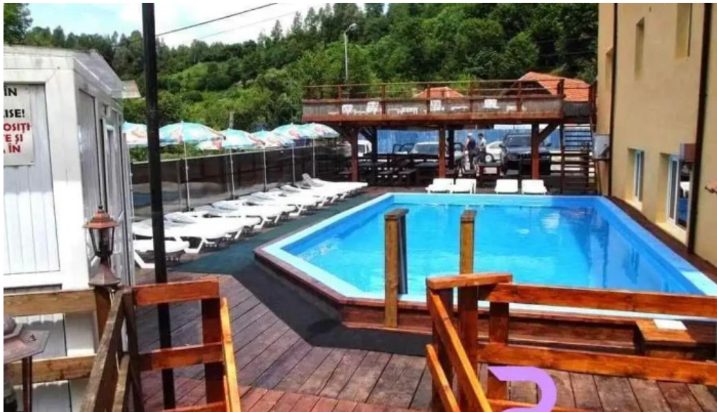
Vila melinda dotari