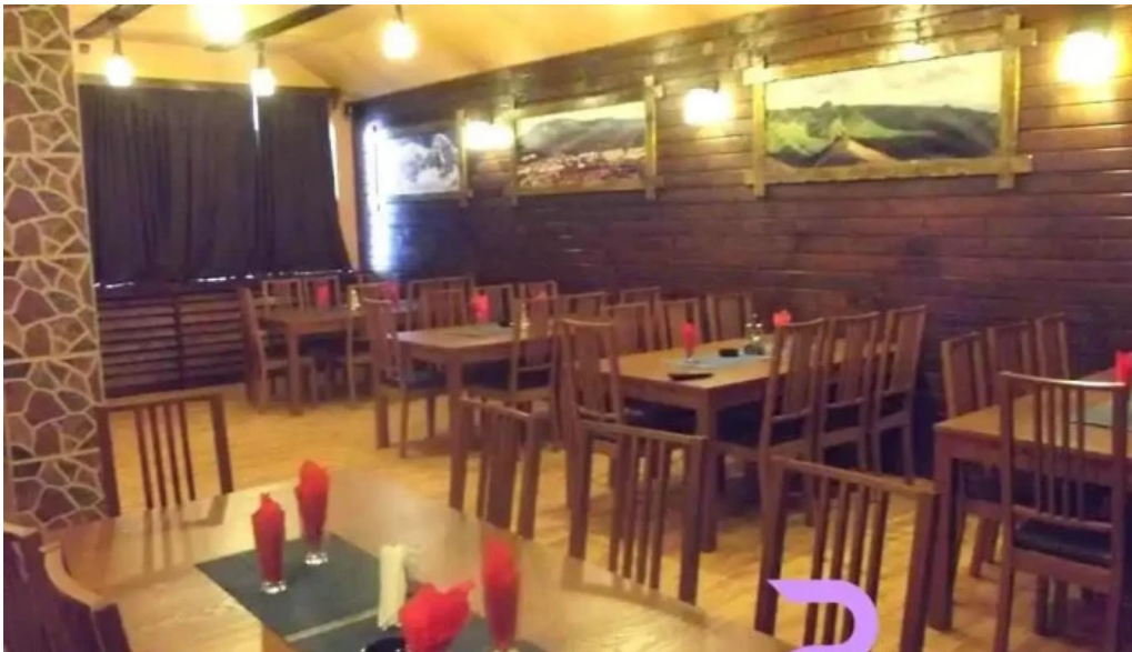
Vila melinda de la proprietar