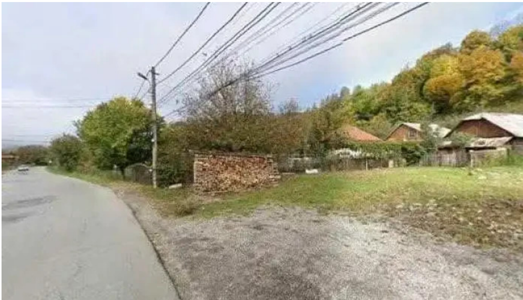
Vila melinda street view si 360deg