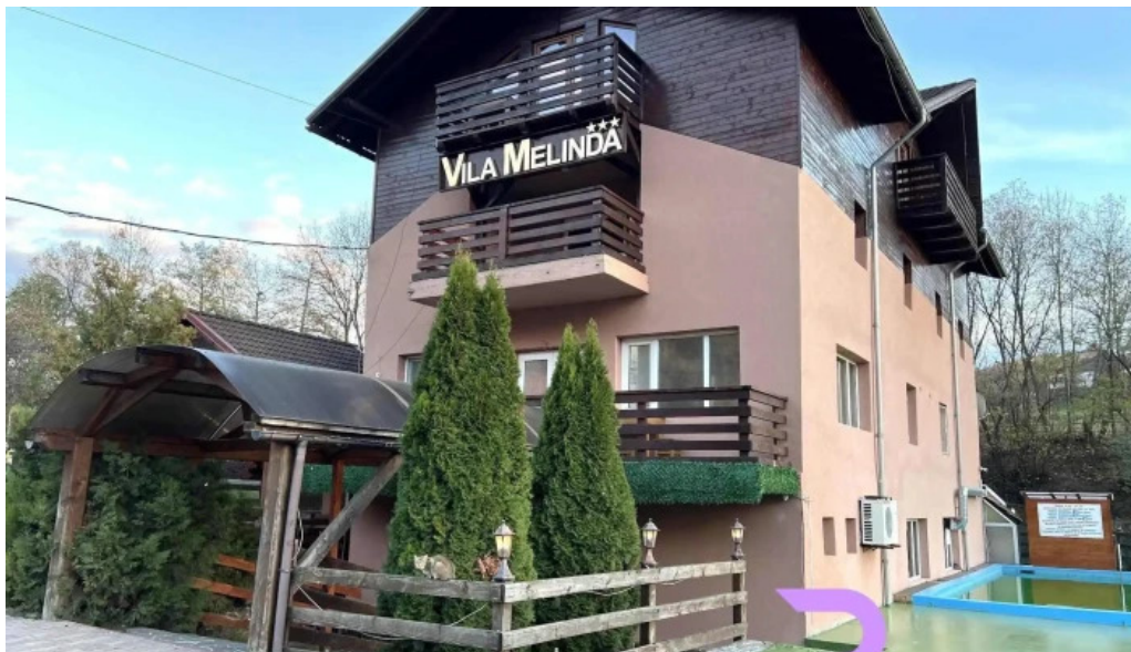
Vila melinda de la vizitatori