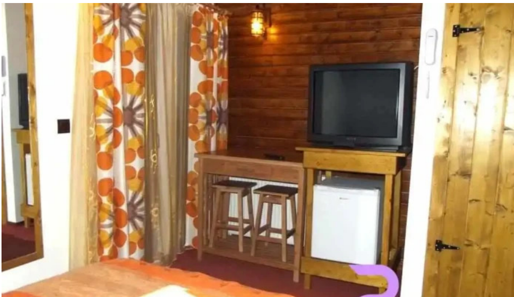
Vila melinda camere