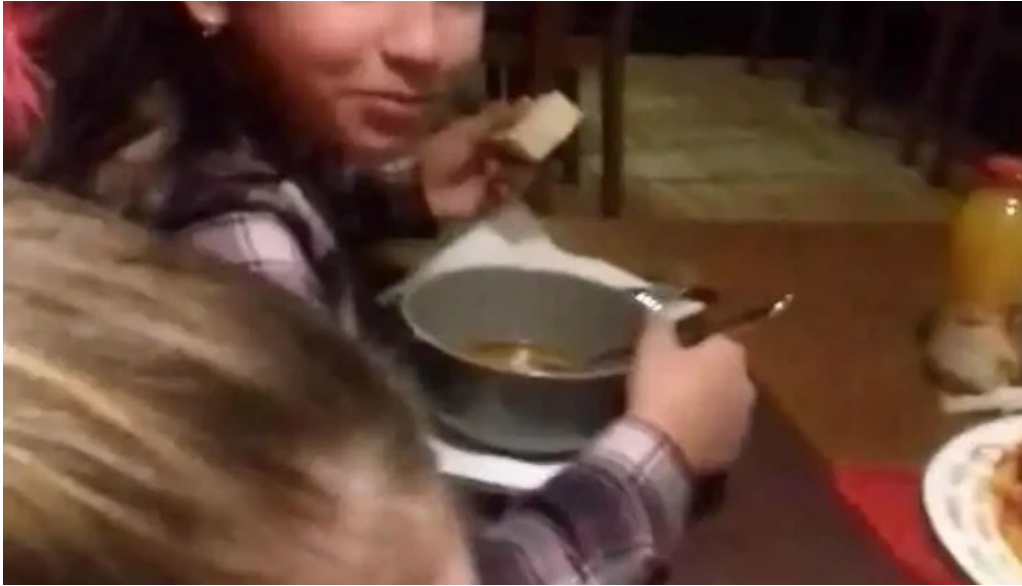
Vila melinda videoclipuri