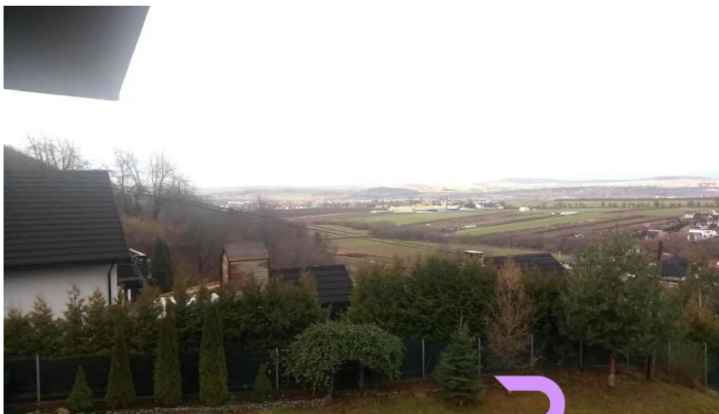
Dragomirna sunset cabana