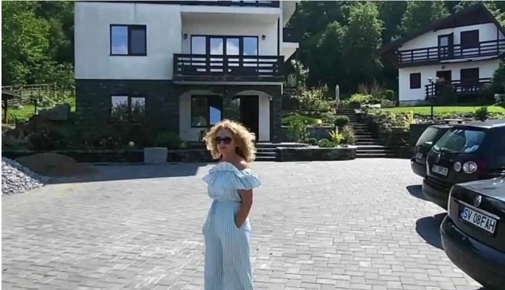
Dragomirna sunset videoclipuri