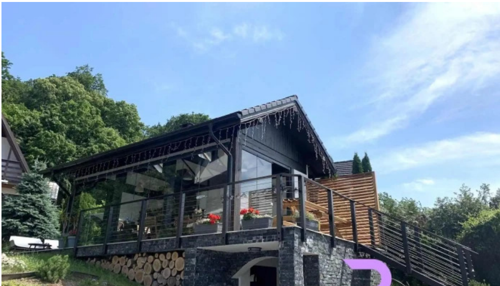
Dragomirna sunset scor