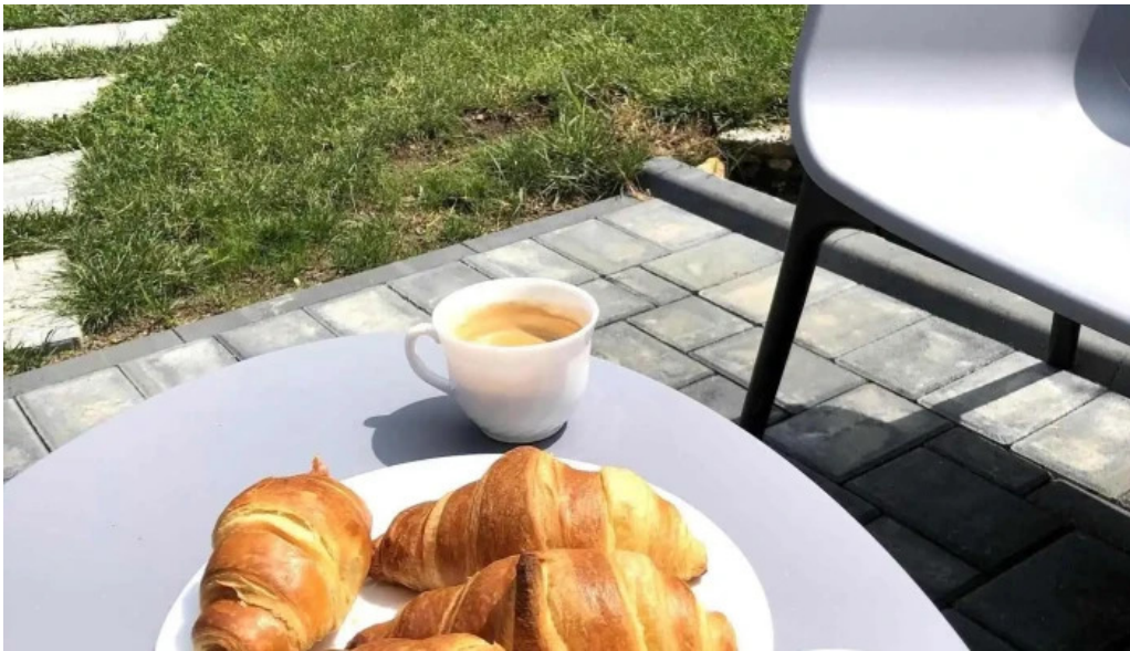
Dragomirna sunset mancaruribauturi