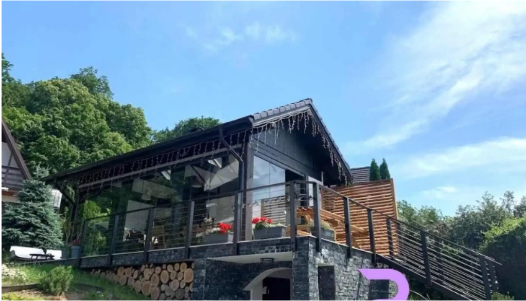
Dragomirna sunset mitoca?i