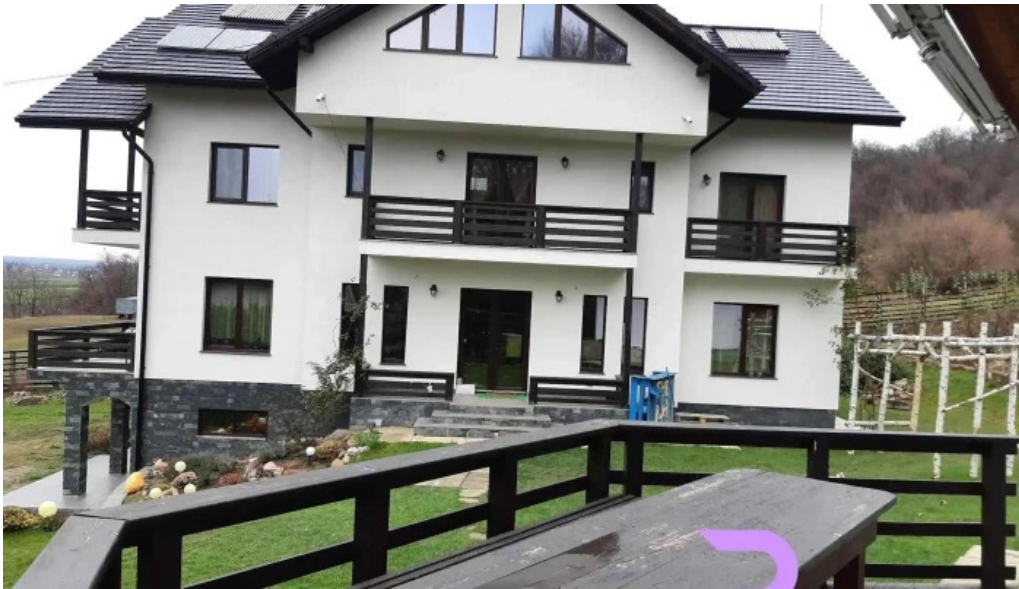
Dragomirna sunset exterior