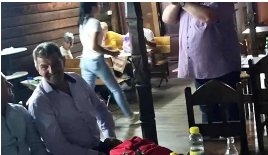
Hanul lupilor videoclipuri