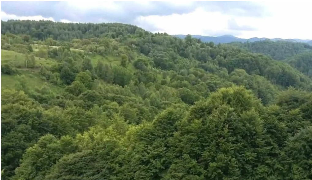
Hanul lupilor catalog