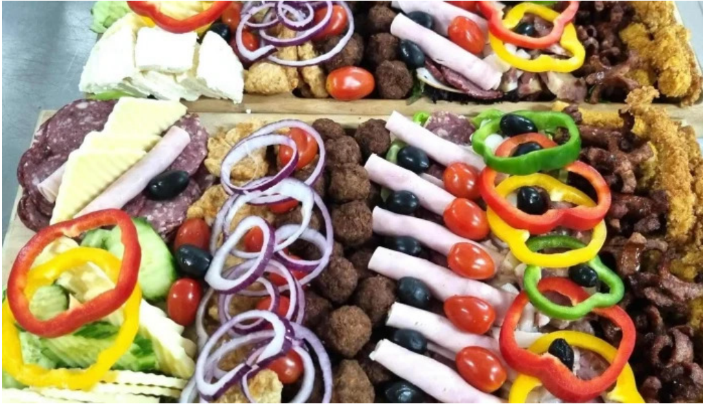
Hanul lupilor de la vizitatori