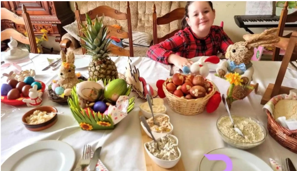
Hanul lupilor mancaruribauturi