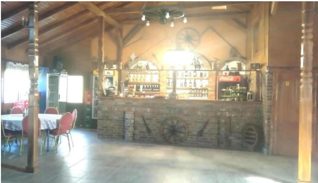
Hanul lupilor instagram