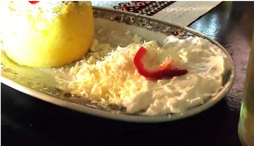
Hanul lupilor loca?ie