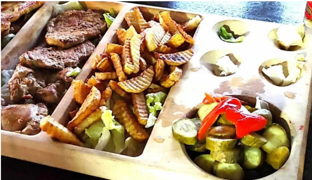
Hanul lupilor lunca cernii de jos