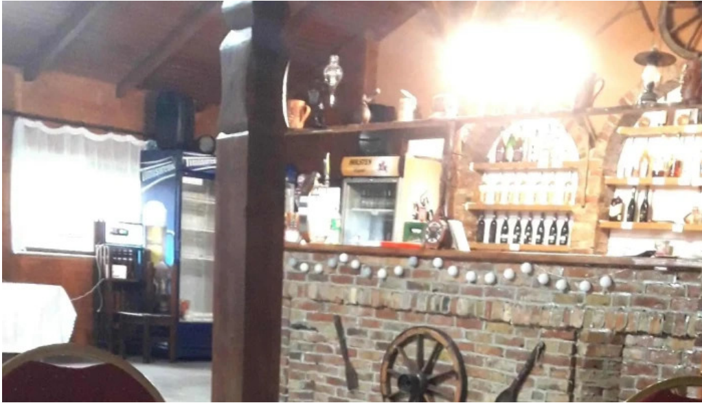
Hanul lupilor telefon