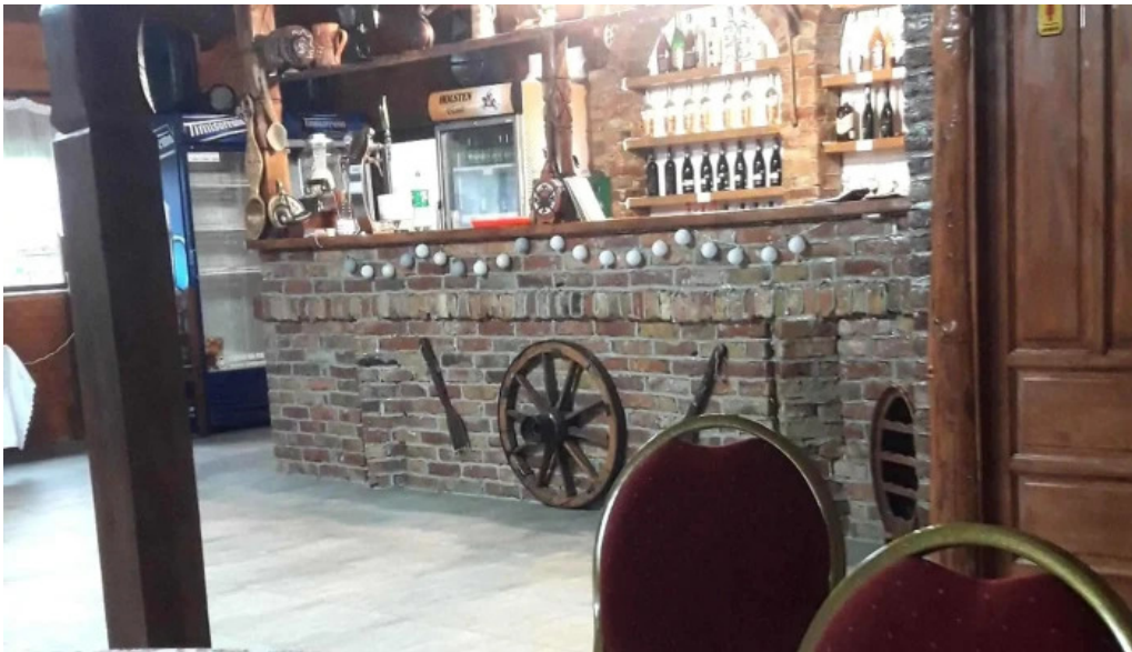
Hanul lupilor promo?ie