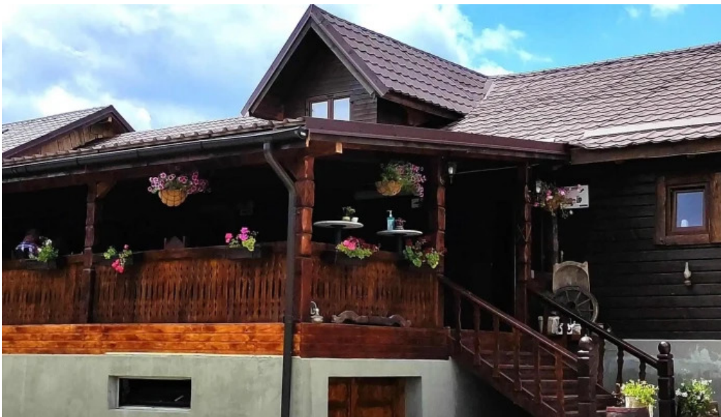
Hanul lupilor program