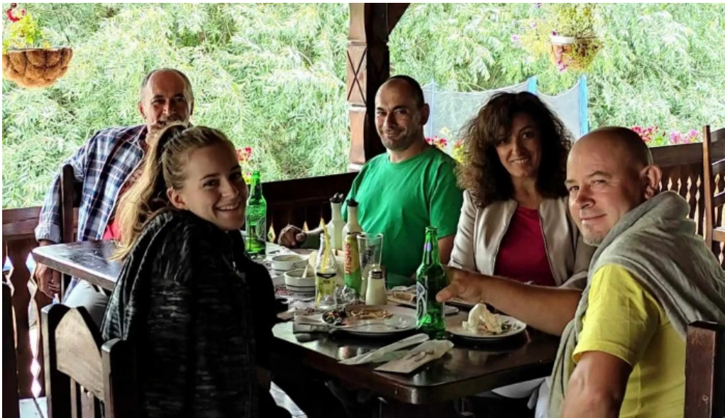
Hanul lupilor reduceri